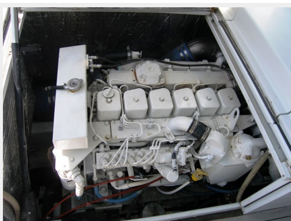
Main Engine Port