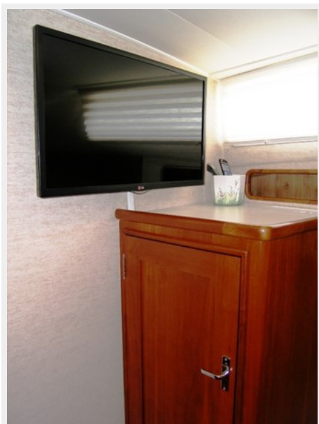
Master TV & Locker