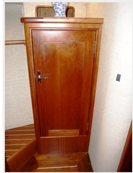
Master Hanging Locker