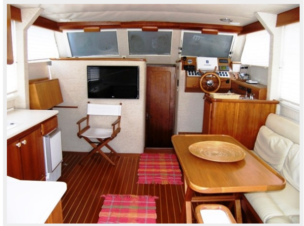
Salon View Forward