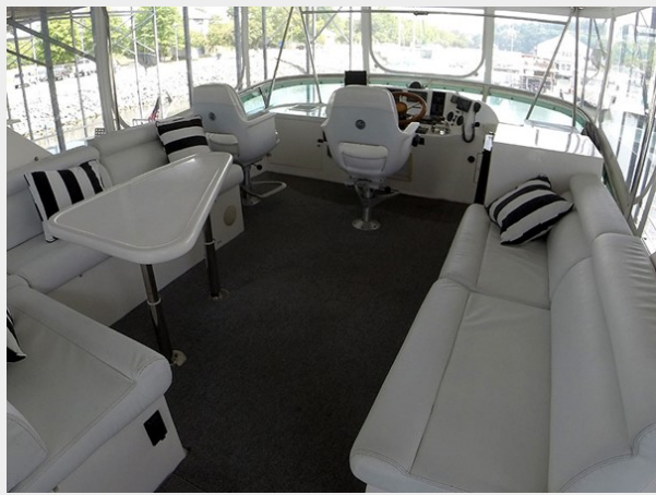
Prima 45 flybridge forward