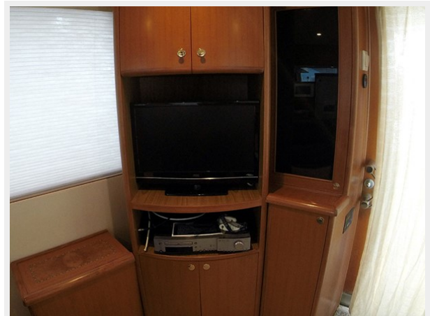
Prima 45 salon entertainment center