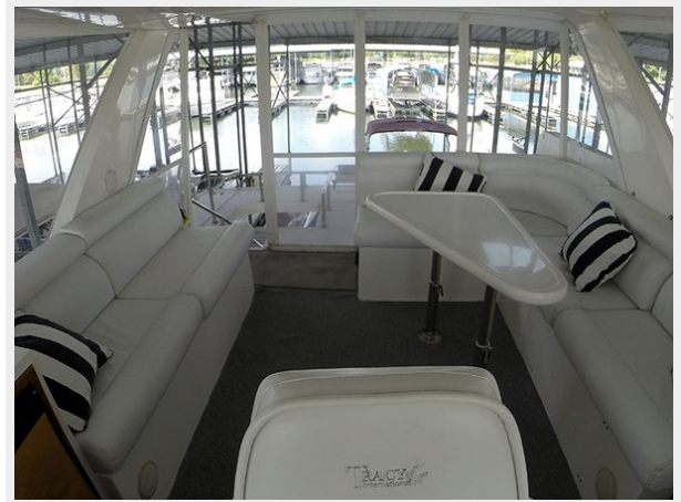
Prima 45 flybridge aft