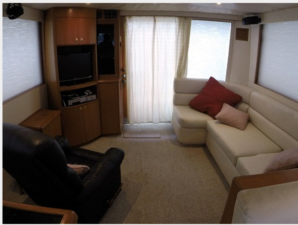
Prima 45 salon aft