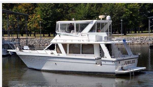
Prima 45 port aft profile