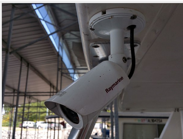
Prima 45 aftdeck camera