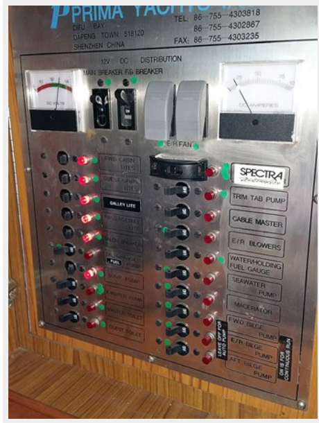
Prima 45 electrical panel1