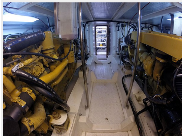
Prima 45 engine room aft