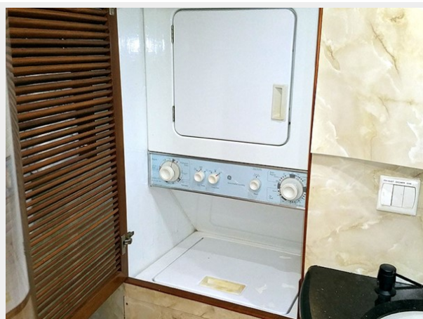
Prima 45 washer & dryer