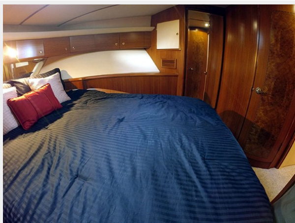
Prima 45 master stateroom starboard