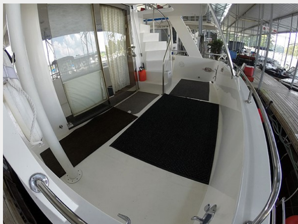
Prima 45 cockpit starboard