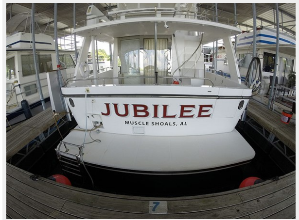
Prima 45 swimplatform