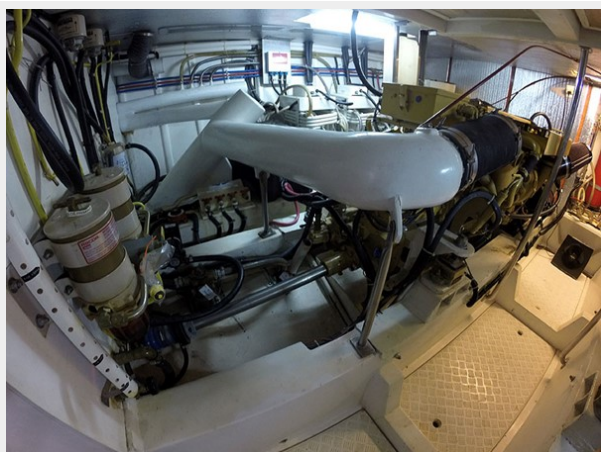
Prima 45 engine room port