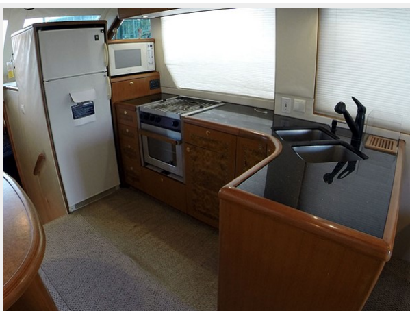
Prima 45 galley