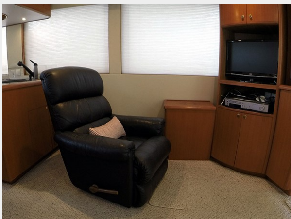
Prima 45 salon starbaord