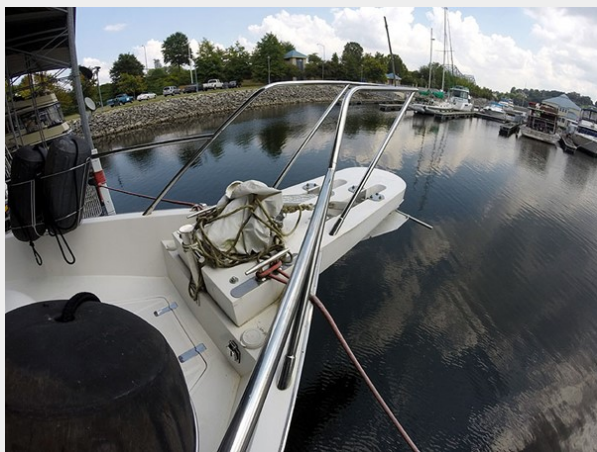
Prima 45 pulpit