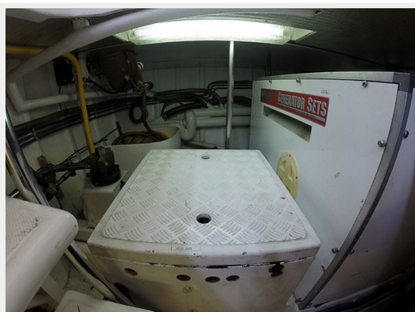
Prima 45 lazarette port