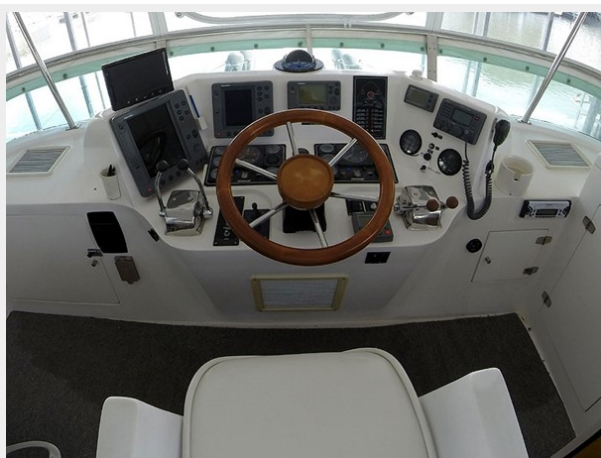
Prima 45 flybridge helm photo1