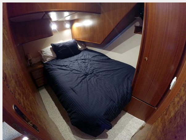
Prima 45 guest stateroom