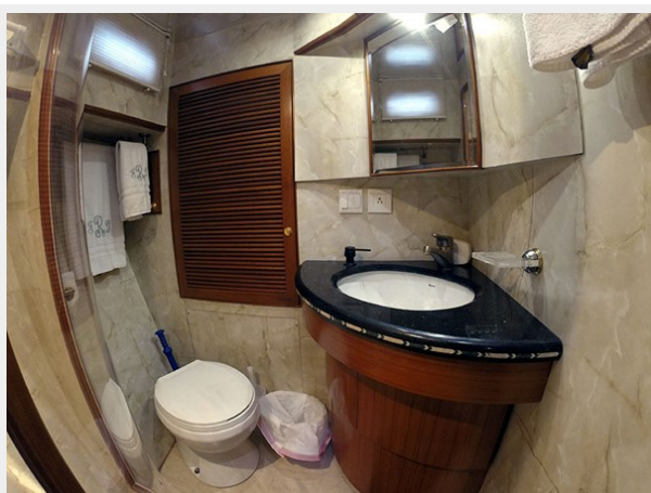
Prima 45 master stateroom head