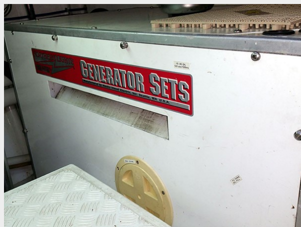
Prima 45 generator