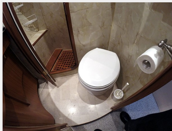
Prima 45 Guest Head Wide