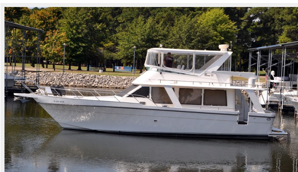
Prima 45 port profile