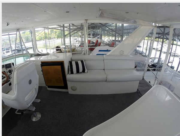
Prima 45 flybridge starboard