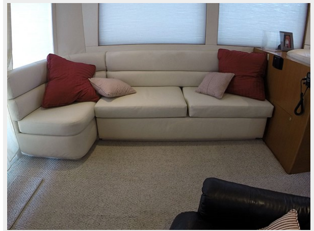
Prima 45 salon port