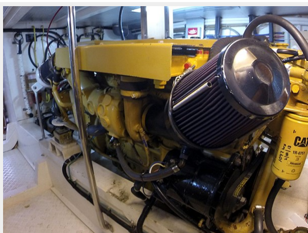
Prima 45 port main engine