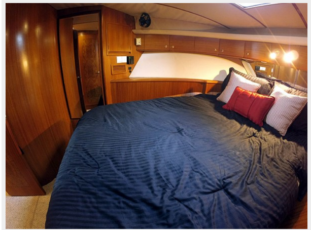
Prima 45 master stateroom port