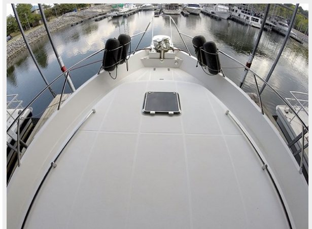
Prima 45 foredeck