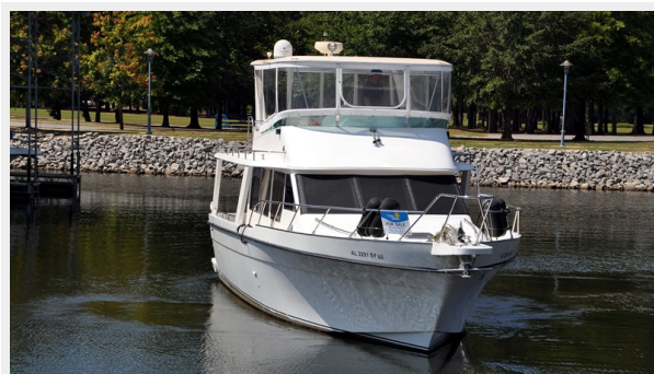
Prima 45 forward profile