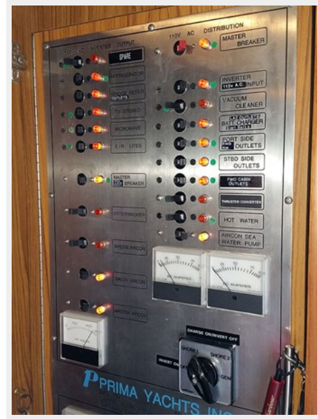
Prima 45 electrical panel2