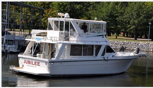
Prima 45 starboard aft profile