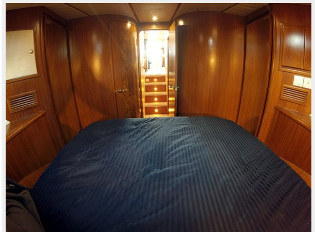
Prima 45 master stateroom aft