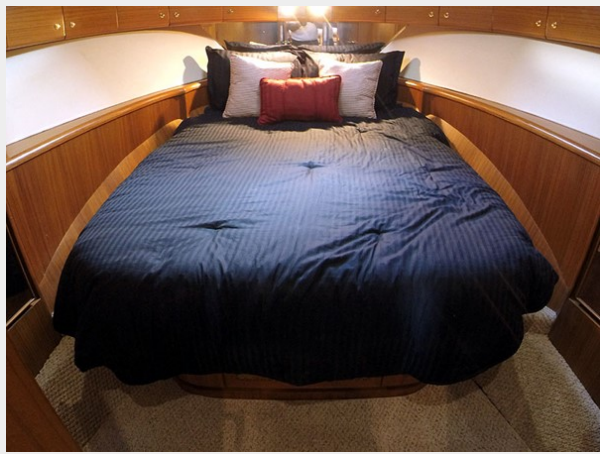
Prima 45 master stateroom