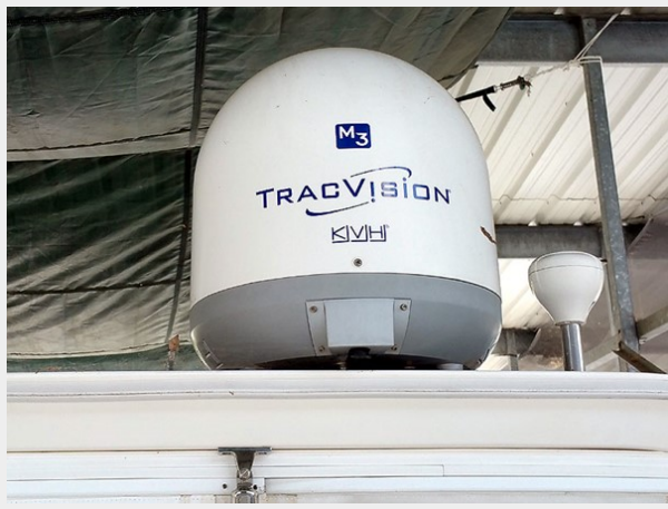
Prima 45 satellite TV