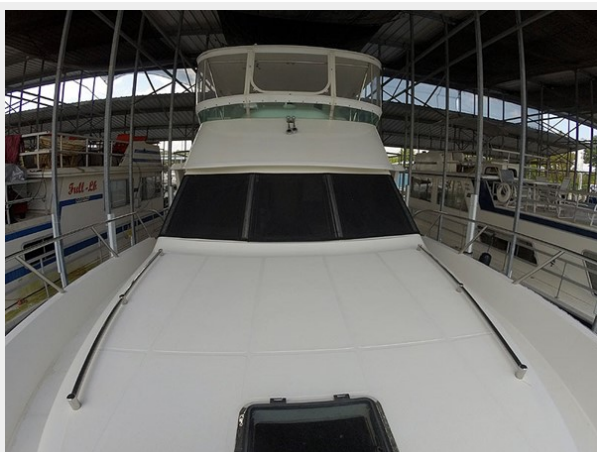
Prima 45 foredeck aft