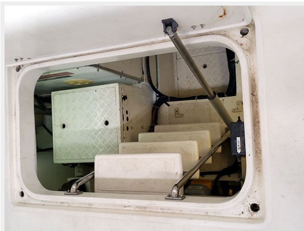
Prima 45 engine room access