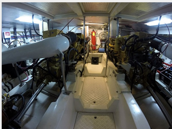
Prima 45 engine room forward