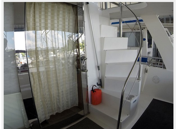
Prima 45 flybridge stairs