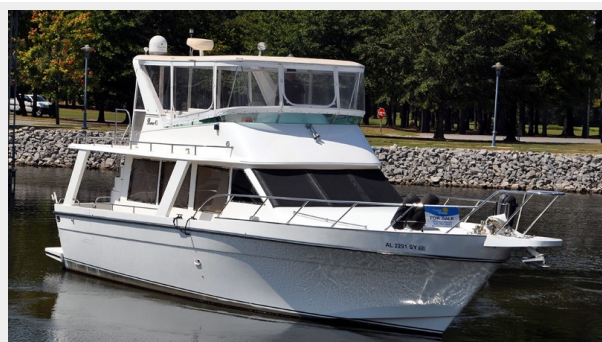
Prima 45 starboard forward profile