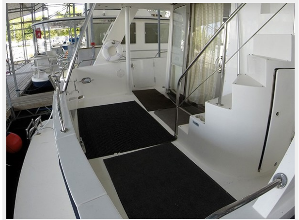
Prima 45 cockpit port