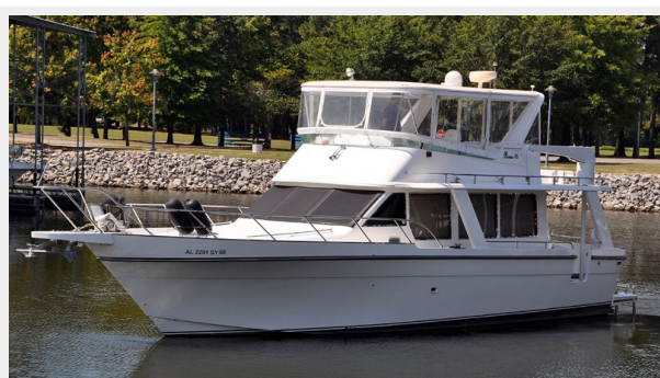
Prima 45 port forward profile