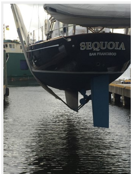
Fresh Bottom Paint, Fall 2016