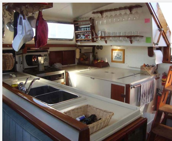
Galley to Aft