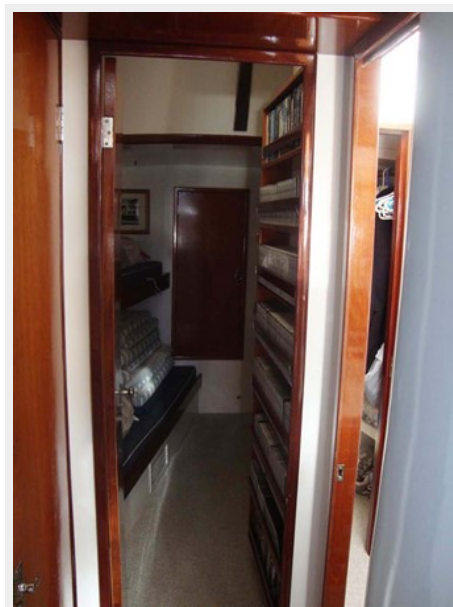
Passageway to Fwd. Guest Cabins