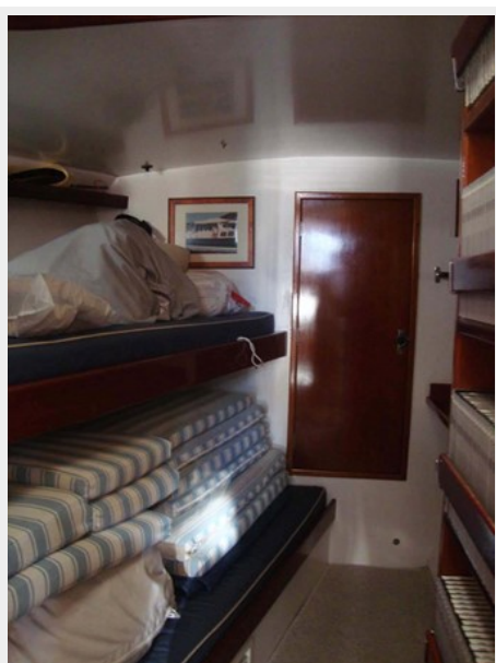
Port Guest Cabin