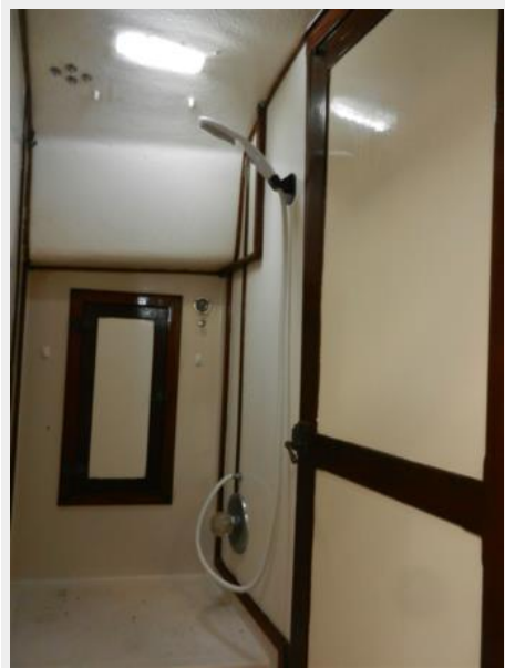
Shower stall with light prism