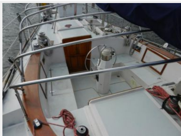
Walk Over cockpit