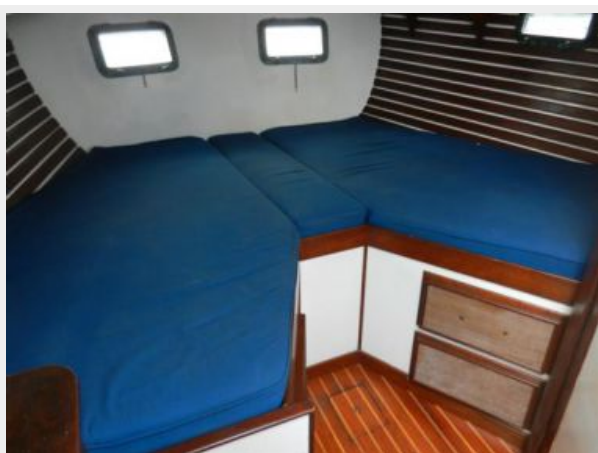
Roomy split berth