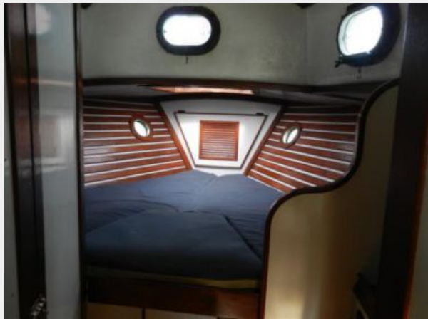
Large berth with filler and overhead hatch