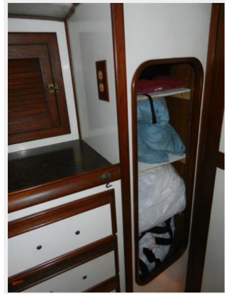
Drawers and locker