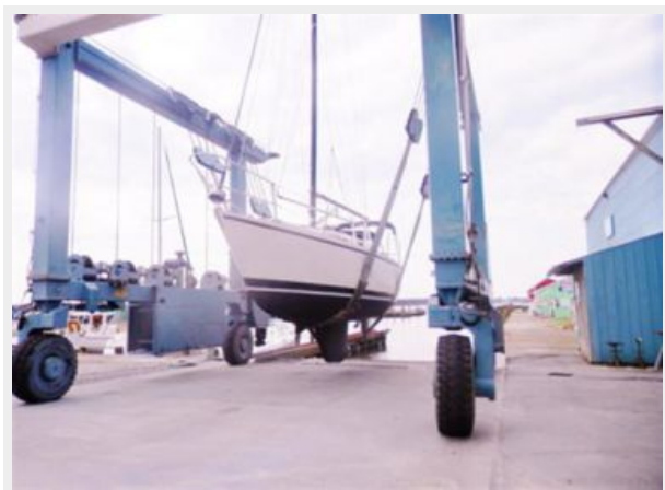
On travel lift with fresh bottom