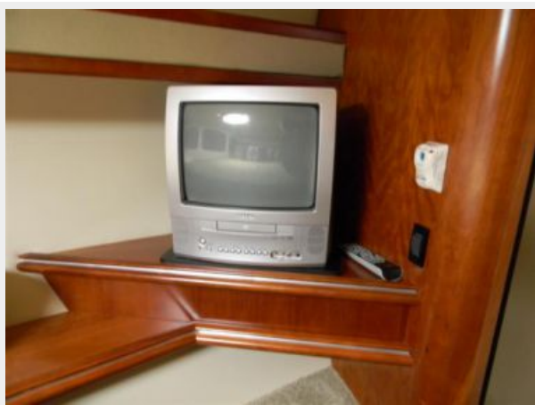
Master Stateroom TV/DVD