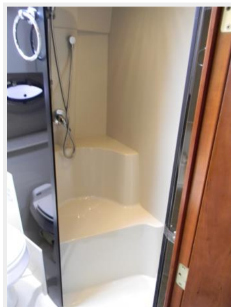
Separate Shower Stall