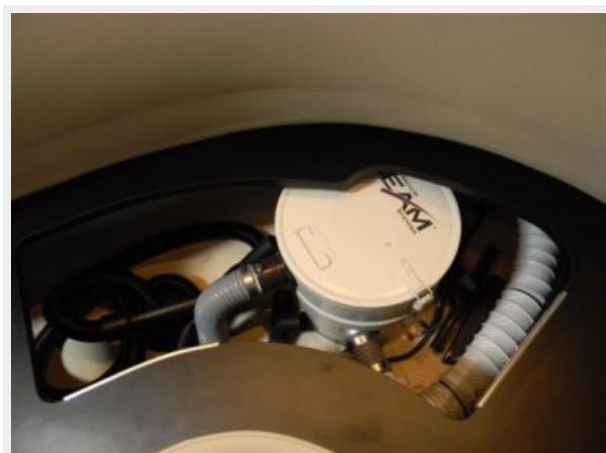
Central Vacuum System