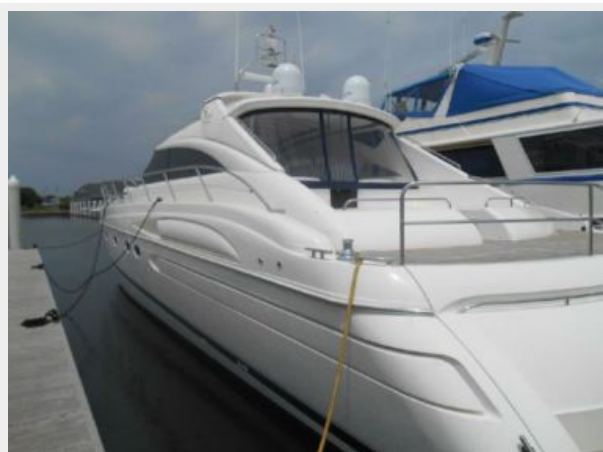
65' Princess Viking - Stern Profile