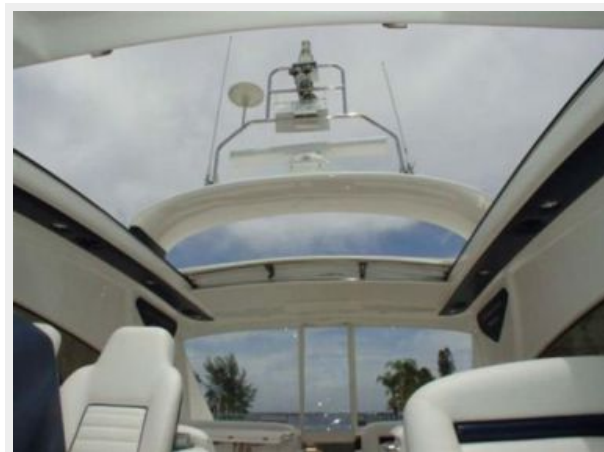
65' Princess Viking - Sky View