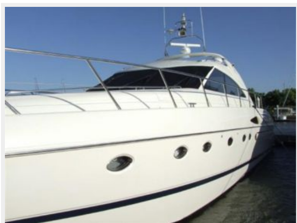
65' Princess Viking - Port Profile