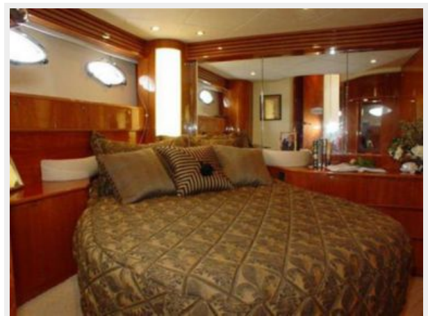
65' Princess Viking - Stateroom