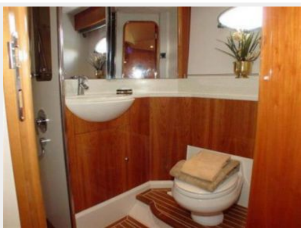
65' Princess Viking - Head