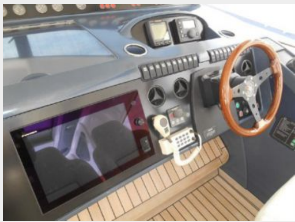
65' Princess Viking - Helm