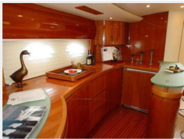
65' Princess Viking - Galley 2