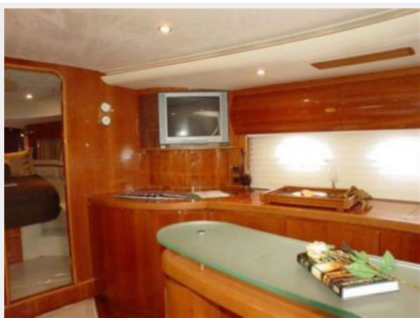
65' Princess Viking - Galley