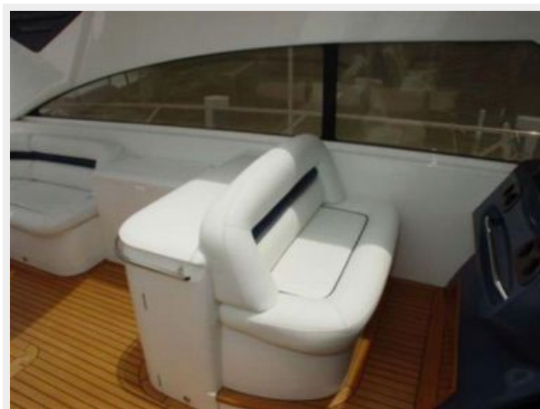
65' Princess Viking - Helm Seating