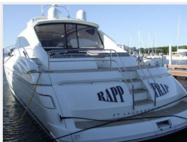
65' Princess Viking - Stern