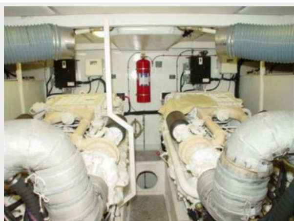
65' Princess Viking - Engine Room