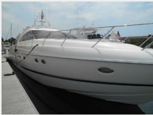
65' Princess Viking - Starboard Profile