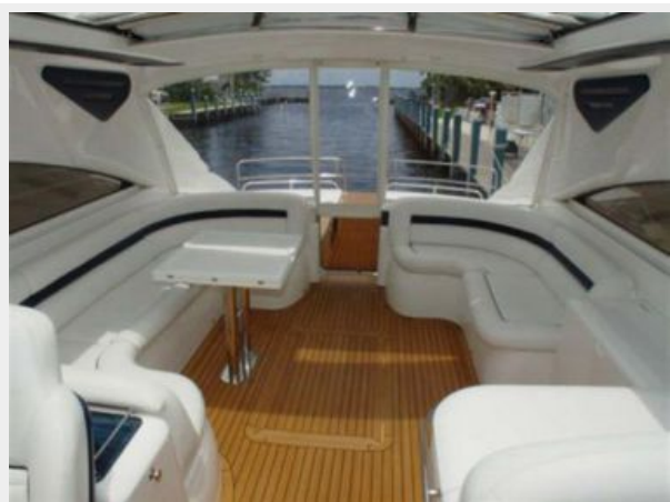
65' Princess Viking - Outdoor Seating