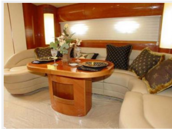
65' Princess Viking - Salon 2