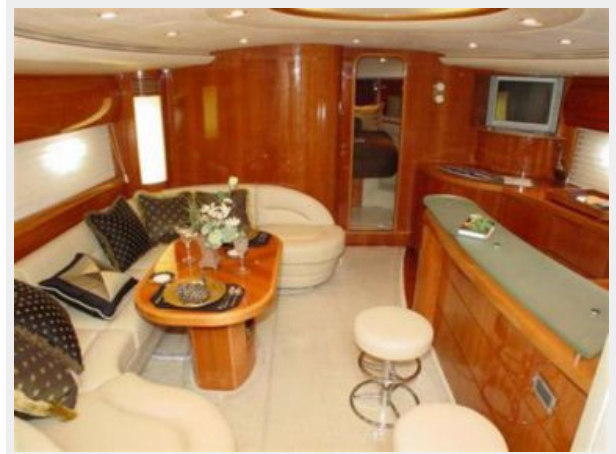
65' Princess Viking - Salon