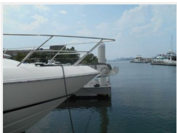
65' Princess Viking - Bow