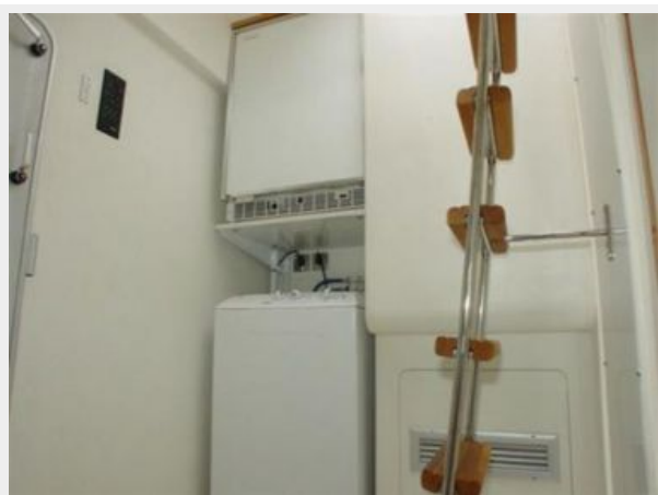
65' Princess Viking - Ladder