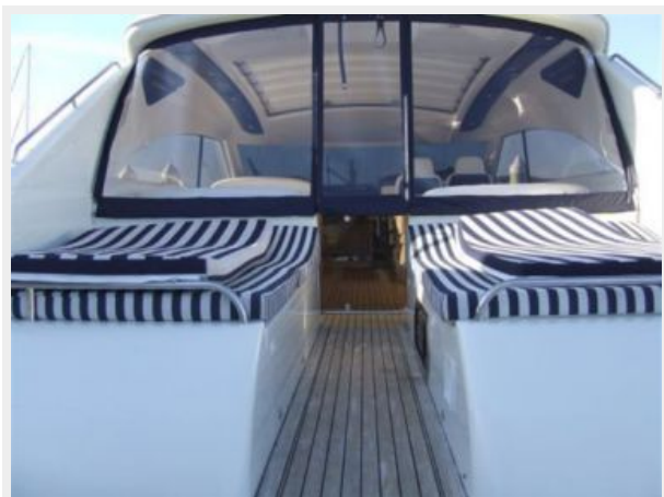
65' Princess Viking - Outdoor Seating