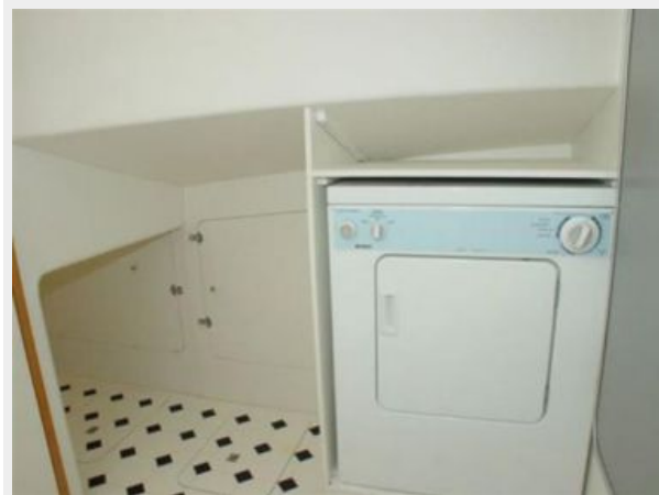
65' Princess Viking - Washer and Dryer