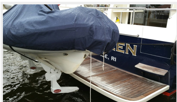
Swim platform & Tender