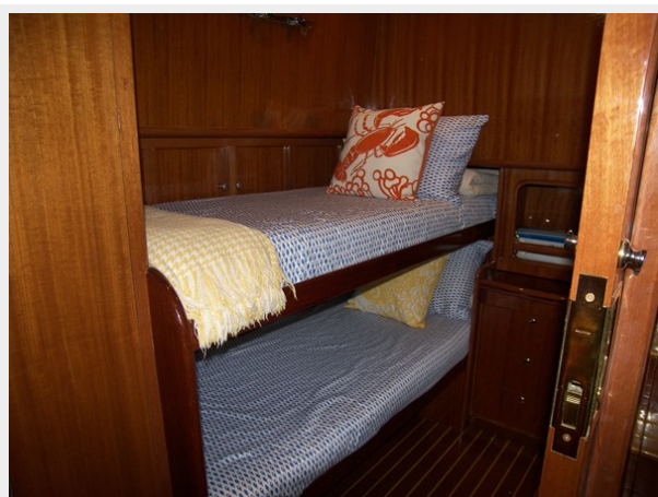
3rd guest stateroom / office