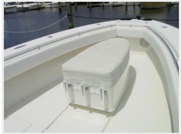
Deck 2 - Coffin Box