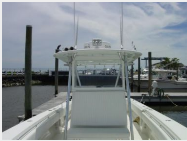
Deck 1 - Hardtop