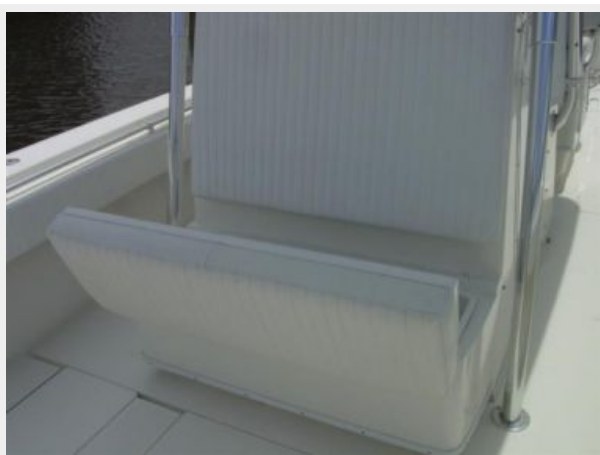
Deck 5 - Deck Storage Box