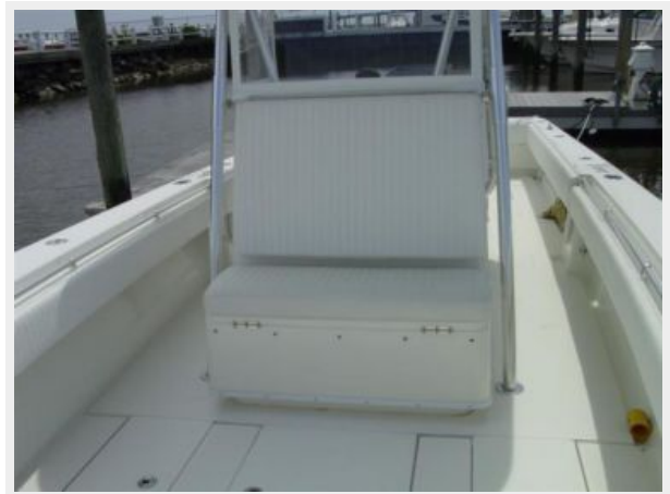
Deck 4 - Deck Seating