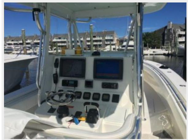
Electronics & Navigation 1