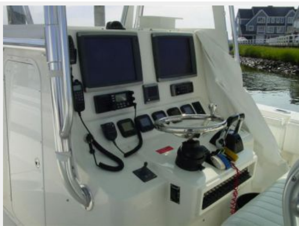
Electronics & Navigation 2