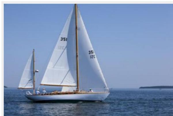
Starboard Tack Beating