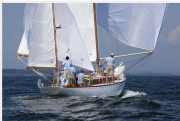
FIDELIO Under Spinnaker