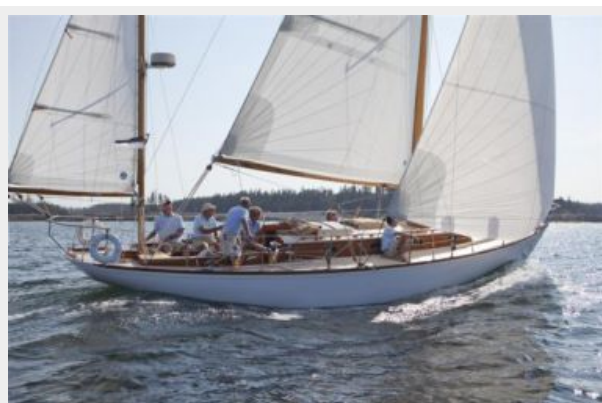
Port Tack Reach