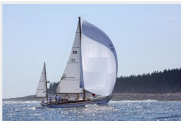
Running Along Maine's Classic Coastline