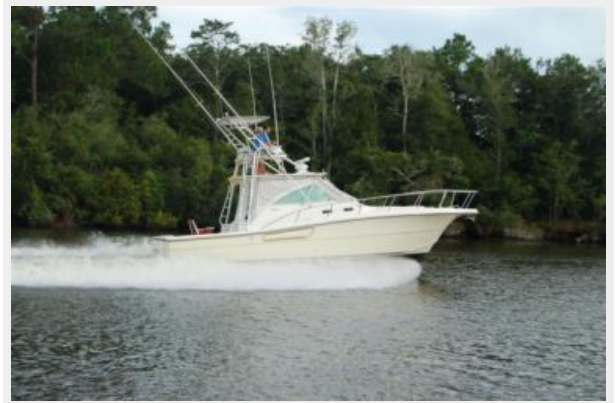
Running shot (2)