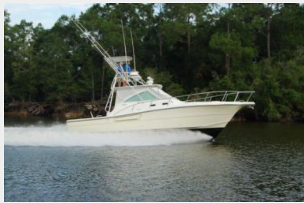
Running shot (1)