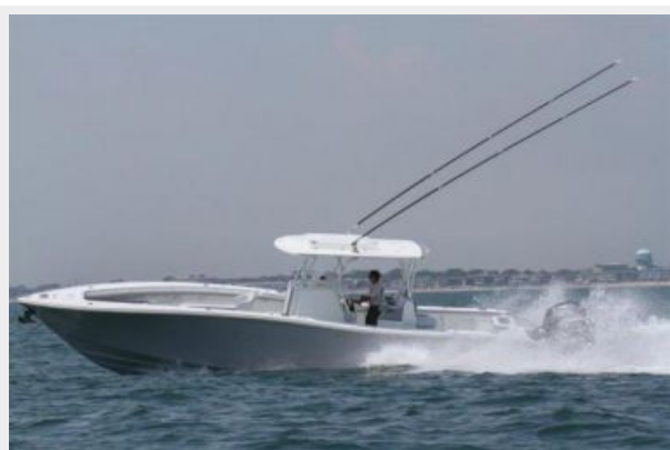
Profile 4 - Running Profile