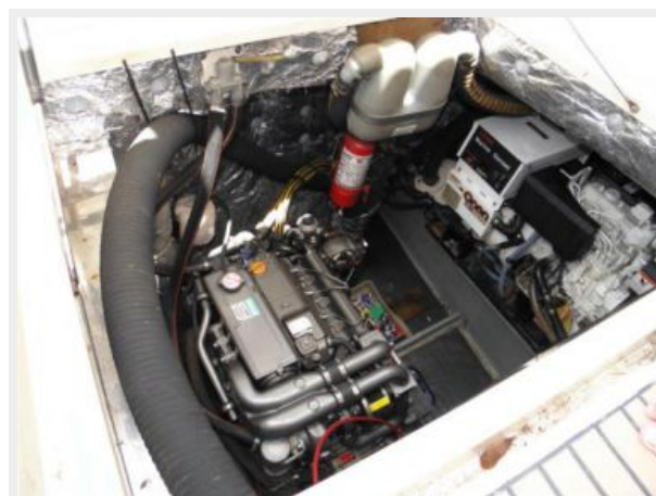
Engine Room #2