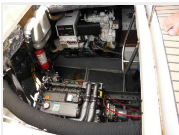
Engine Room #1