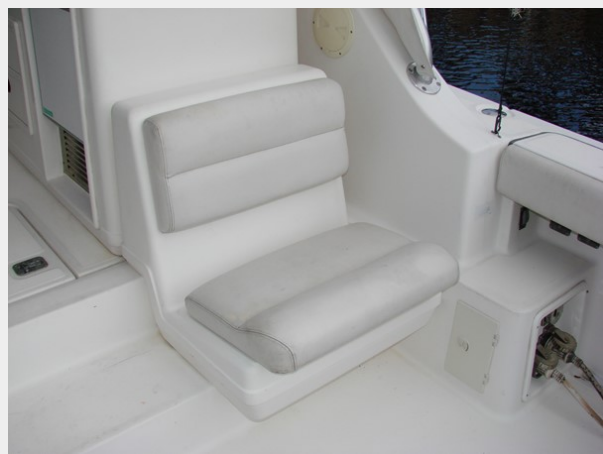
Seating, Ice Maker