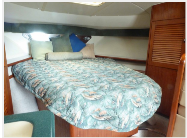
Queen Bed Forward