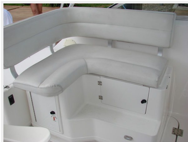
Zippered Rod Storage Port and Starboard