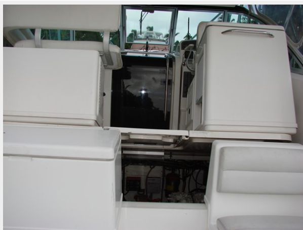
Entire Helm Sole with Seating on Electric Lift Access to Engines