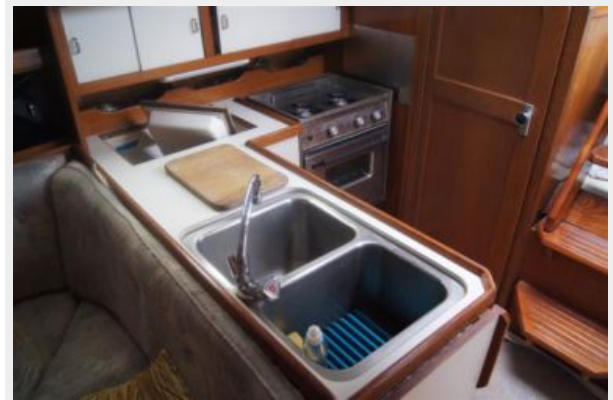
1992 Catalina 34 Ukiyo galley