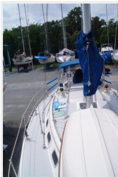
1992 Catalina 34 Ukiyo starboard side looking aft