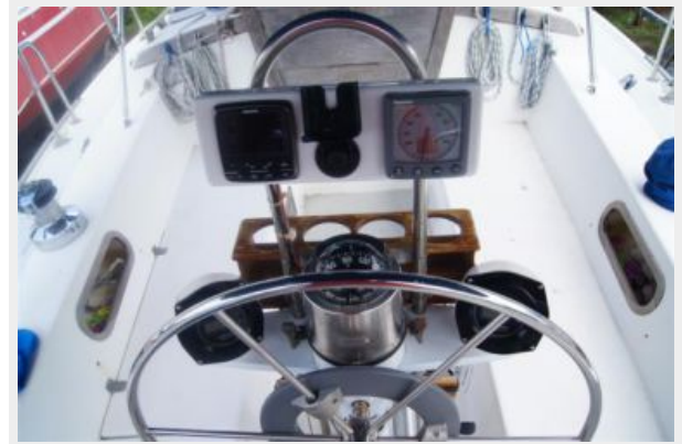
1992 Catalina 34 Ukiyo helm