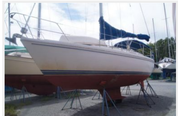
1992 Catalina 34 Ukiyo bowlooking aft