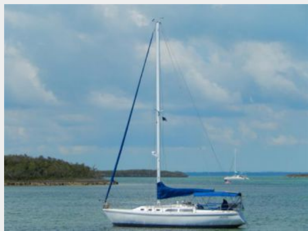
1992 Catalina 34 Ukiyo profile