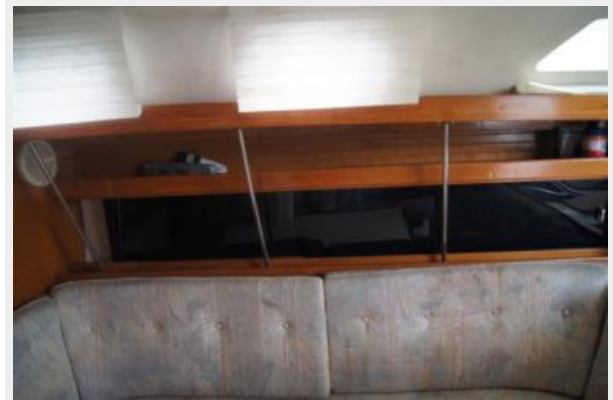
1992 Catalina 34 Ukiyo storage