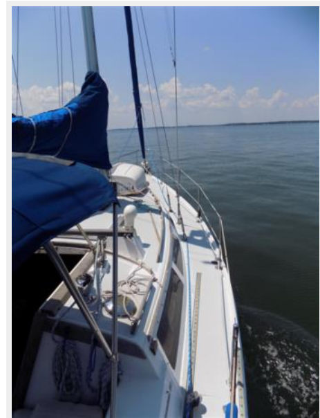
1992 Catalina 34 Ukiyo underway