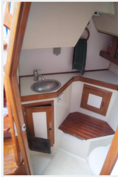
1992 Catalina 34 Ukiyo head 2.