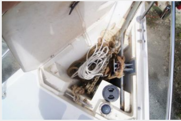
1992 Catalina 34 Ukiyo anchor windlass