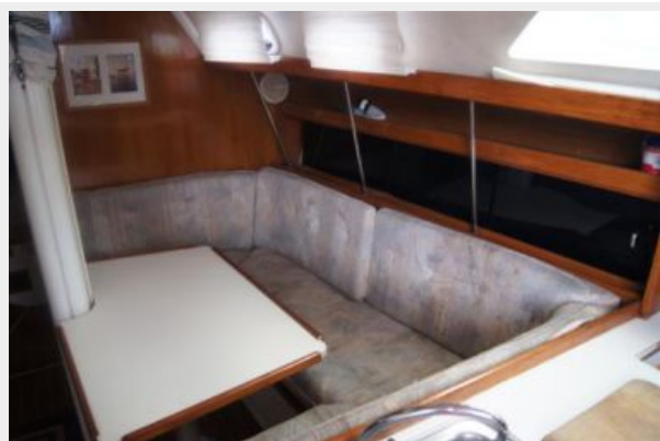
1992 Catalina 34 Ukiyo setee