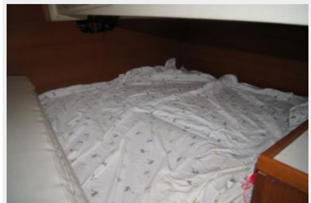
1992 Catalina 34 Ukiyo aft berth