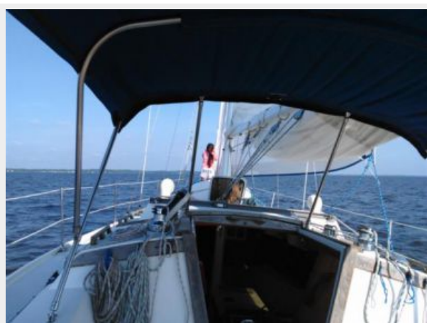
1992 Catalina 34 Ukiyo underway2