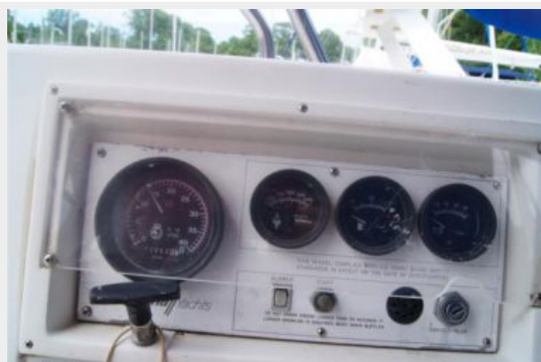
1992 Catalina 34 Ukiyo engine panel