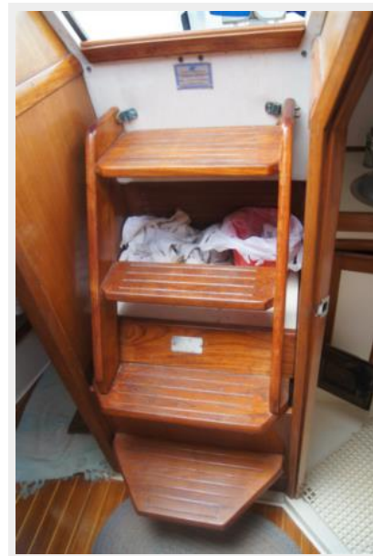
1992 Catalina 34 Ukiyo companionway steps