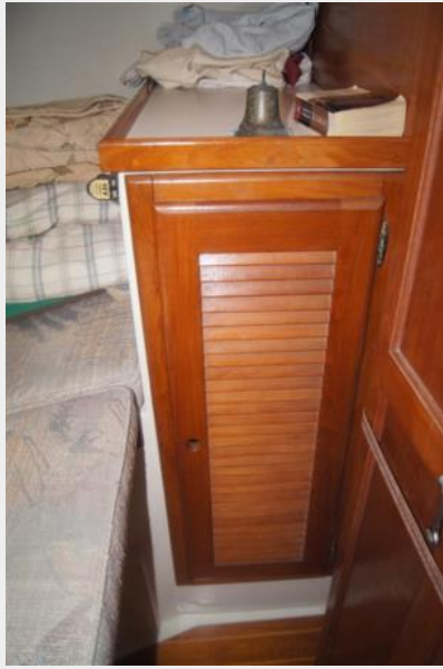
1992 Catalina 34 Ukiyo hanging locker