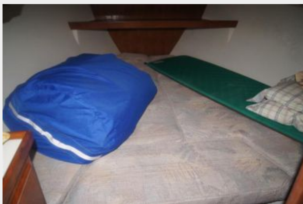
1992 Catalina 34 Ukiyo forward berth