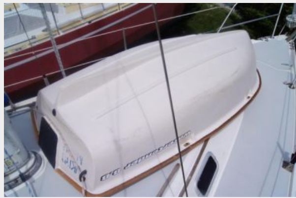
1992 Catalina 34 Ukiyo dingy