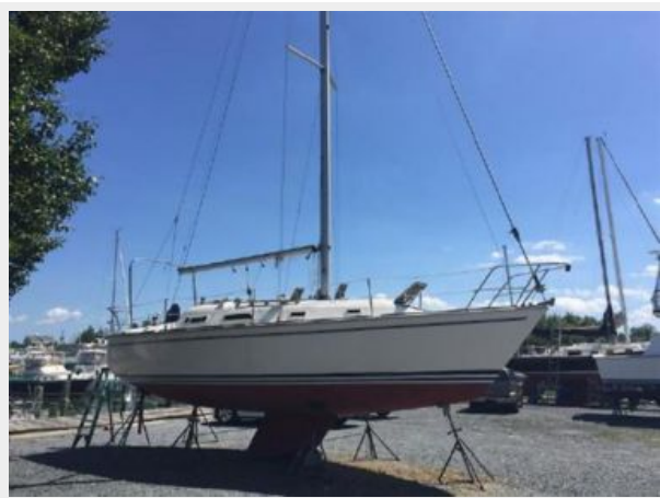
Reve starboard 3