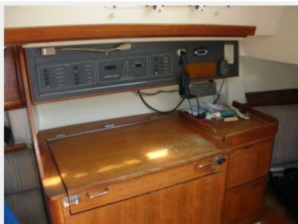
Reve chart station 2