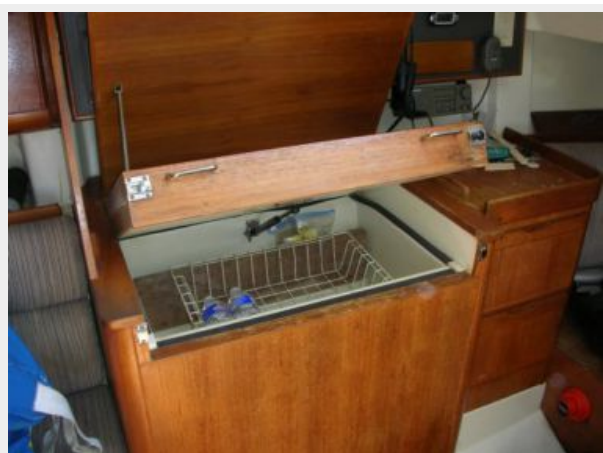
Reve chart station