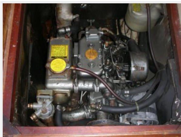
Reve engine 2