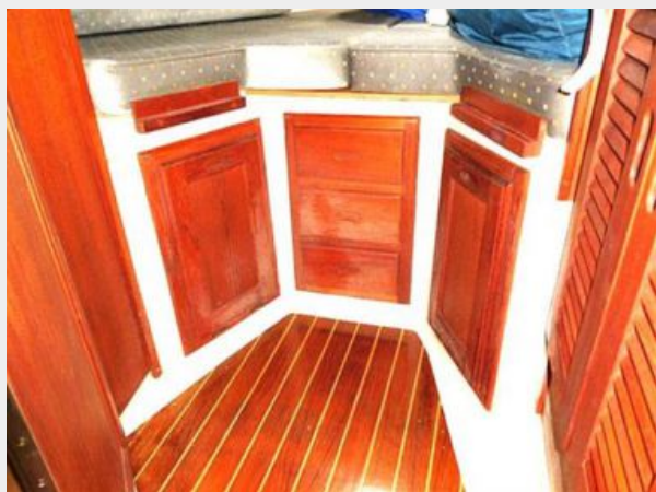
36' Catalina forward stateroom storage