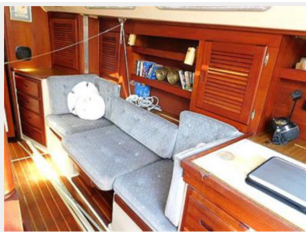
36' Catalina convertible settee and single berth