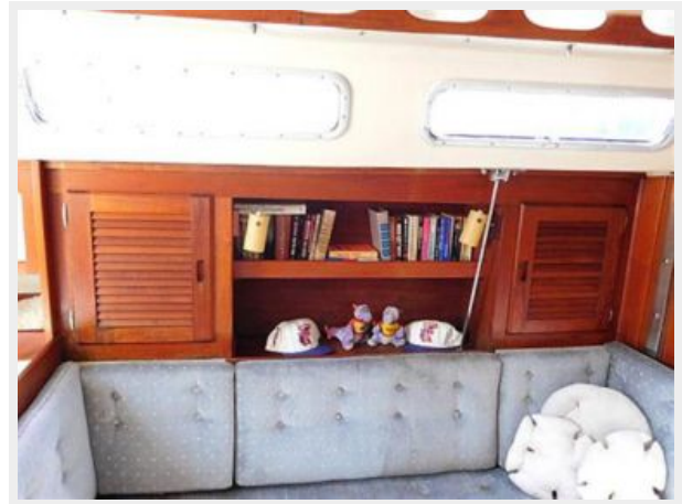
36' Catalina settee and storage