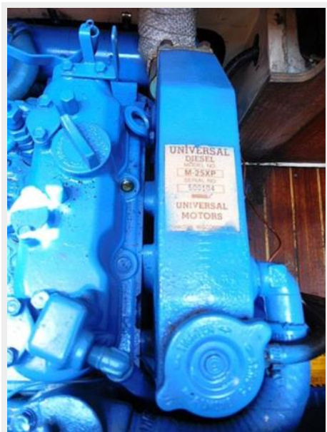
36&apos Catalina engine top view