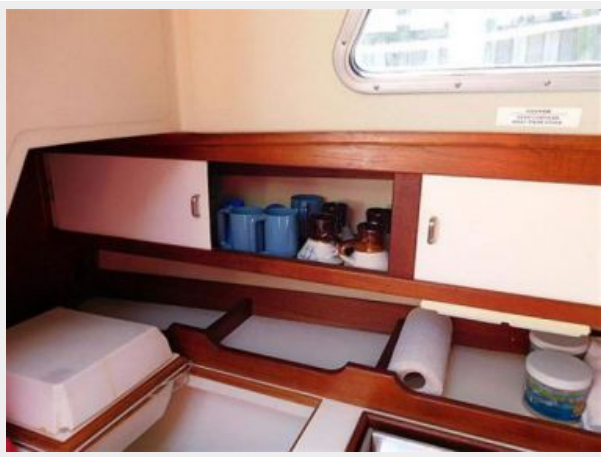
36' Catalina galley storage