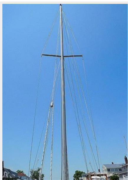
36' Catalina mast