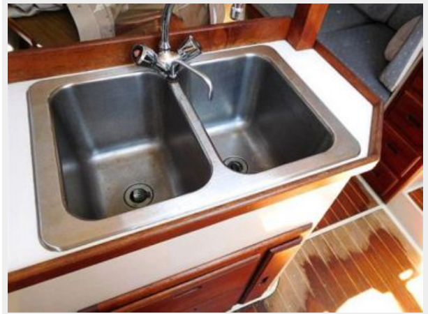
36' Catalina double stainless steel sink