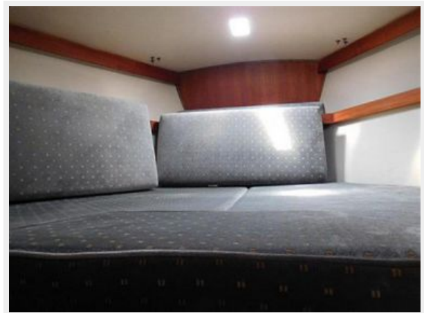
36' Catalina forward stateroom v-berth with insert