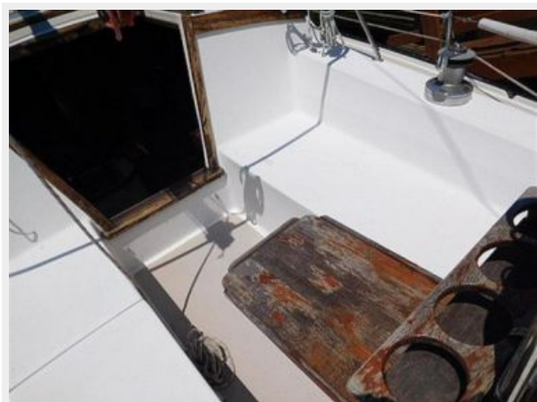
36' Catalina cockpit table