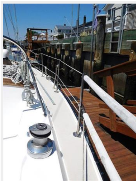
36' Catalina starboard deck