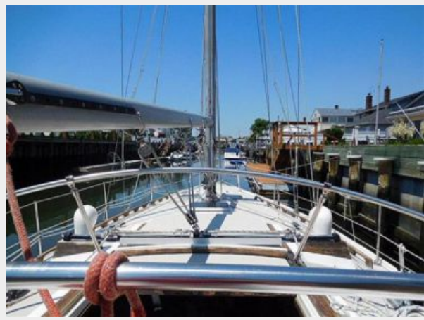
36' Catalina toward bow