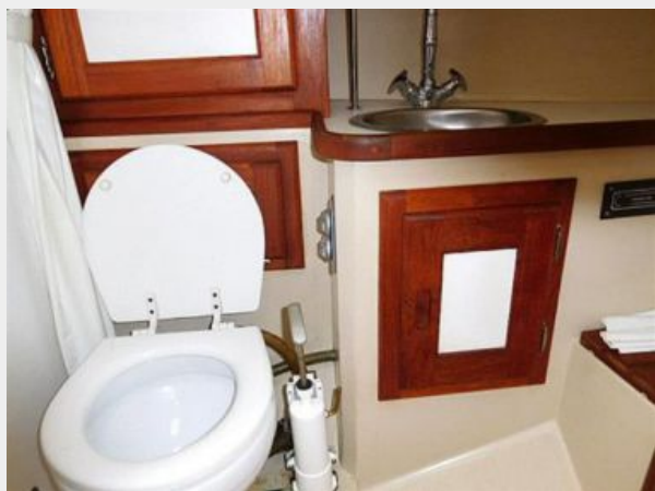
36' Catalina head