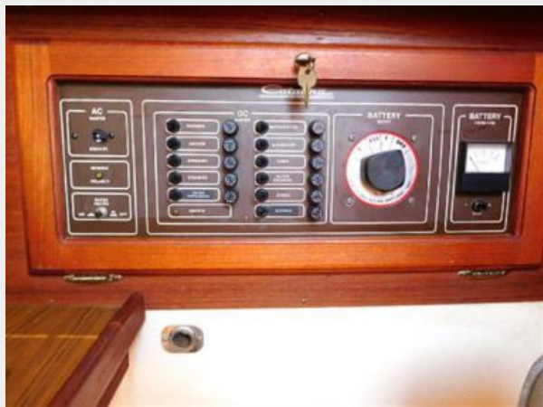
36' Catalina breaker panel