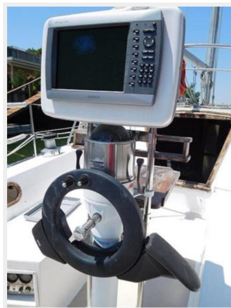
36' Catalina helm and Garmin