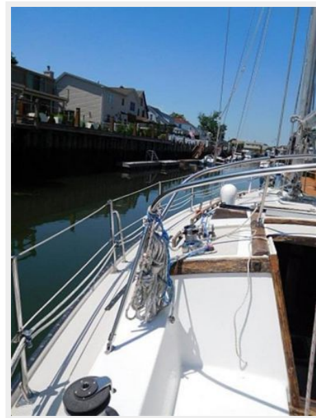
36' Catalina port deck