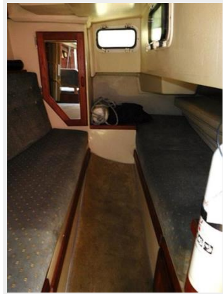
36' Catalina aft stateroom