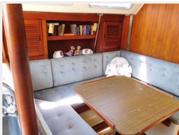
36' Catalina convertible dining table and settee