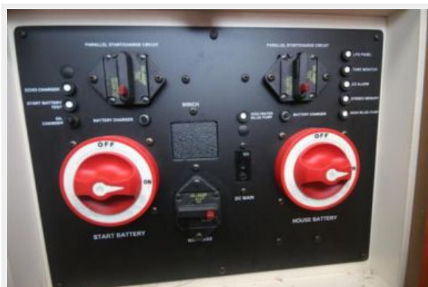
Battery Switch control panel