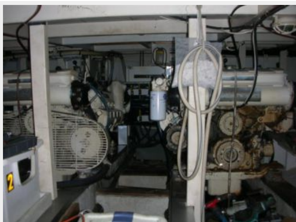
My Girls engine room 2.