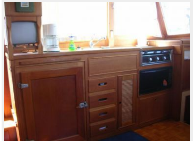
My Girls galley