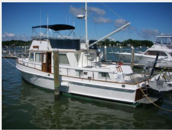
My Girls Profile 2.