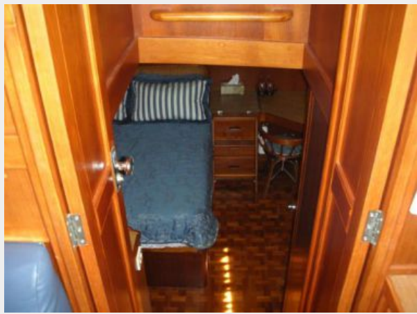
My Girls master3