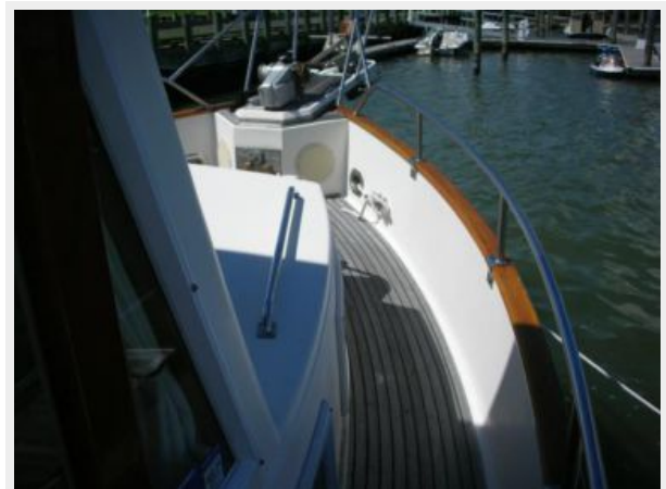
My Girls starboard foredeck