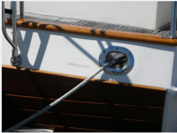
My Girls stern