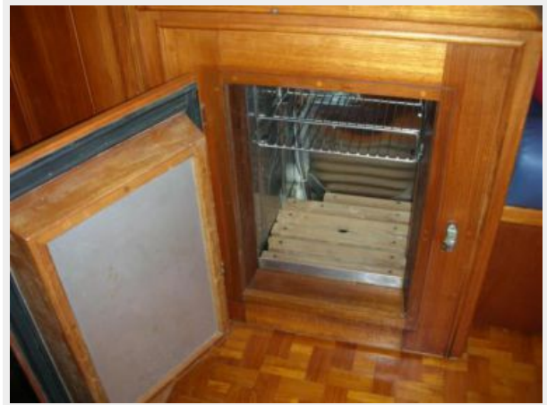
My Girls refridgeration