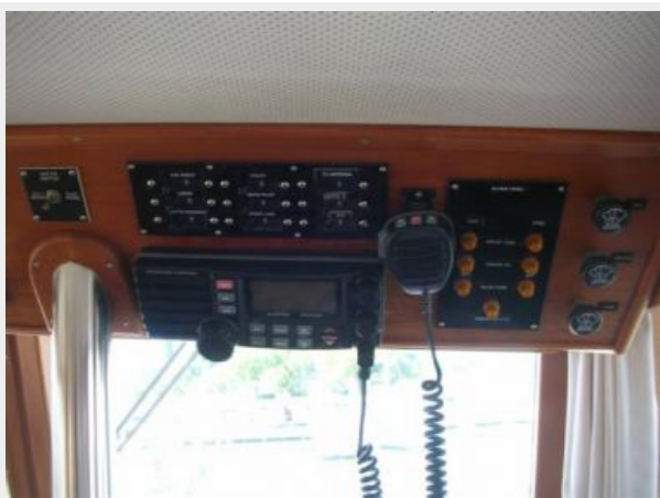
My Girls lower helm controls