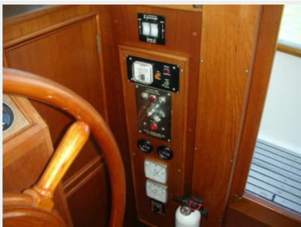
My Girls lower helm 2.