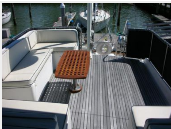
My Girls bridge aft