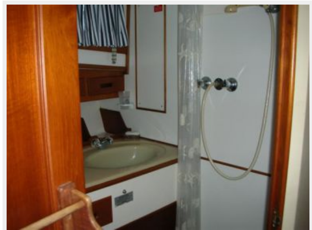
My Girls master shower