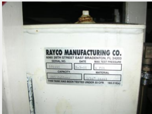
My Girls engine room 4.