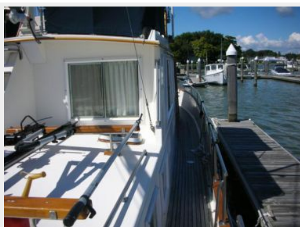
My Girls starboard side deck