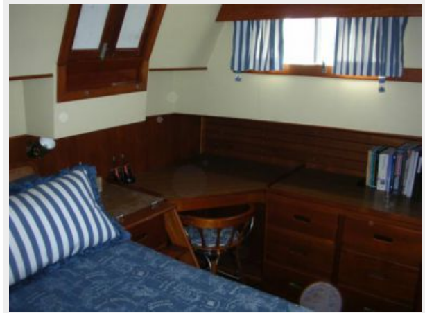
My Girls master 2.