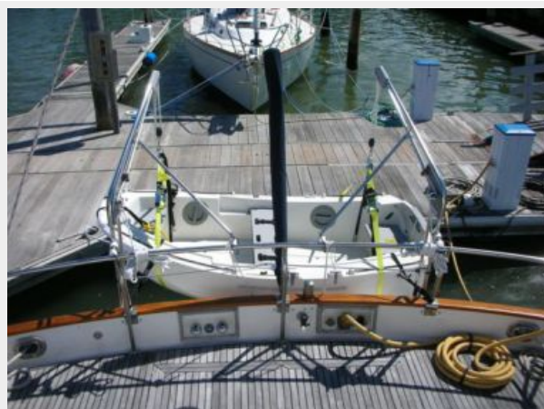
My Girls tender