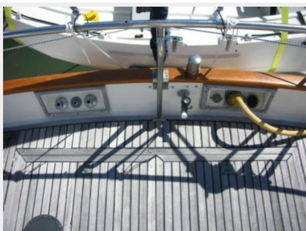
My Girls stern hookups