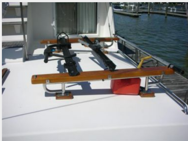
My Girls tender chocks