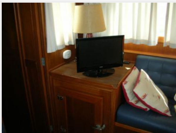
My Girls salon 3