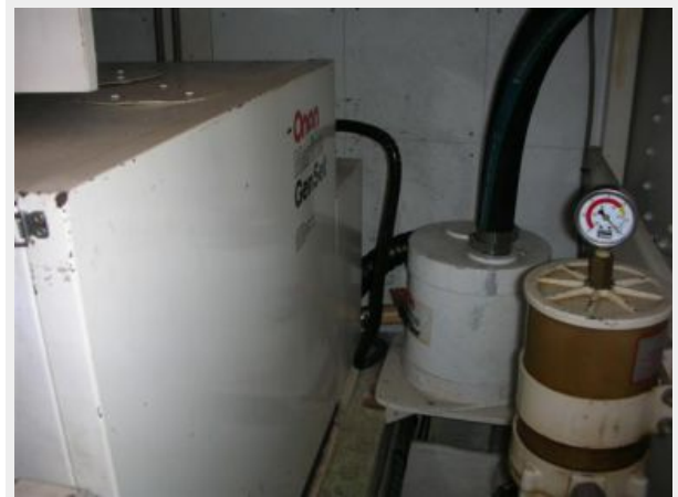
My Girls generator