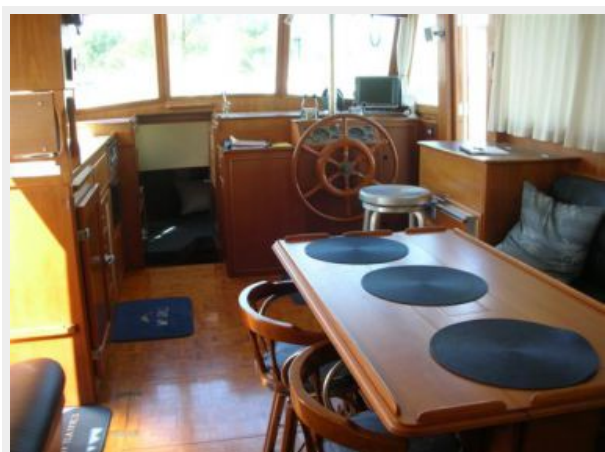
My Girls Salon