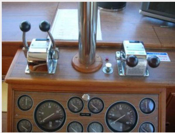
My Girls lower helm