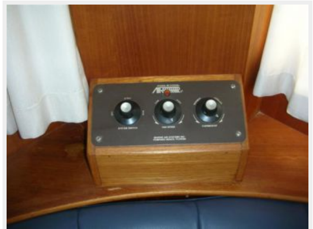
My Girls AC