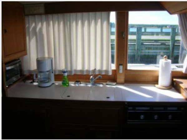
My Girls galley 2