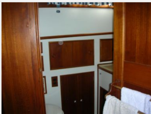
My Girls master head