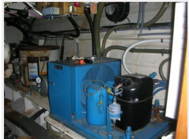
My Girls engine room 1.