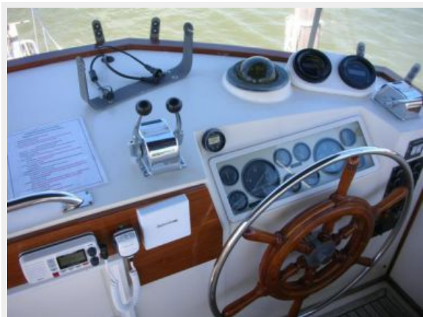
My Girls upper helm