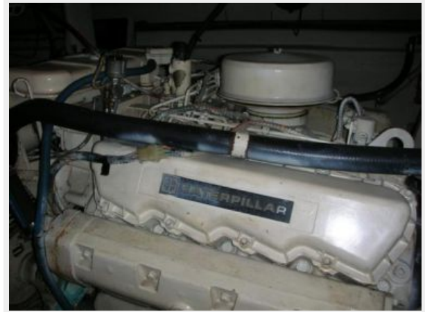
My girls engine room 3.