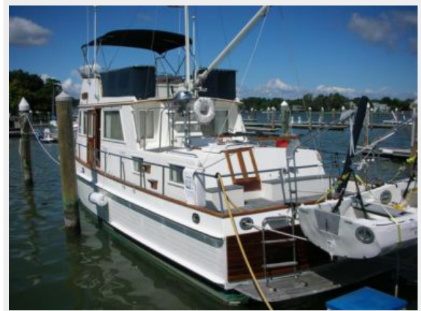
My Girls Port stern