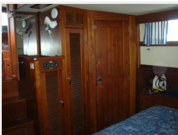
My Girls master