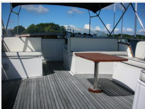
My Girls bridge forward