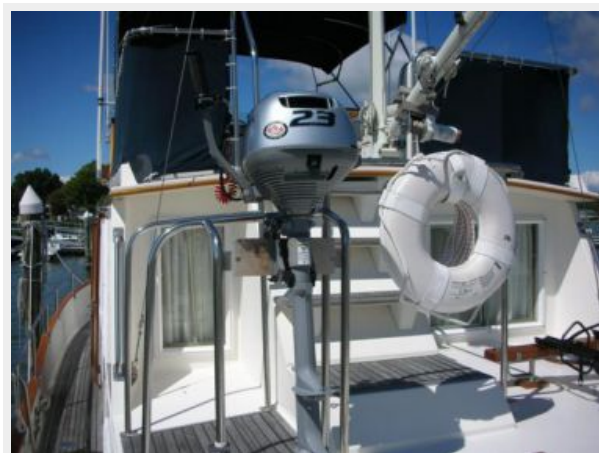
My Girls outboard