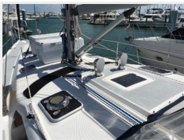
46 Hunter 2004