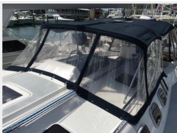
46 Hunter 2004