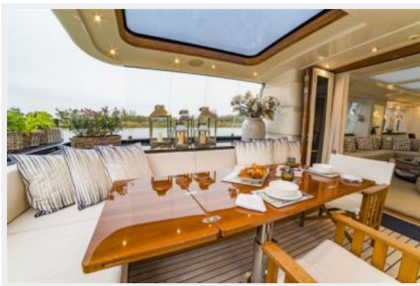
Outdoor Dining Area