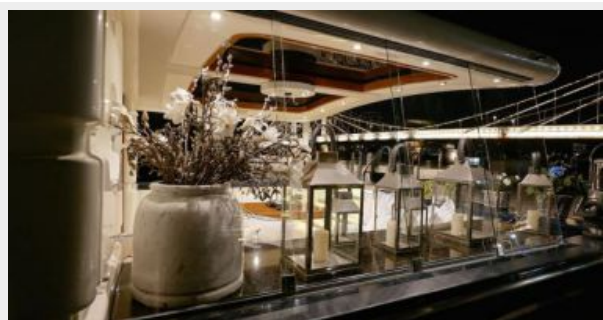
Aft Deck at Night