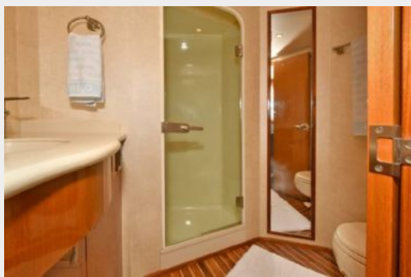
Master Head with Stall Shower