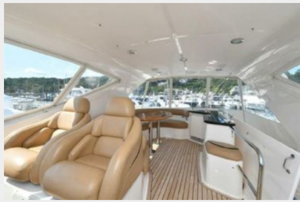
Aft Flybridge View