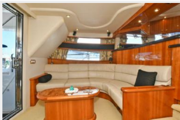
Salon Port Side