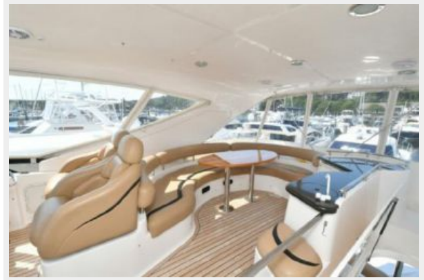
Flybridge Dinette with U-Shaped Seating