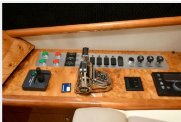
Lower Helm Station