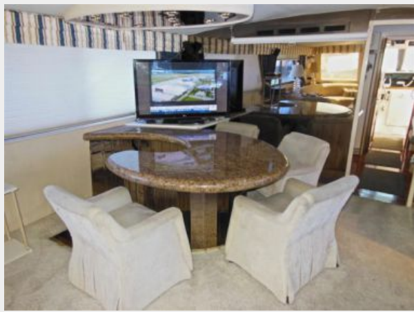
63' Hatteras 1988-Image28