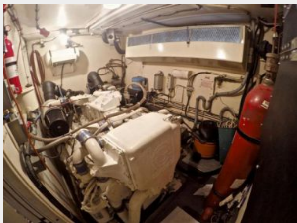
63' Hatteras 1988-Image48