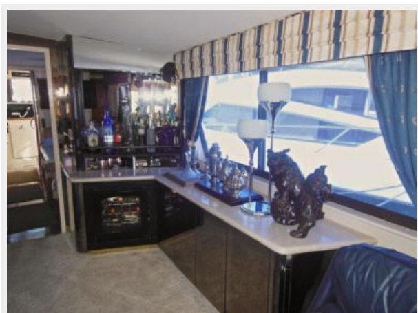
63' Hatteras 1988-Image14