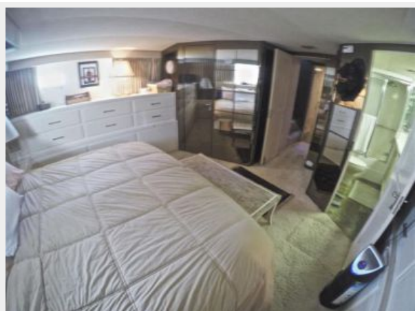
63' Hatteras 1988-Image40