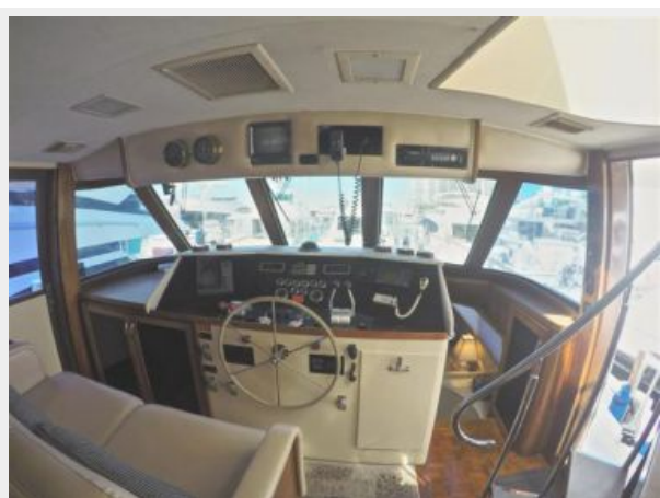
63' Hatteras 1988-Image10