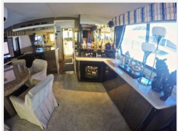
63' Hatteras 1988-Image31