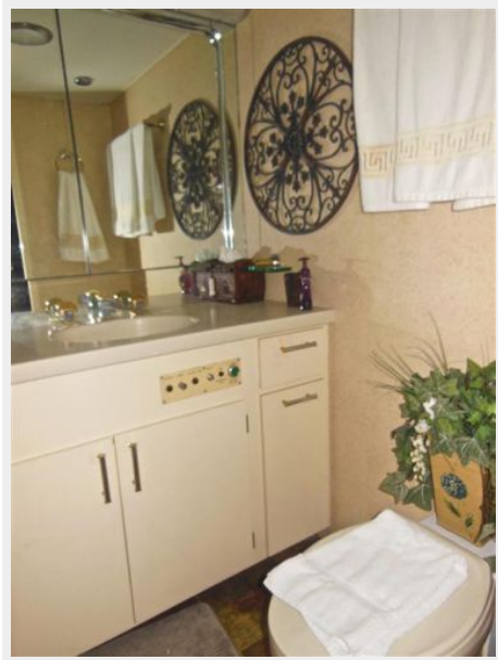
63' Hatteras 1988-Image22