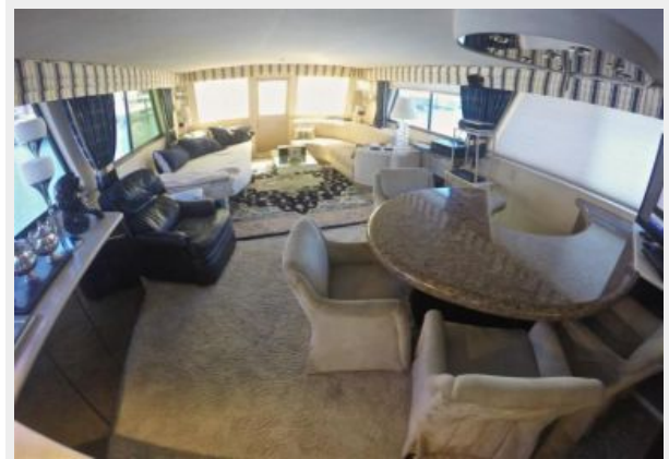
63' Hatteras 1988-Image29