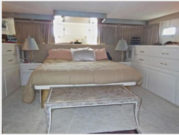
63' Hatteras 1988-Image18