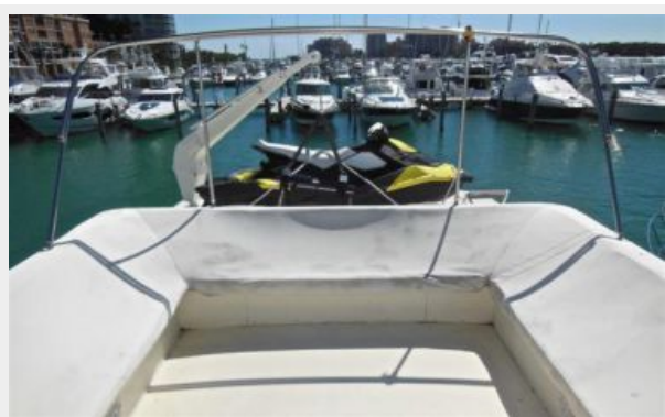
63' Hatteras 1988-Image8