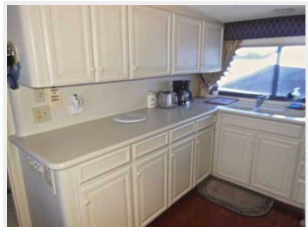
63' Hatteras 1988-Image25