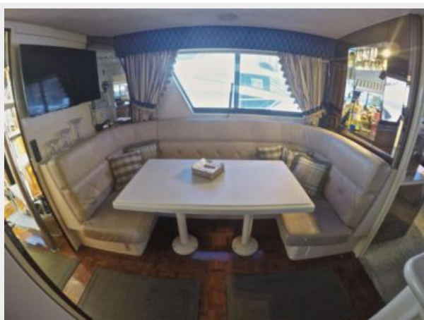
63' Hatteras 1988-Image32