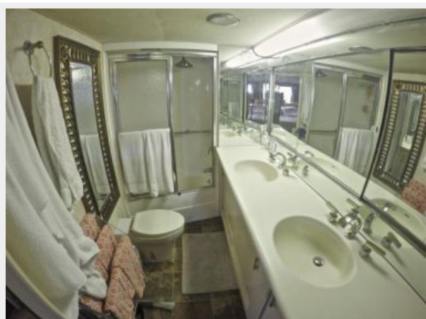
63' Hatteras 1988-Image38