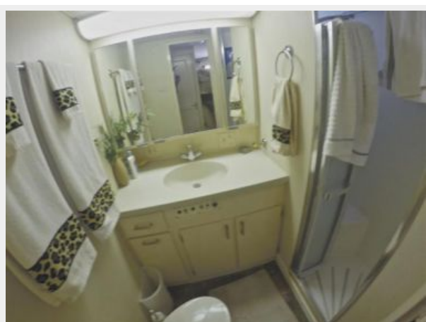
63' Hatteras 1988-Image44