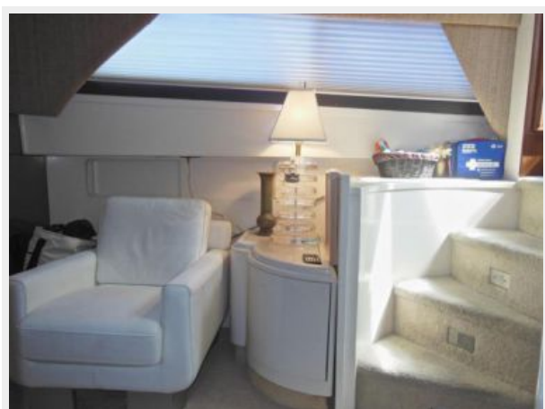
63' Hatteras 1988-Image16