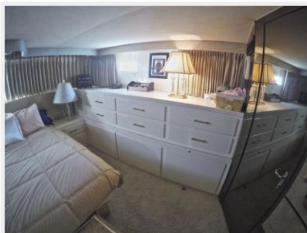
63' Hatteras 1988-Image41