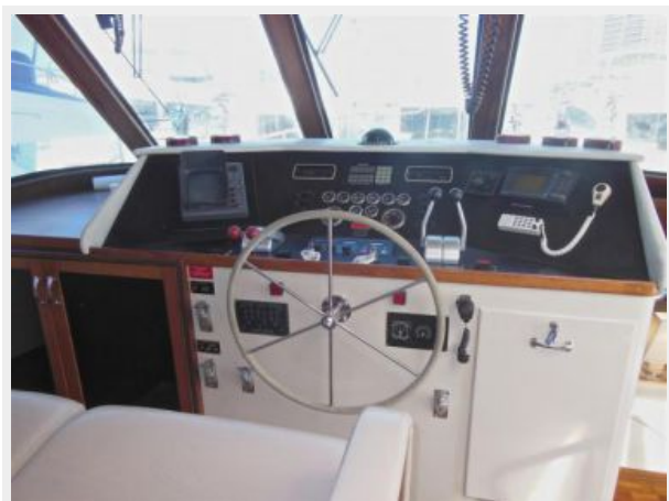
63' Hatteras 1988-Image12