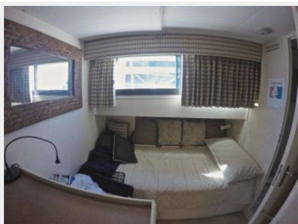
63' Hatteras 1988-Image36