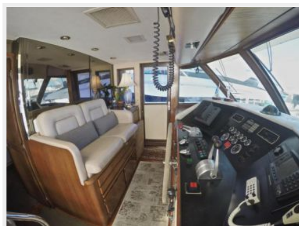
63' Hatteras 1988-Image9