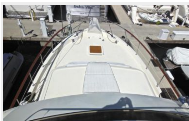
63' Hatteras 1988-Image4