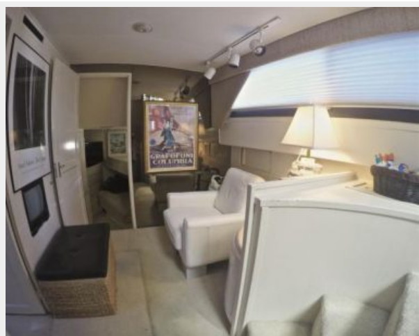
63' Hatteras 1988-Image34