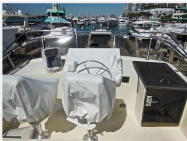
63' Hatteras 1988-Image6