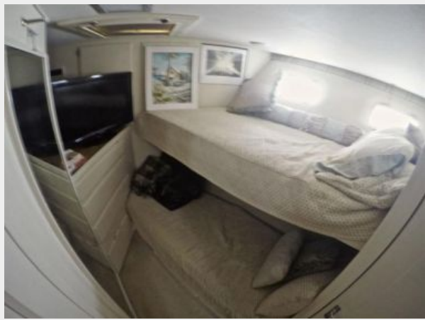
63' Hatteras 1988-Image46