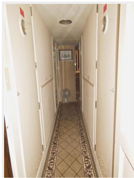
63' Hatteras 1988-Image35