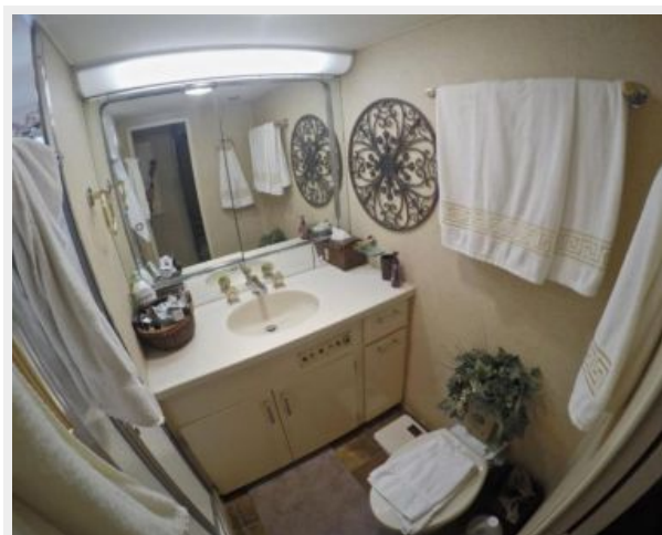
63' Hatteras 1988-Image37