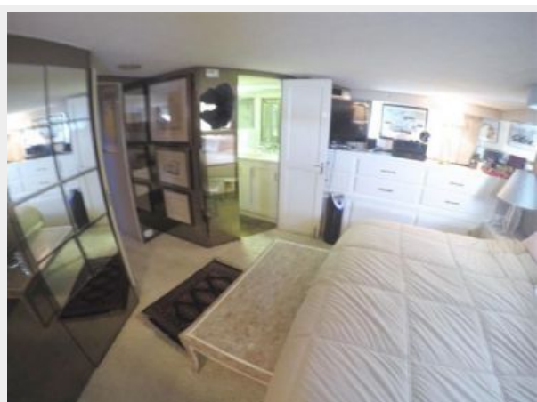
63' Hatteras 1988-Image42