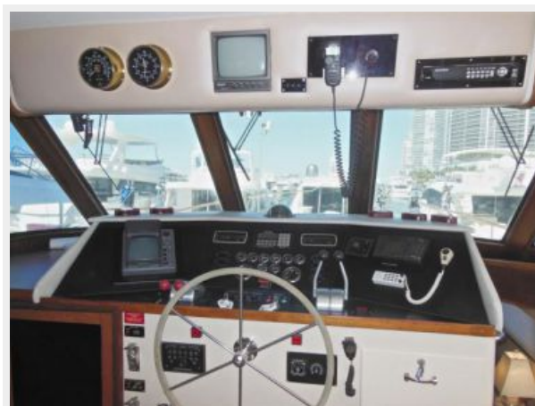
63' Hatteras 1988-Image13