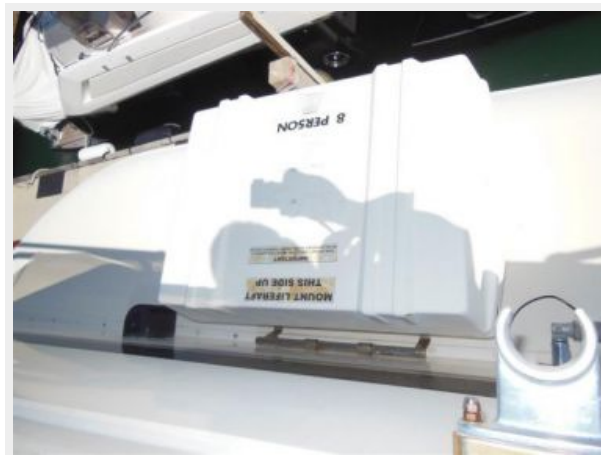
63' Hatteras 1988-Image7