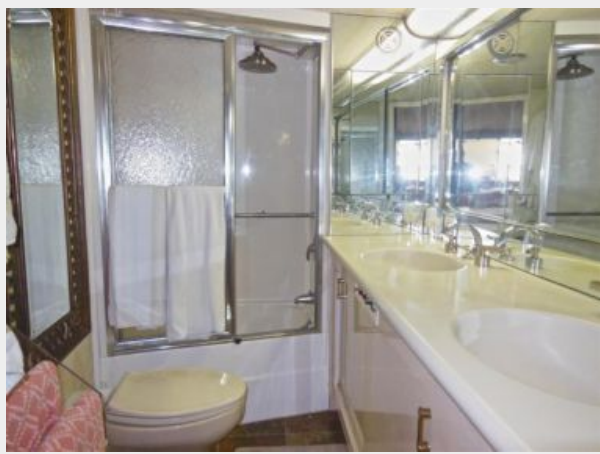
63' Hatteras 1988-Image20