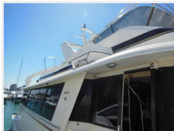
63' Hatteras 1988-Image3