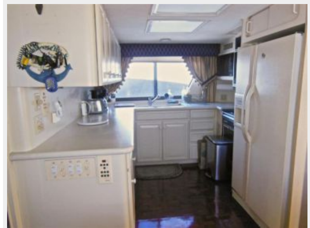
63' Hatteras 1988-Image23