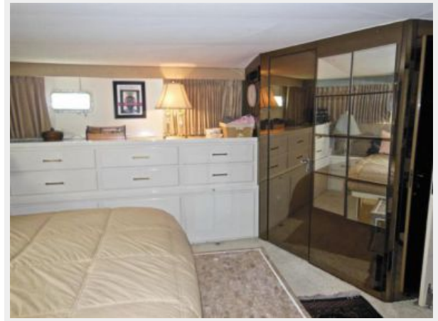
63' Hatteras 1988-Image19