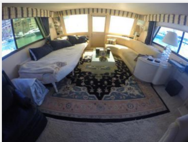
63' Hatteras 1988-Image30