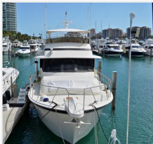
63' Hatteras 1988-Image2