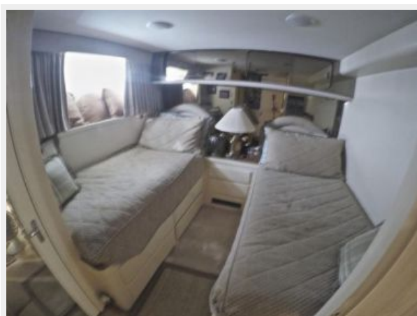
63' Hatteras 1988-Image43