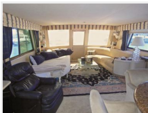
63' Hatteras 1988-Image15