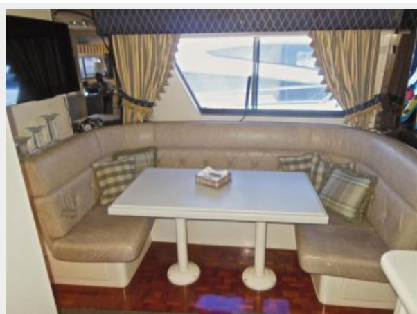
63' Hatteras 1988-Image26