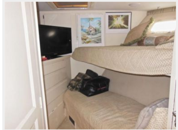
63' Hatteras 1988-Image47