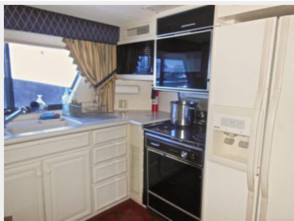
63' Hatteras 1988-Image24