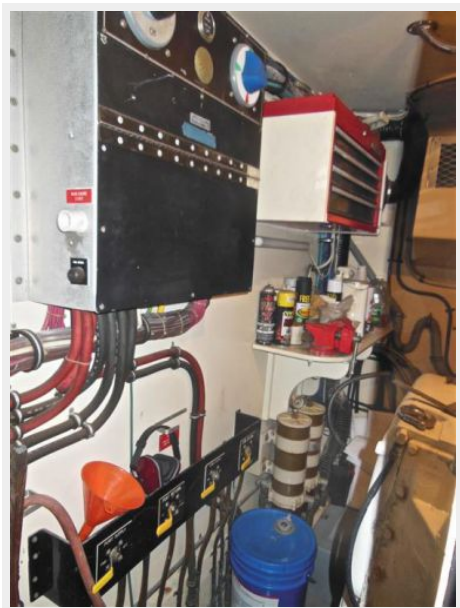
63' Hatteras 1988-Image52