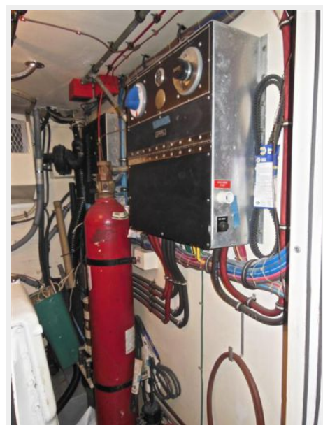
63' Hatteras 1988-Image51