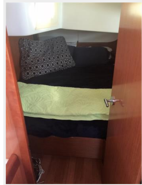
Port Aft Cabin