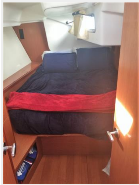
Starboard Aft Cabin