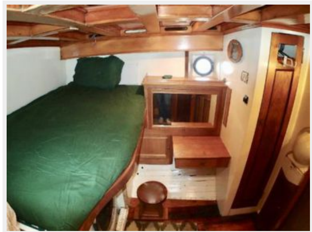
Forward Port Cabin