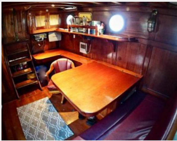
Main Cabin/Navigation Center