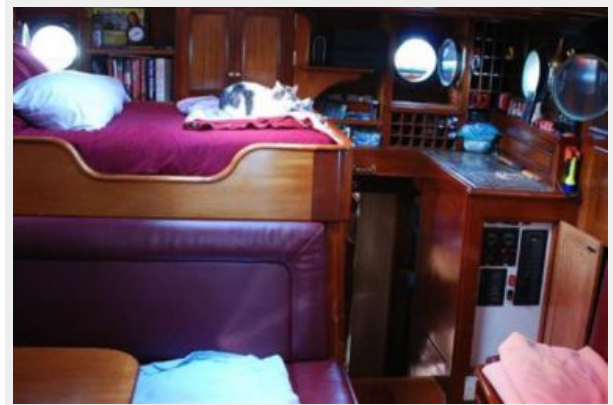
Main Cabin Forward