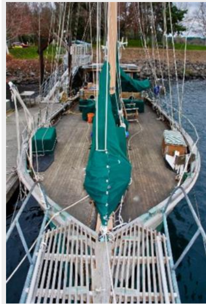
New Fuel Tanks