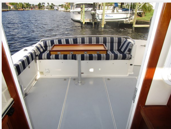
Salon view aft