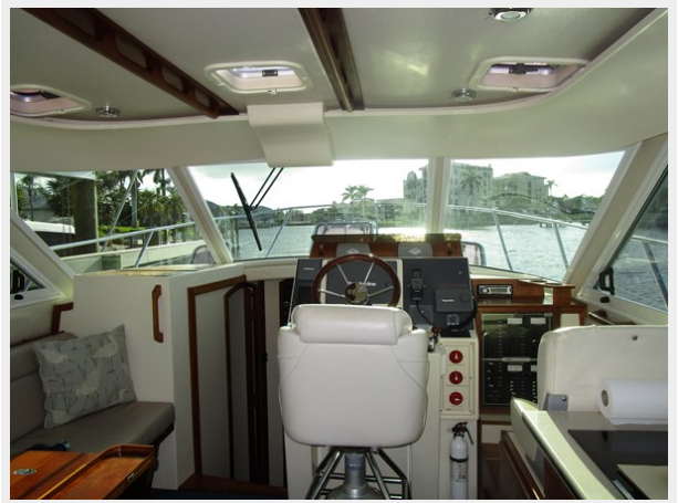
Moveable helm chair