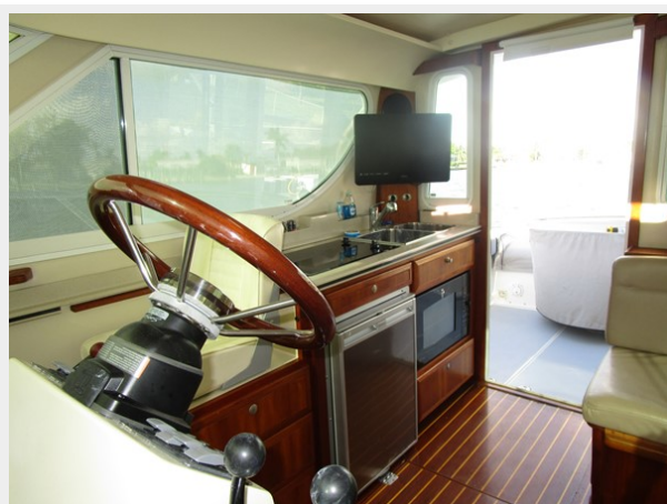
Helm view aft