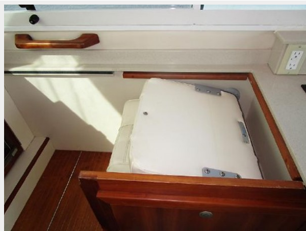
Crew seat conversion to tabletop