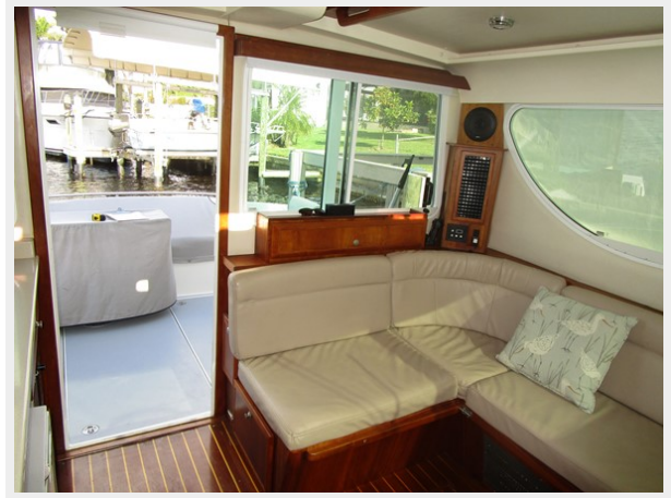
L shaped settee to port