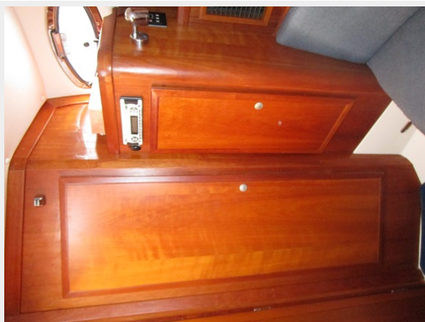
Master stateroom hanging lockers & stereo