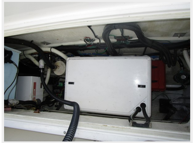
Topview 5 KW Generator