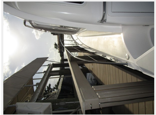
Forward deck view to port