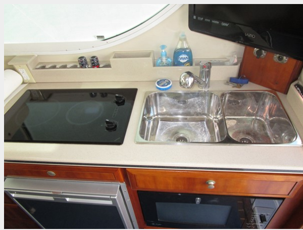
Galley up to starboard