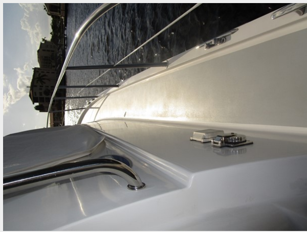
Starboard deck view forward