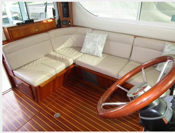
L shaped settee to port 2.