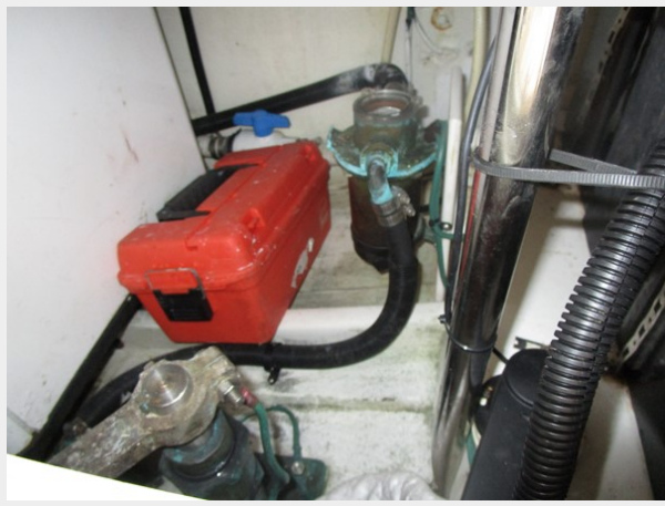
Aft steerage and generator