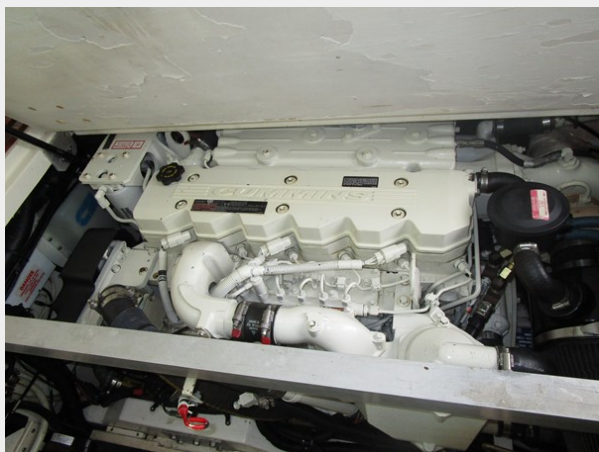
Starboard cummings diesel