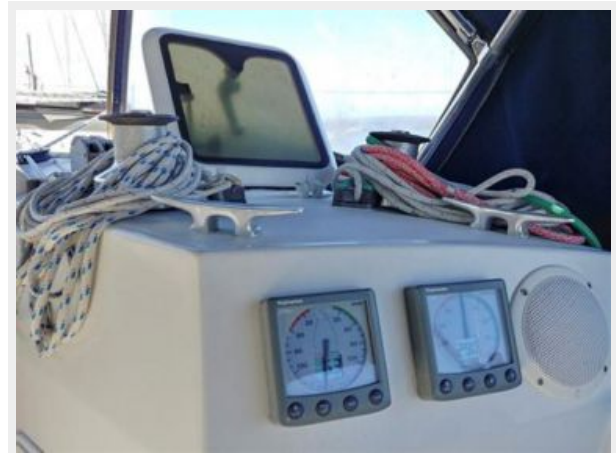
012 1989 Sabre Mark II Centerboard Starboard Cockpit Forward