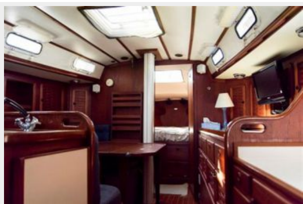
013 1989 Sabre Mark II Centerboard Main Salon