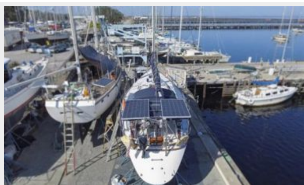
003 1989 Sabre Mark II Centerboard Above