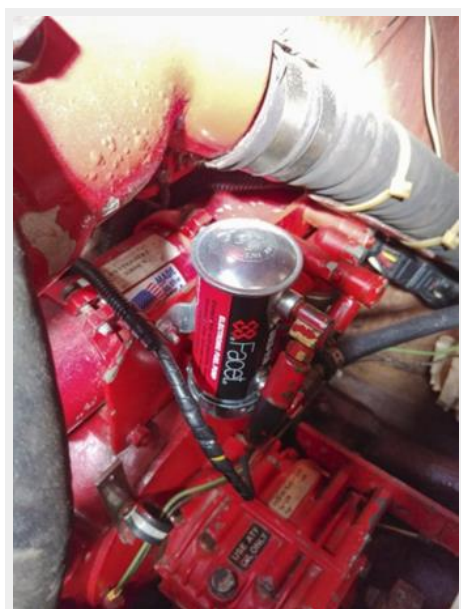
029 1989 Sabre Mark II Centerboard Engine Aft