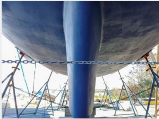
007 1989 Sabre Mark II Centerboard Keel Centerline