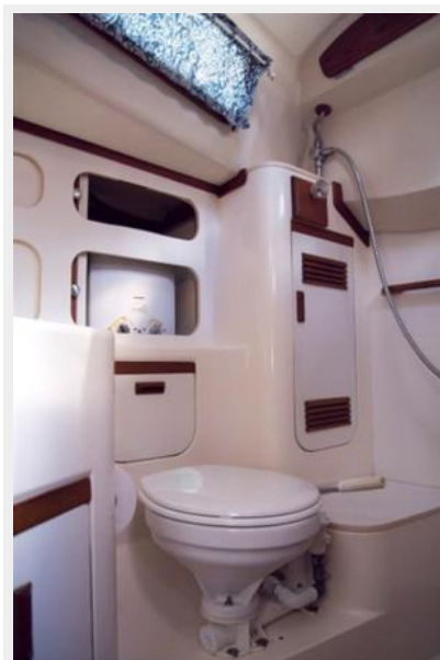
020 1989 Sabre Mark II Centerboard Head