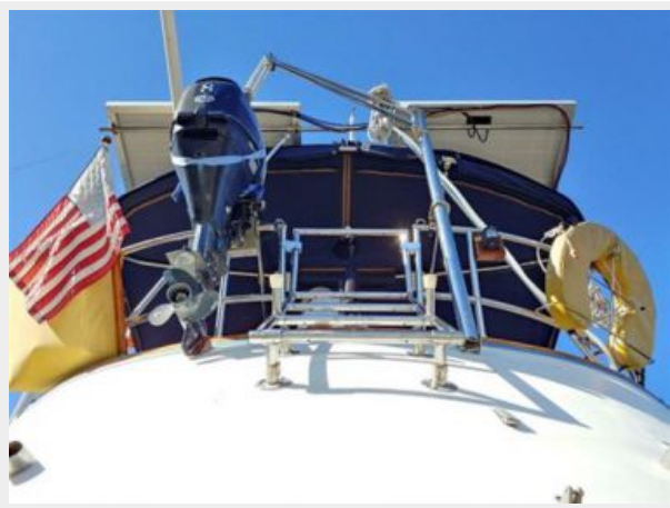
009 1989 Sabre Mark II Centerboard Aft Swim Ladder