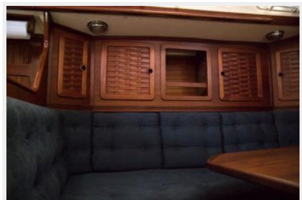
014 1989 Sabre Mark II Centerboard Port Sette