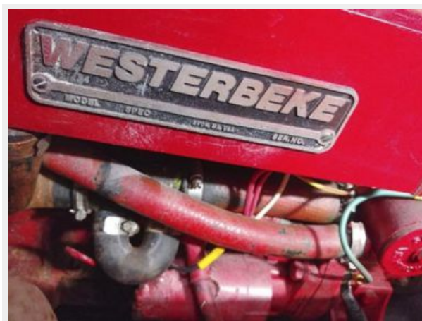
028 1989 Sabre Mark II Centerboard Engine