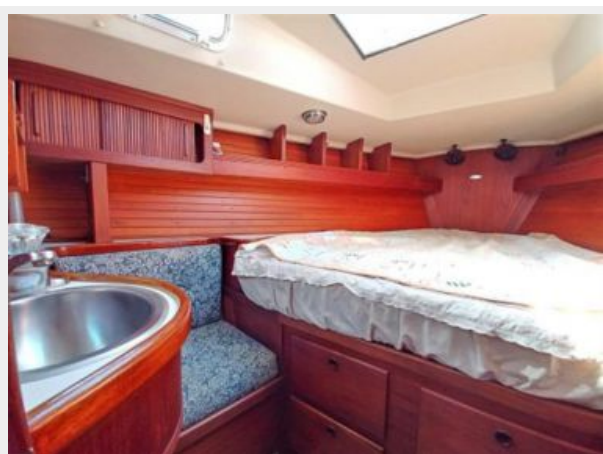
015 1989 Sabre Mark II Centerboard Forward Cabin