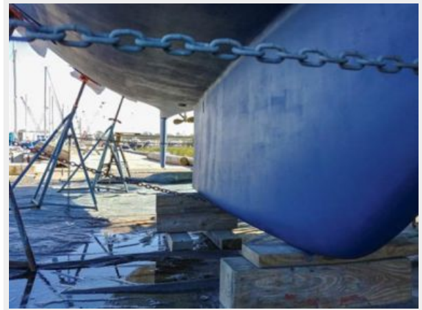
008 1989 Sabre Mark II Centerboard Keel Starboard