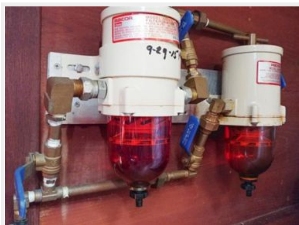
027 1989 Sabre Mark II Centerboard Racor