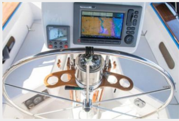
011 1989 Sabre Mark II Centerboard Helm & Electronics