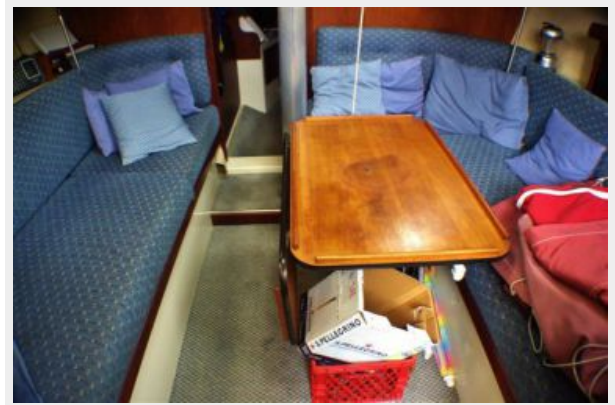
Interior looking forward