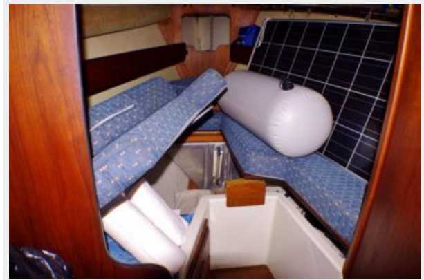
Forward cabin showing the solar panel in storage