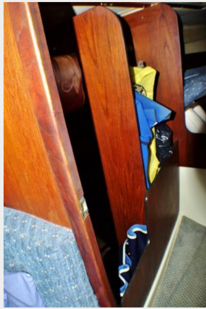
Hanging locker area