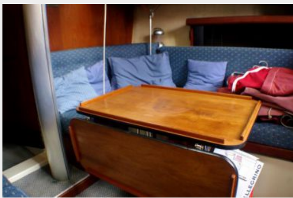
Cabin table forward