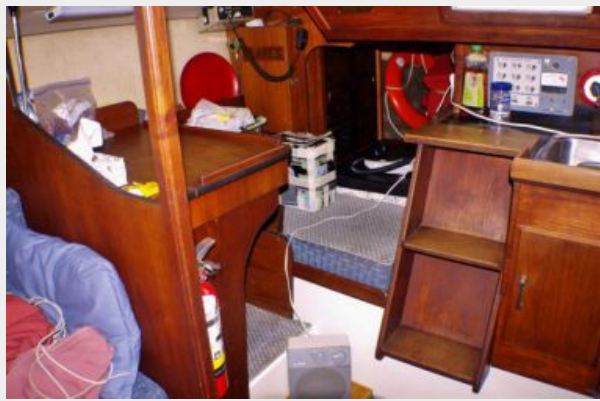
Companionway stairs, chart table and quarter berth