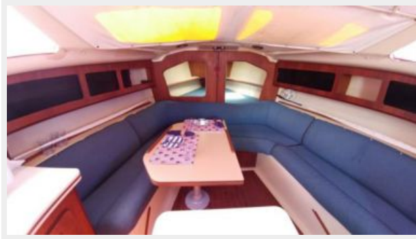
04 32' Hunter Vision interior forward