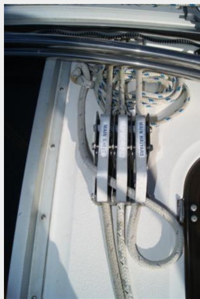
82 32' Hunter Vision Triple Clutch Stbd