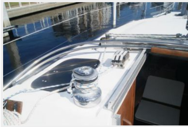
81 32' Hunter Vision port winch