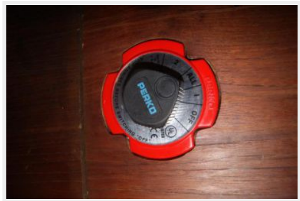
44 32' Hunter Vision battery switch