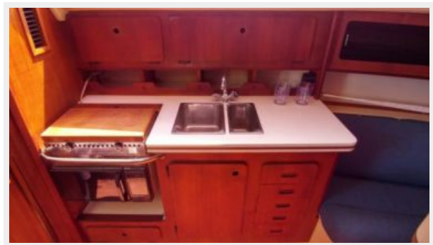
11 32' Hunter Vision galley b.