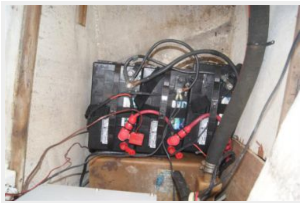
43 32' Hunter Vision Batteries