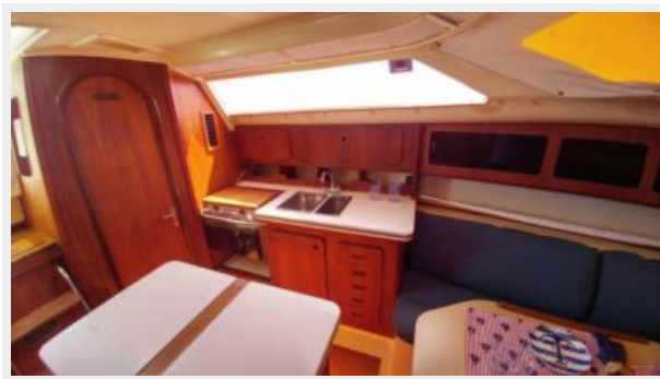
11 32' Hunter Vision galley a.