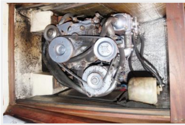
41 32' Hunter Vision engine