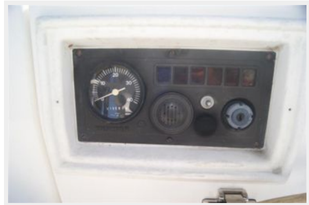
42 32' Hunter Vision Cockpit Engine gauges