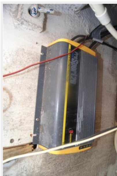
45 32' Hunter Vision battery charger