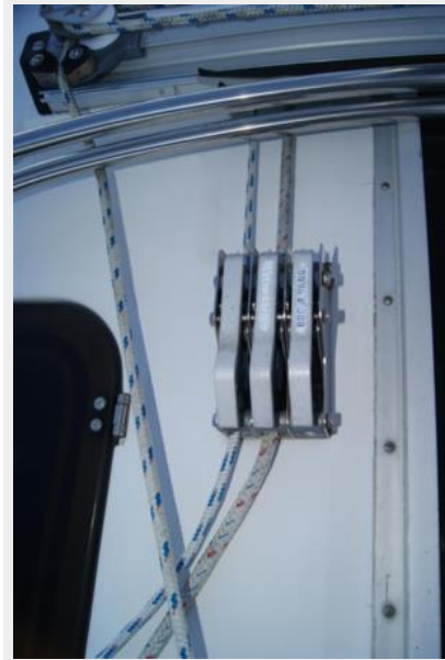
82 32' Hunter Vision Triple Clutch Port