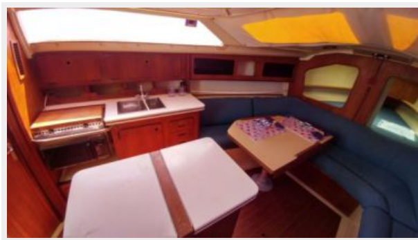
11 32' Hunter Vision galley c.