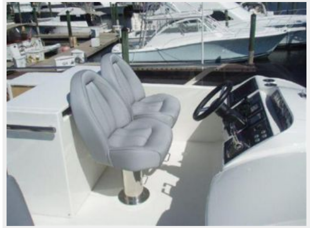
60 Princess Flybridge Helm