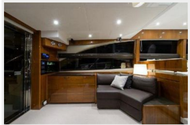
60 Princess Salon