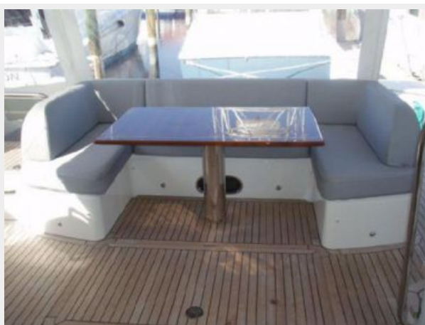
60 Princess Flybridge Dinette