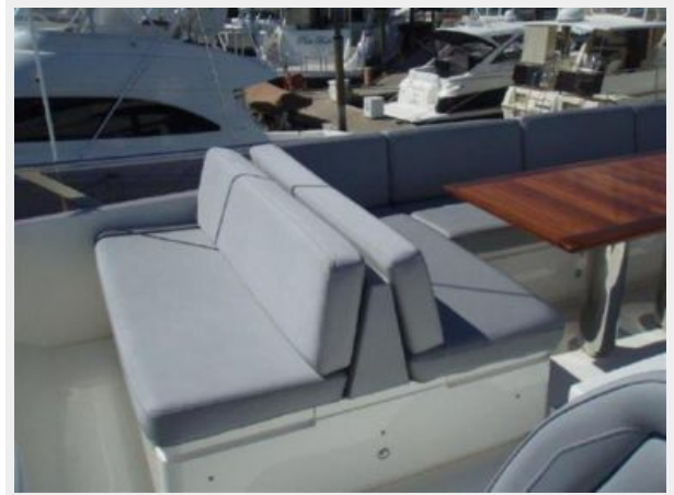
60 Princess Flybridge Seating