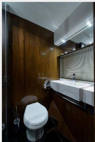
60 Princess Head