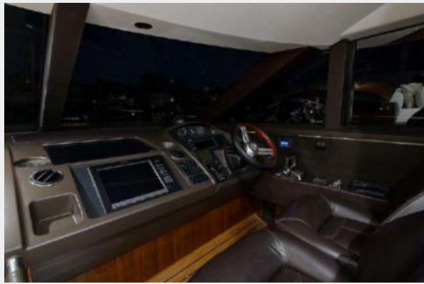
60 Princess Helm