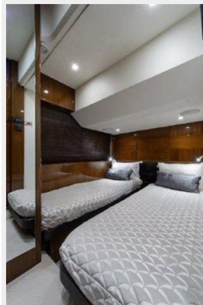
60 Princess Guest