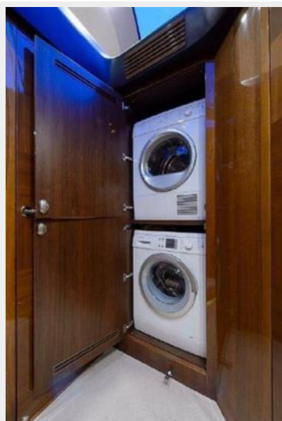
60 Princess Washer/Dryer