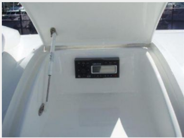
60 Princess Flybridge Controls