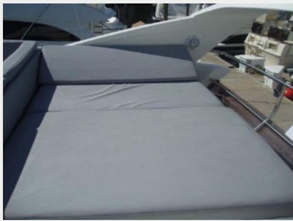
60 Princess Flybridge Lounge Seating