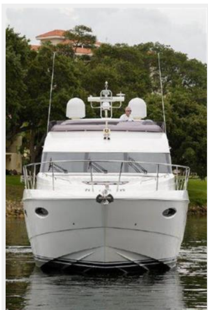
60 Princess Bow