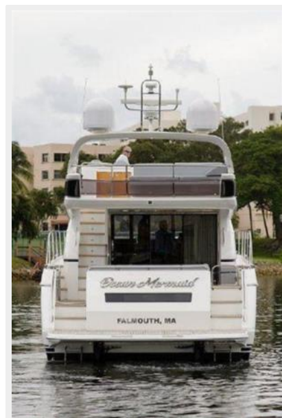
60 Princess Stern