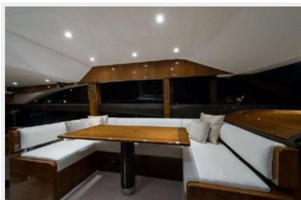
60 Princess Dinette