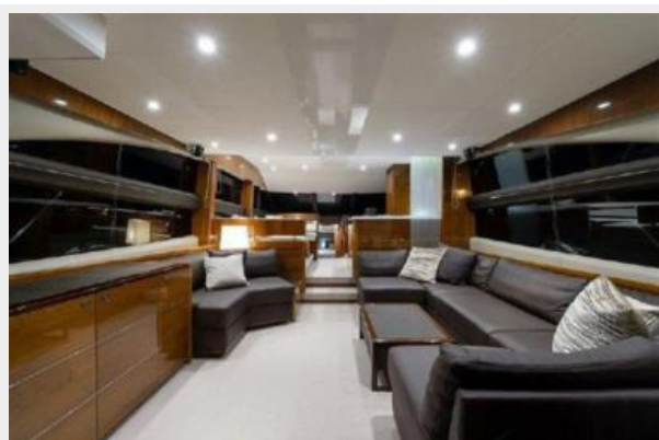
60 Princess Salon