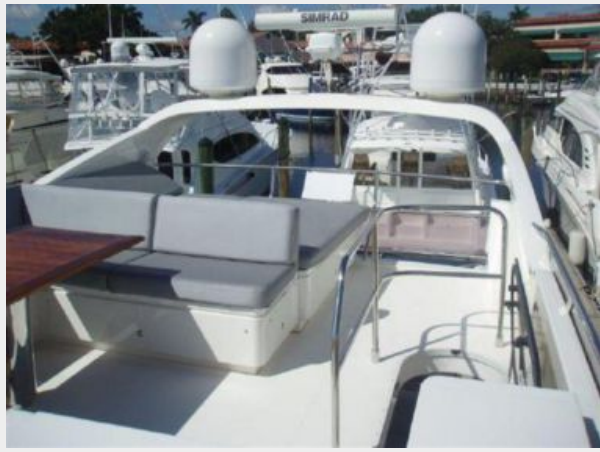
60 Princess Flybridge Looking Fwd