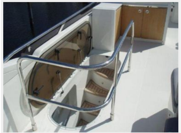
60 Princess Stairwell