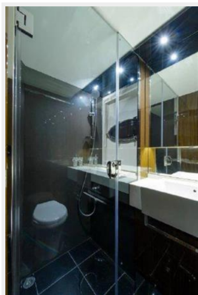
60 Princess Head