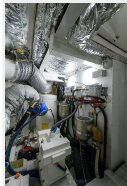
60 Princess Engine Room