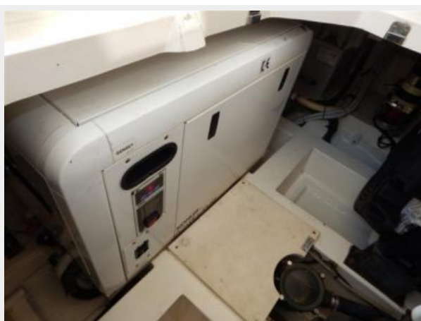
Generator in Soundbox