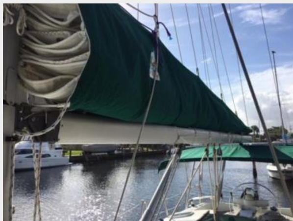
Doyle stack pack new in 2016