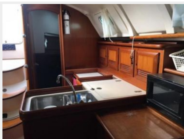
Main cabin looking forward from the galley