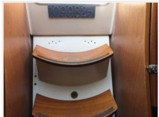
Companion way ladder and documentation number