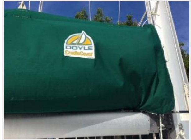
Doyle Stack pack new in 2016