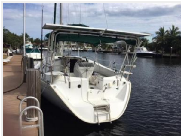
View of the transom