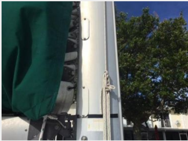
Doyle stack pack and new main in 2016