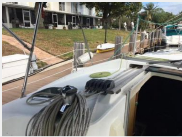
View to port from the cockpit