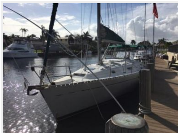
Port side bow