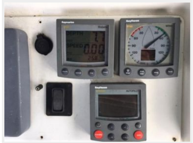
Raymarine electronics at the helm station