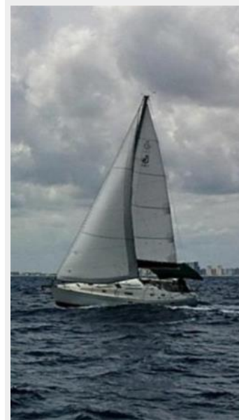
Port tack, going to weather nicely