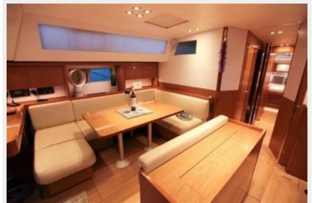
Saloon port side convertible table