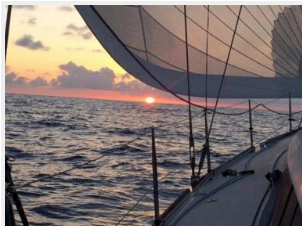
The good weather returns