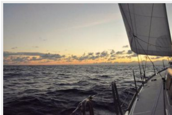
A new day.