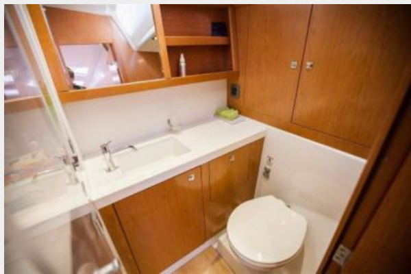
Head with separate shower