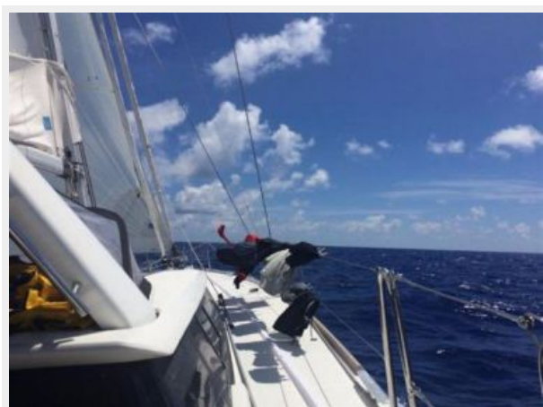
Mid Ocean drying the Laundry dries fast in the breeze.