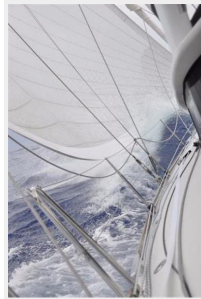
Mid Ocean on starboard tack