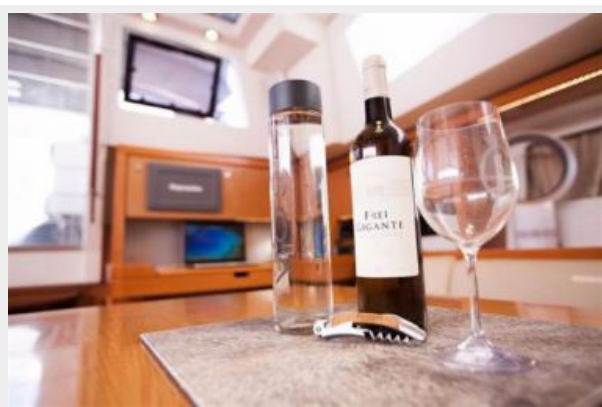
Detail showing the large convertible table and chart table