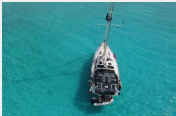
Beautiful anchorage and great view of the solar panels