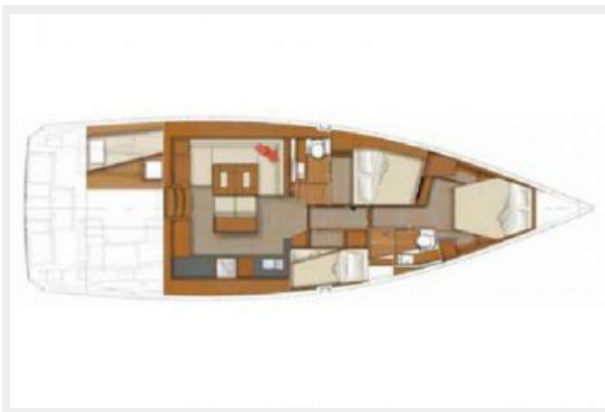
Manufacturer Provided Image: 3 Cabin Layout