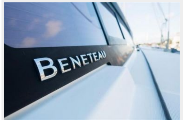
Starboard side Beneteau logo