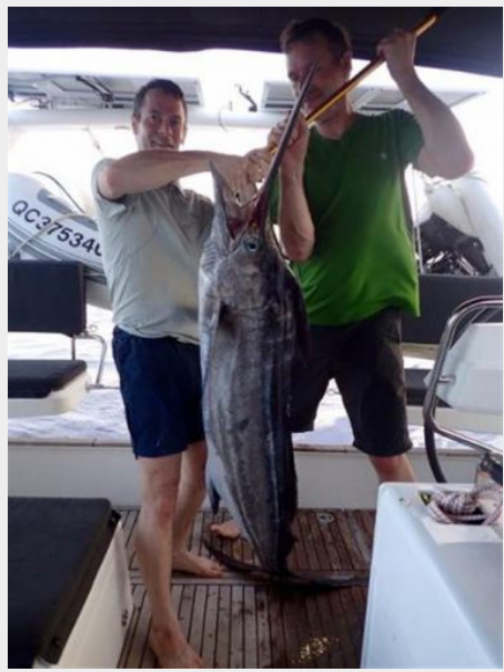
Nice catch in mid Ocean