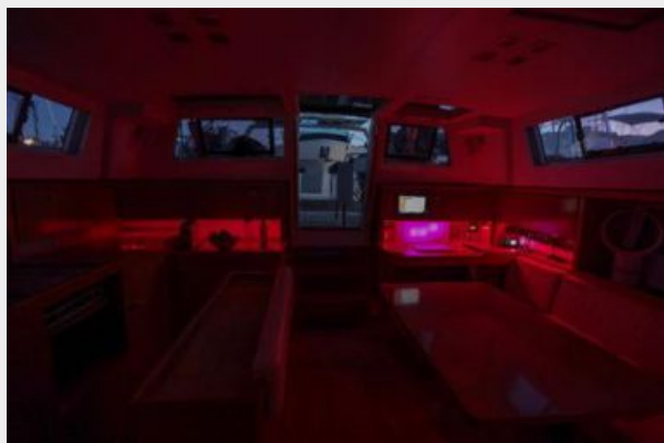
Indirect lighting in the saloon, can be any color or intensity.