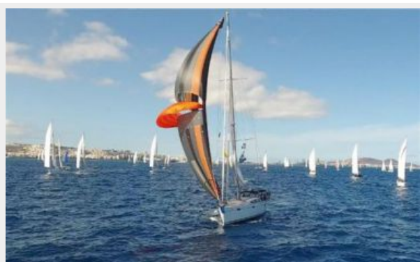
Port tack going fast with Parasailor