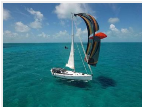
Parasailor looking great