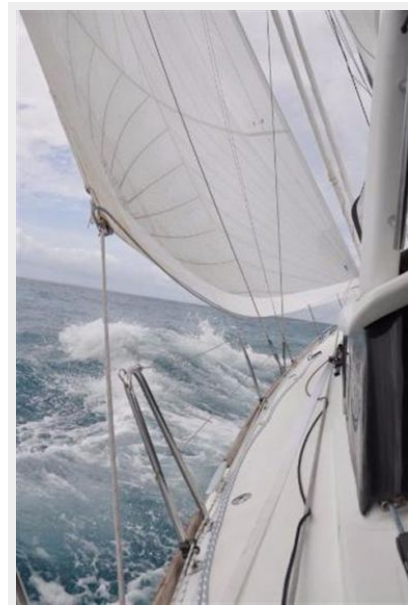
Mid Ocean on starboard tack