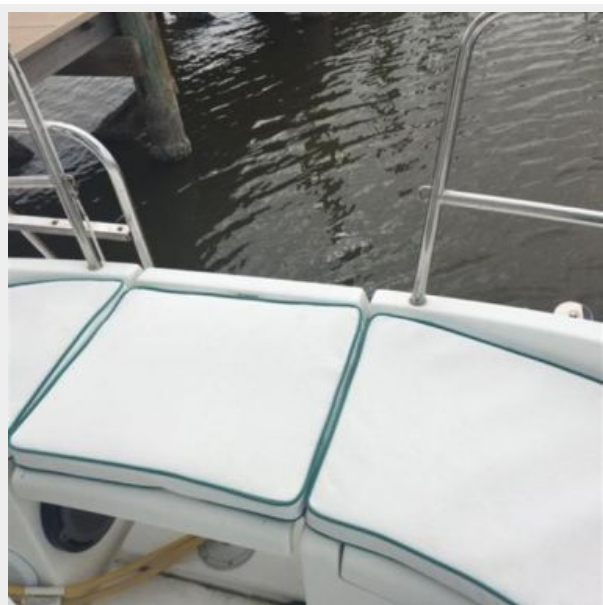
New cockpit cushions