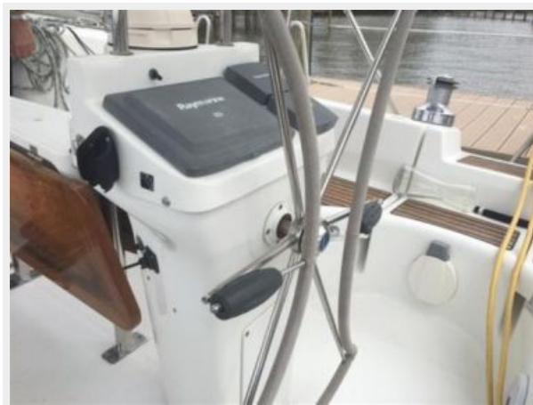
Lewmar folding wheel