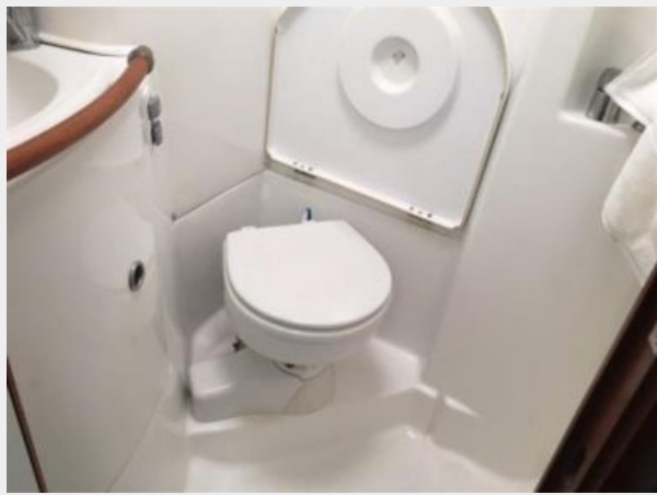
Forward head and shower stall