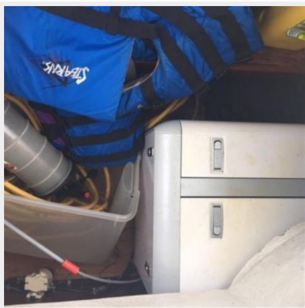
Whisper 7.5 KW generator in starboard lazerette