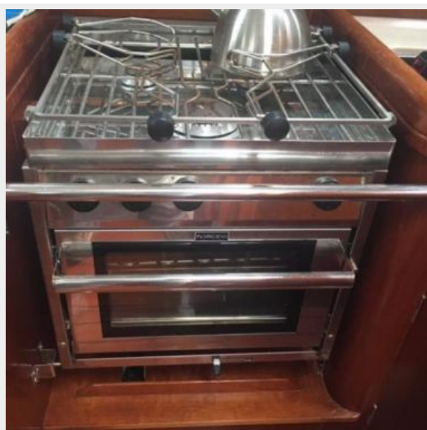
Stove with oven