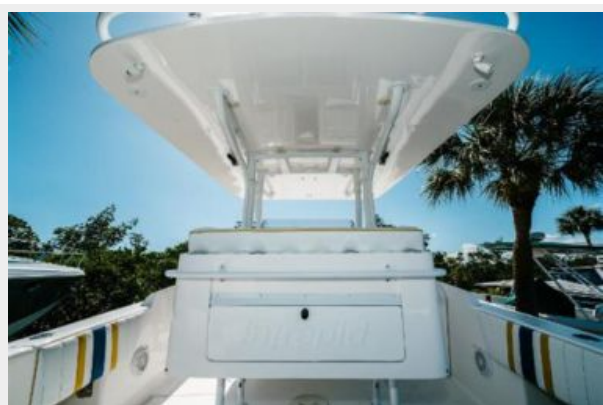
Tackle Station / Hard Top