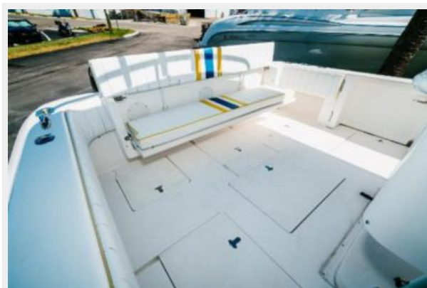
Cockpit with Fold Down Seating