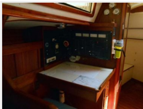
Chart Table and Navigation Station