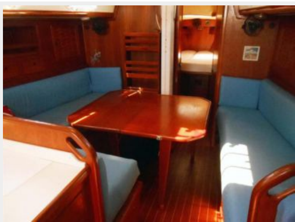
Salon with Table Leaf Up