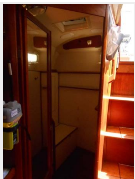
Head and Shower