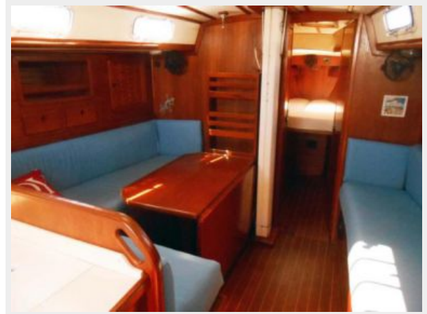
Salon with Table Leaf Down