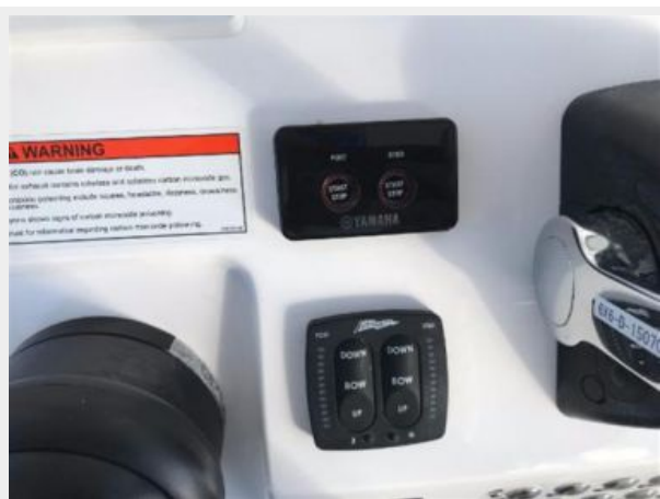
327 Intrepid | Helm- trim tabs and push start/stop buttons for engines.