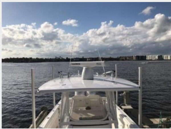
327 Intrepid | Hardtop roof- radar, outriggers, and antennas