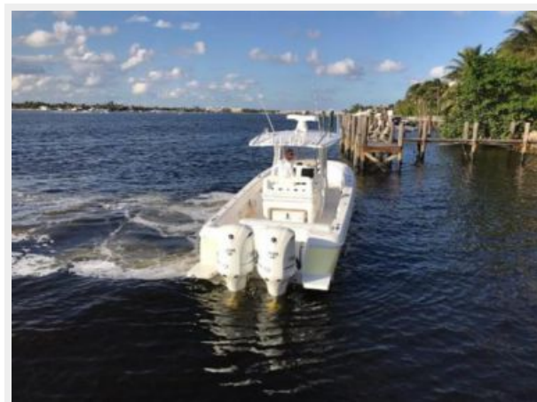
327 Intrepid | Engines and Transom