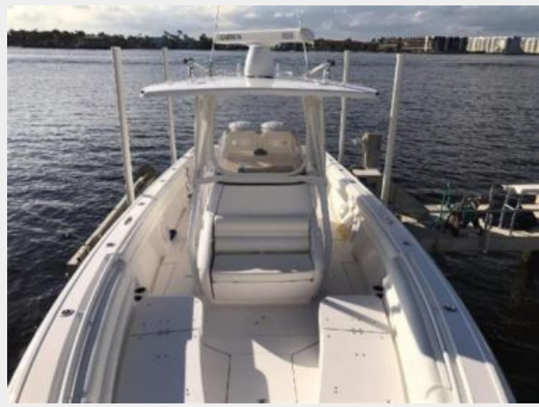
327 Intrepid | bow-stern