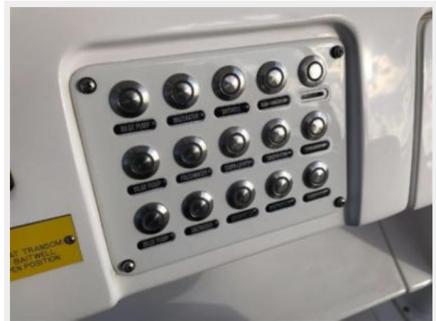
327 Intrepid | Panel for lights, bilges, and accessories.