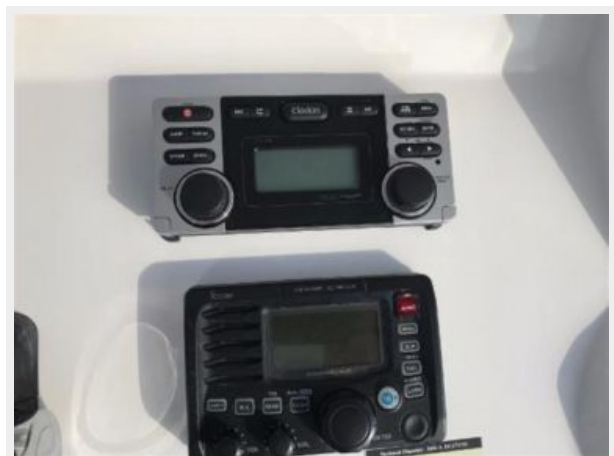
327 Intrepid | Helm- clarion stereo radio, and icom vhf radio