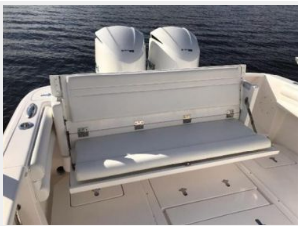
327 Intrepid | Cockpit with pull out bench open