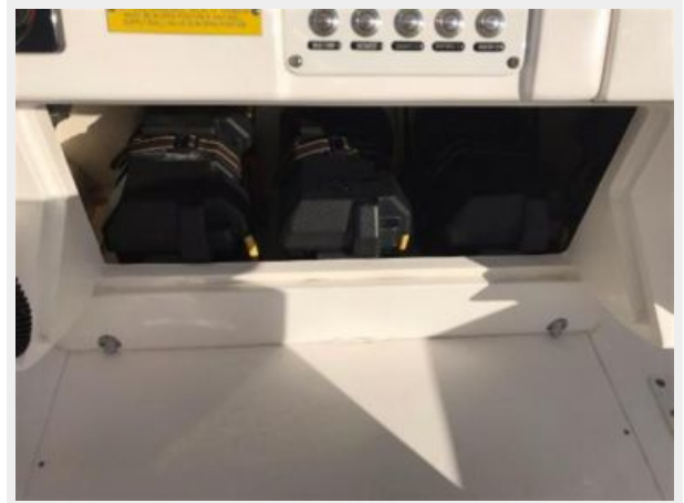
327 Intrepid | Battery Boxes