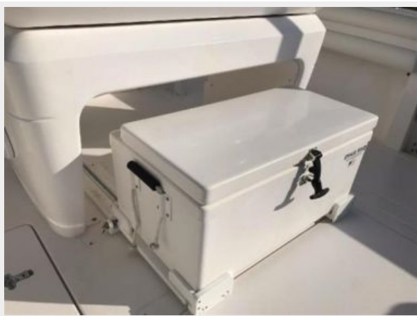
327 Intrepid | frigid rigid insulated cooler, pulled out