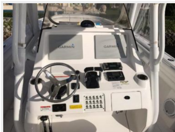
327 Intrepid | View of helm