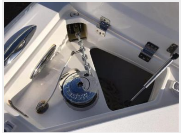
327 Intrepid | windlass anchor