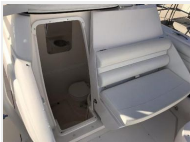
327 Intrepid | Forward console bench slides open to enter head