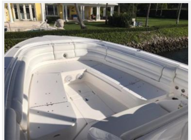
327 Intrepid | Bow with forward seating (cushions not pictured)