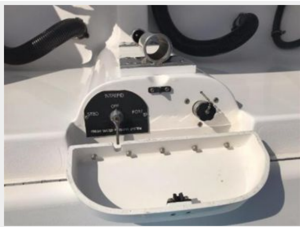
327 Intrepid | Transom, with easy to use flush system for engines