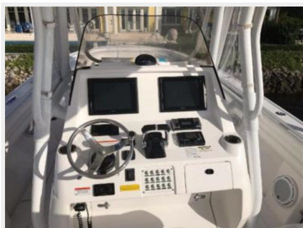
327 Intrepid | Helm without covers