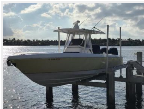
327 Intrepid | on the lift