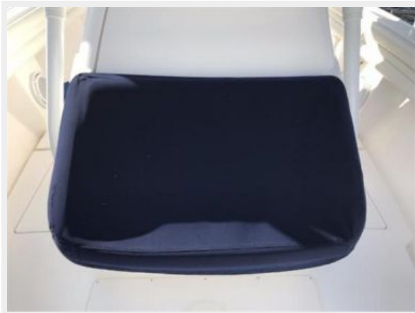
327 Intrepid | Forward Console bench with cover