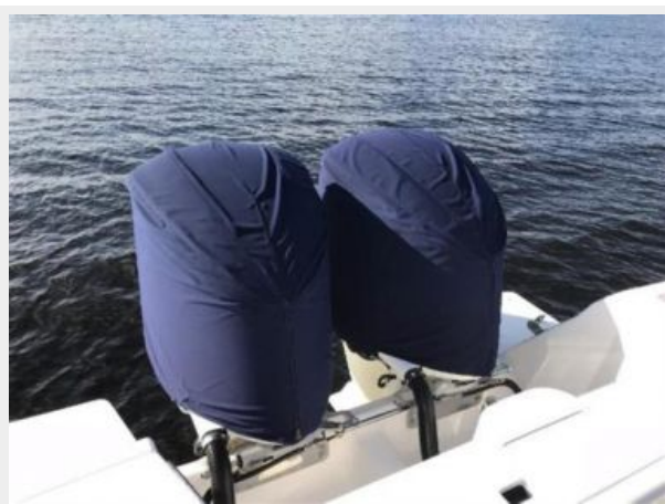
327 Intrepid | Engines with covers