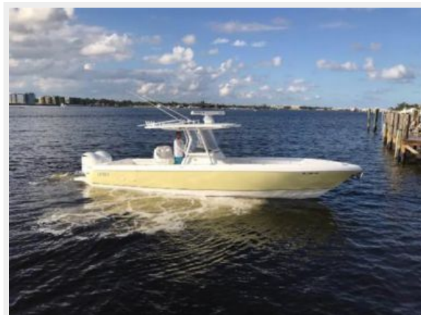
327 Intrepid | Starboard side