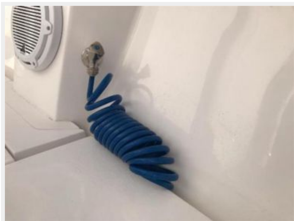
327 Intrepid | freshwater washdown