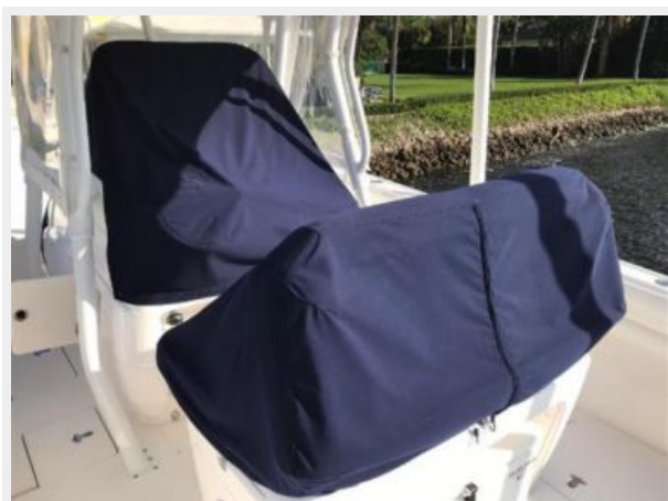
327 Intrepid | Console, helm, and seat covers