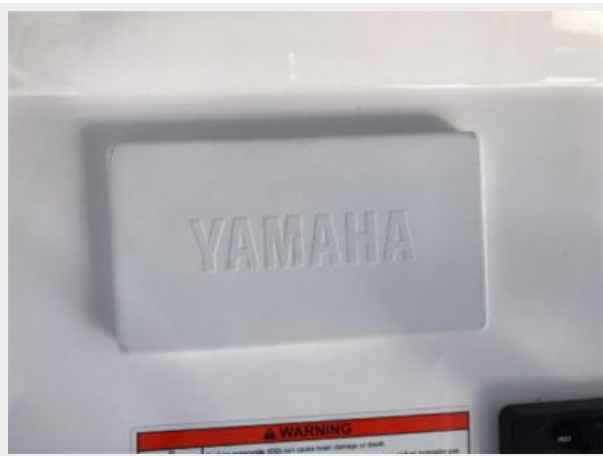
327 Intrepid | Yamaha engines computer