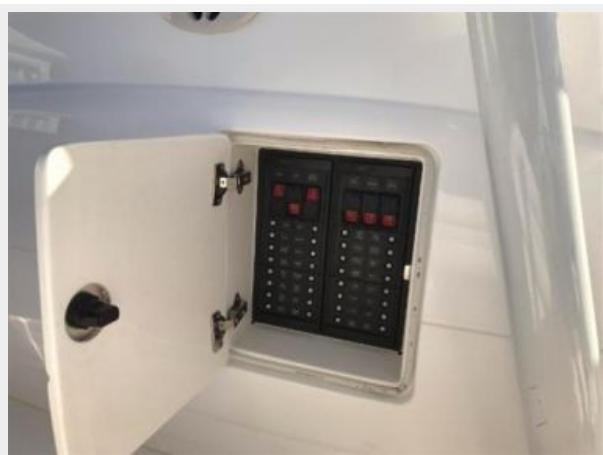
327 Intrepid | Battery switches panel