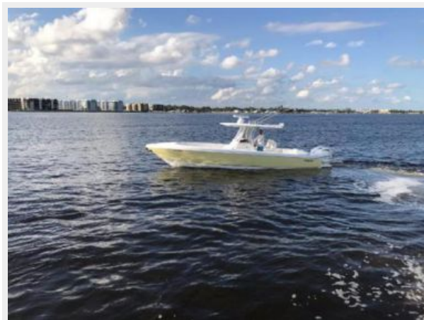
327 Intrepid | Port side