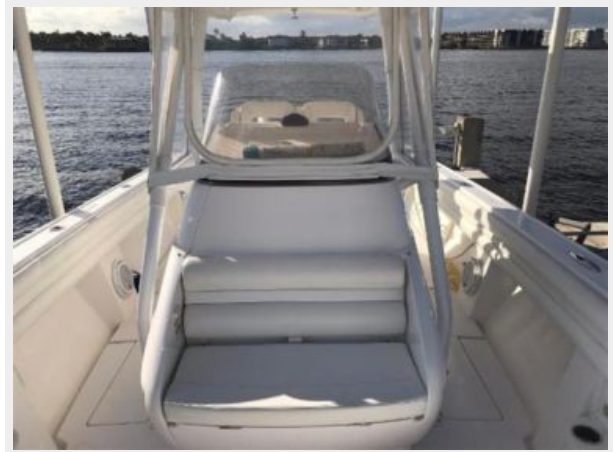
327 Intrepid | Forward console bench