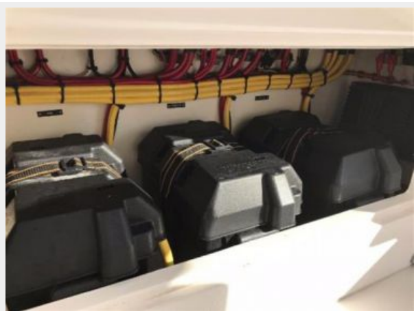
327 Intrepid | Battery boxes