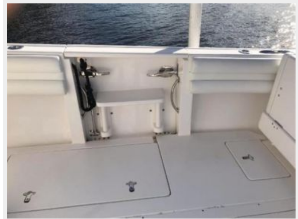
327 Intrepid | fold out dive door