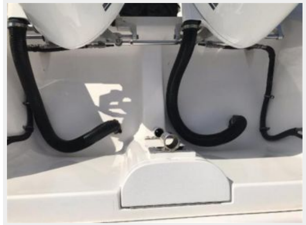
327 Intrepid | Transom