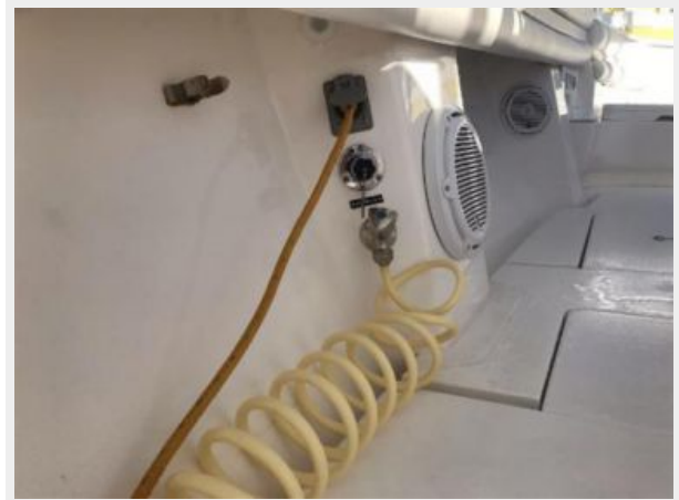
327 Intrepid | saltwater washdown,