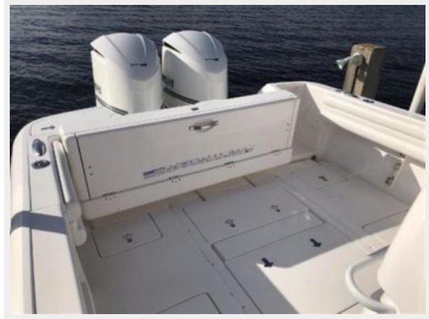
327 Intrepid | Cockpit