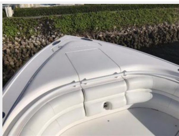
327 Intrepid | Bow storage compartment