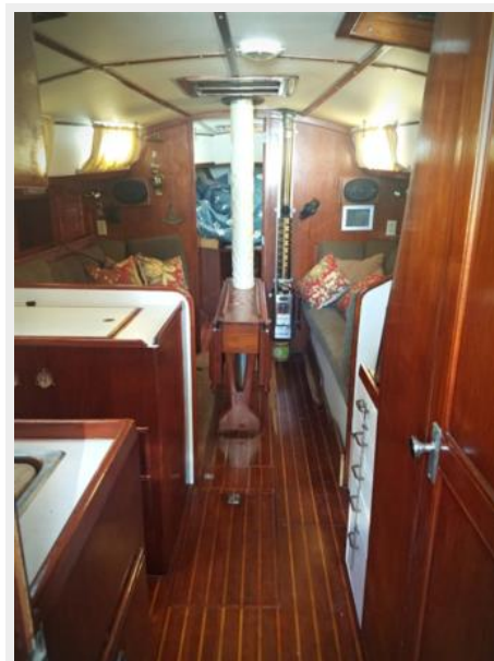
008 Pearson 424 Salon