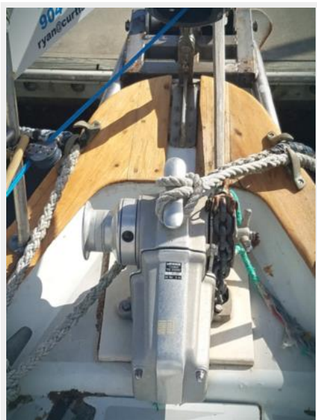
006 Pearson 424 Windlass