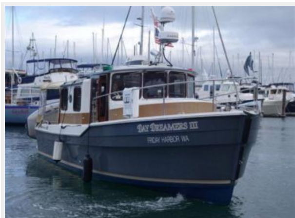
Starboard Qtr View