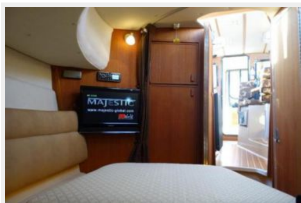
Forward Cabin 2