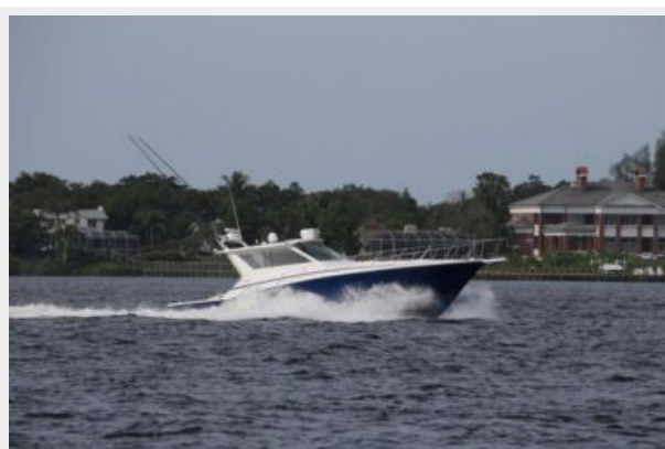
1997 45 Cabo Express