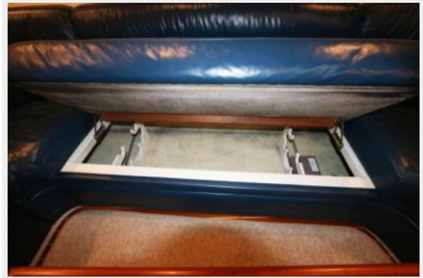
1997 45 Cabo Exp IMG_a2874