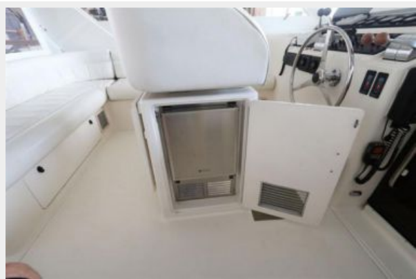
1997 45 Cabo Exp IMG_b2851