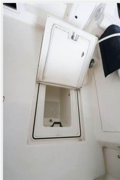
1997 45 Cabo Exp IMG_c2831