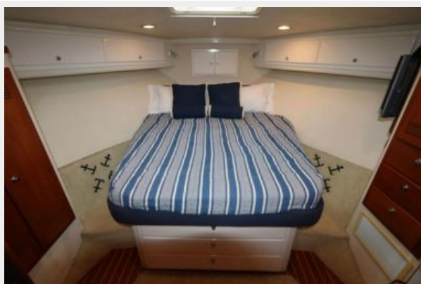
1997 45 Cabo Exp IMG_a2861