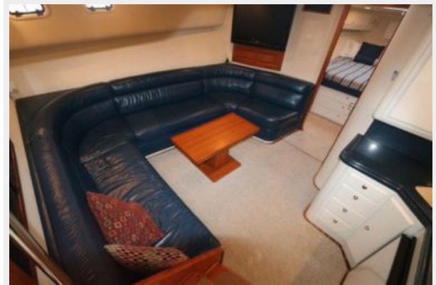
1997 45 Cabo Exp IMG_a2854