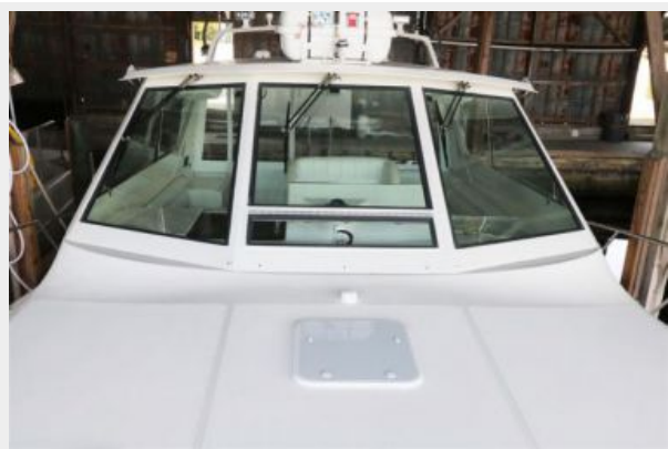
1997 45 Cabo Exp IMG_d2876