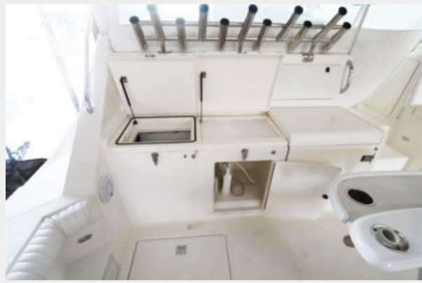
1997 45 Cabo Exp IMG_c2844