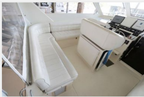
1997 45 Cabo Exp IMG_b2853