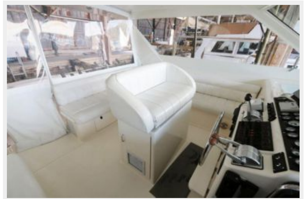
1997 45 Cabo Exp IMG_b2852