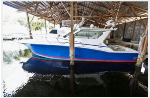
1997 45 Cabo Exp IMG_d2878