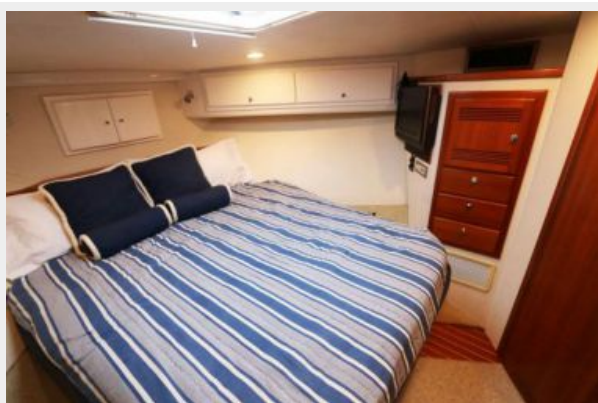
1997 45 Cabo Exp IMG_a2863