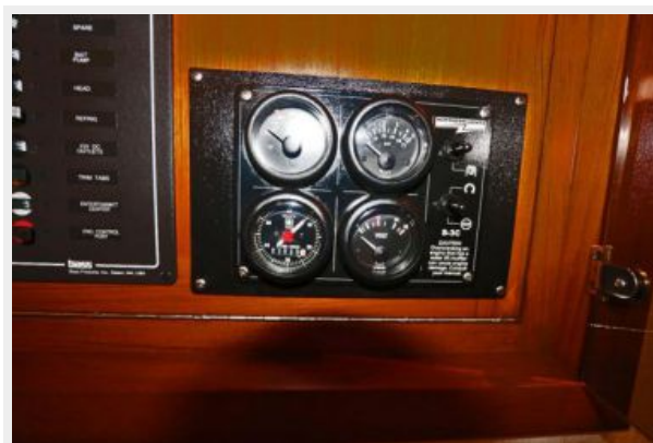
1997 45 Cabo Exp IMG_f2860