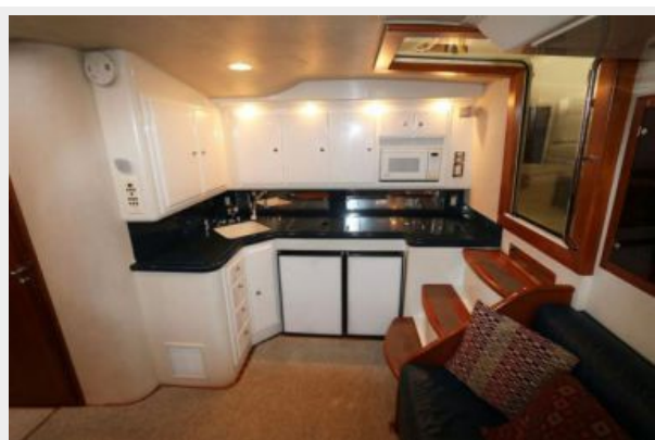
1997 45 Cabo Exp IMG_a2856