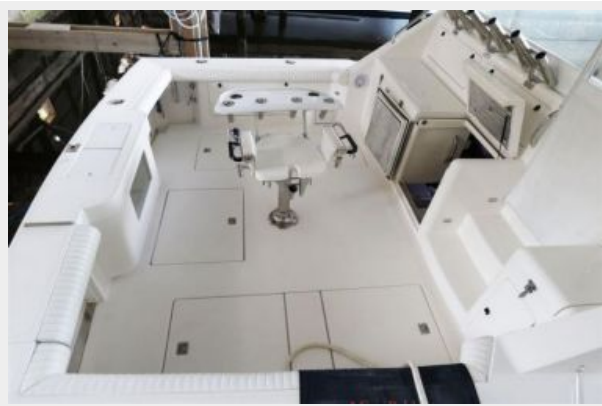
1997 45 Cabo Exp IMG_c2828