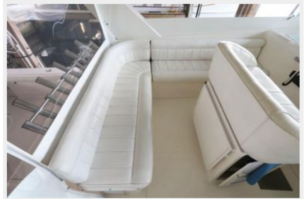
1997 45 Cabo Exp IMG_b2850