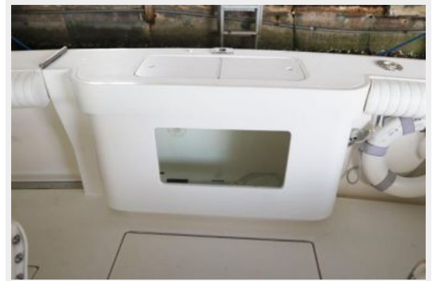
1997 45 Cabo Exp IMG_c2833