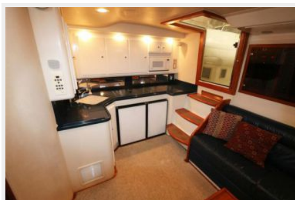
1997 45 Cabo Exp IMG_a2857