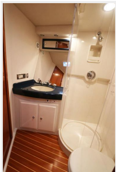
1997 45 Cabo Exp IMG_a2867