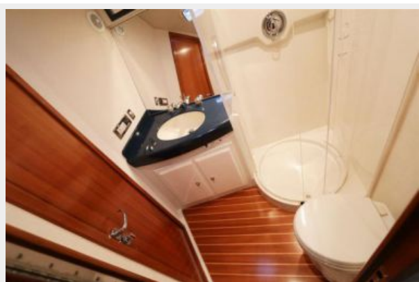
1997 45 Cabo Exp IMG_a2868