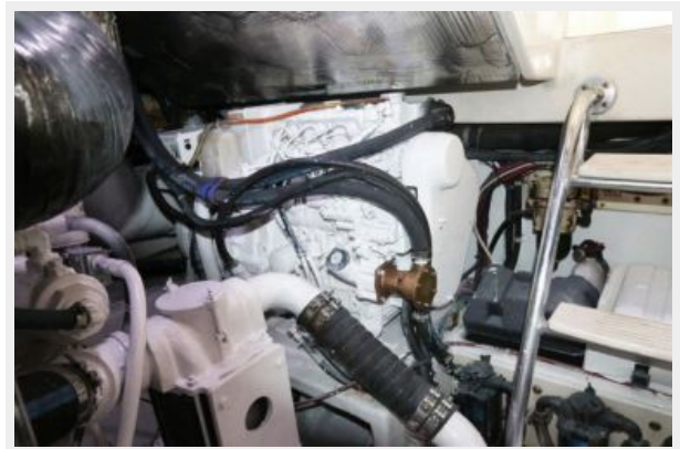
1997 45 Cabo Exp IMG_e2838