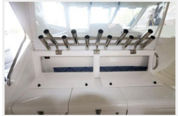
1997 45 Cabo Exp IMG_c2841