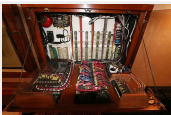
1997 45 Cabo Exp IMG_f2859