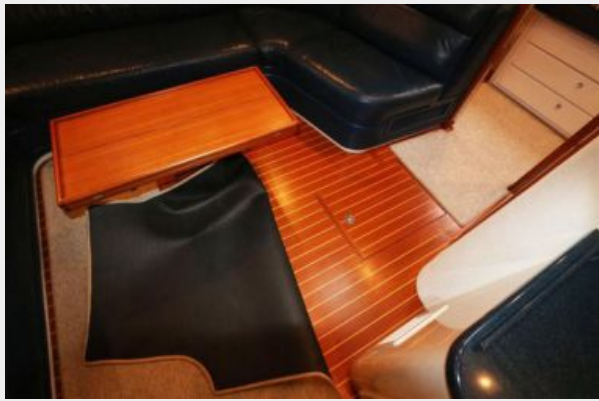
1997 45 Cabo Exp IMG_a2873