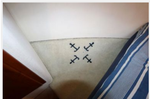
1997 45 Cabo Exp IMG_a2864