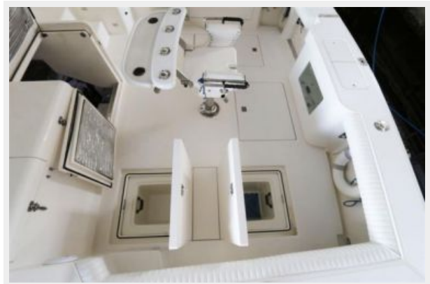
1997 45 Cabo Exp IMG_c2832