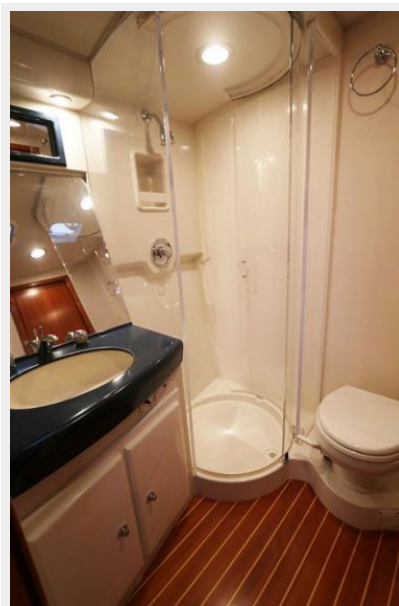
1997 45 Cabo Exp IMG_a2866