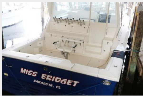
1997 45 Cabo Exp IMG_c2875