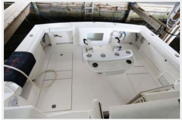
1997 45 Cabo Exp IMG_c2829