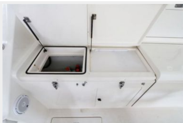
1997 45 Cabo Exp IMG_c2845