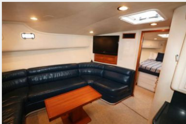
1997 45 Cabo Exp IMG_a2872