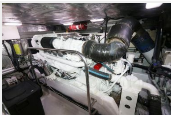
1997 45 Cabo Exp IMG_e2836