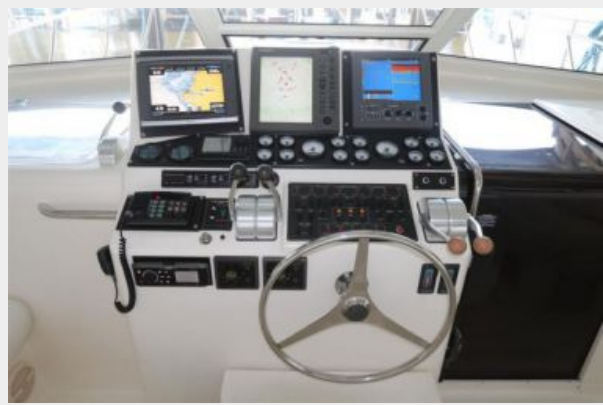
1997 45 Cabo Exp IMG_b2847