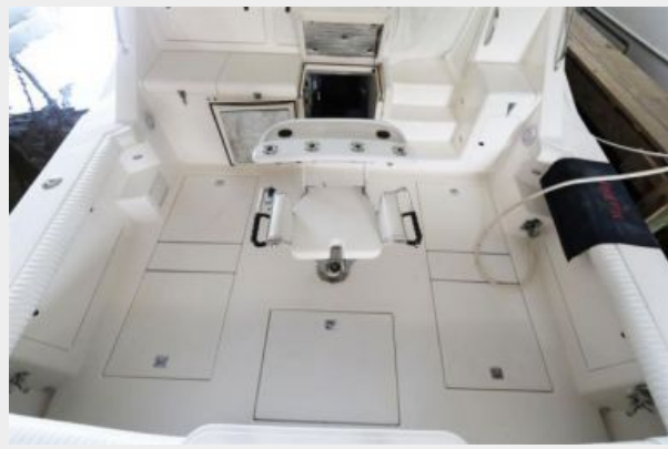
1997 45 Cabo Exp IMG_c2830