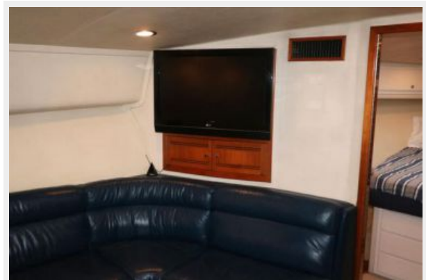
1997 45 Cabo Exp IMG_a2871