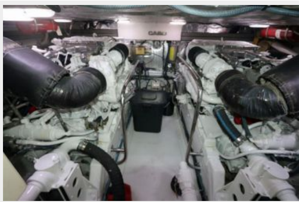
1997 45 Cabo Exp IMG_e2840