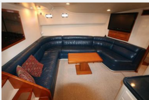
1997 45 Cabo Exp IMG_a2858