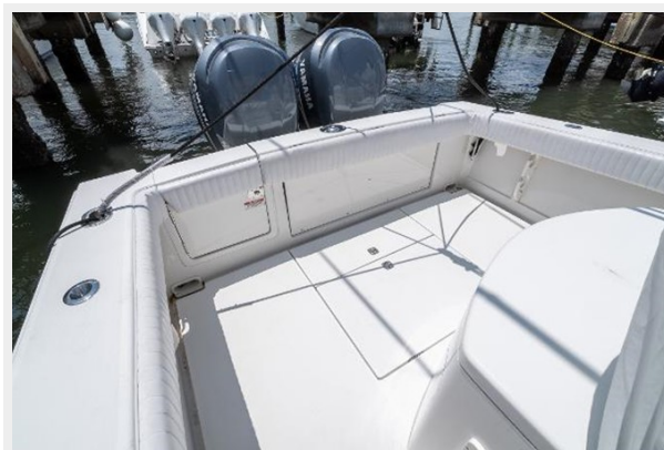
Cockpit with Seating Up