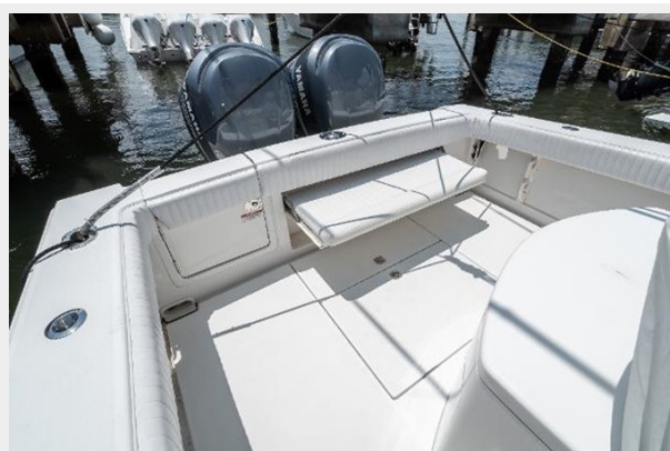
Cockpit with Seating Down