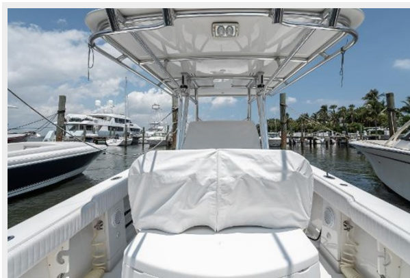
Cockpit Looking Forward