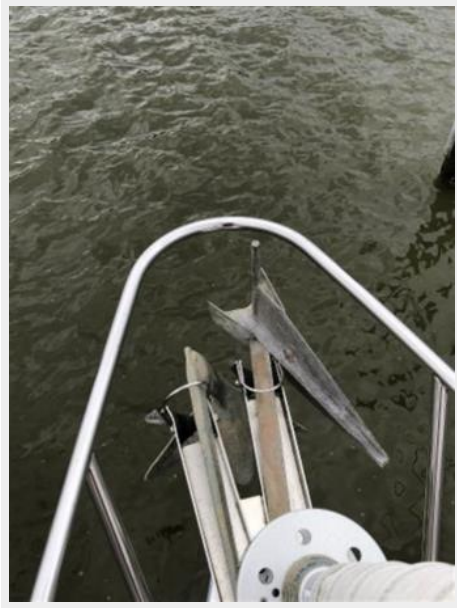
Double anchor rollers.