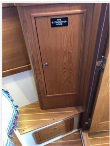
Forward cabin hanging locker -stbd