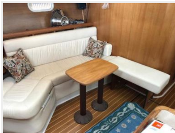
Main Salon with small table fitted (large table included).