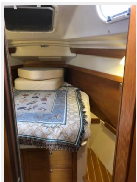
Forward cabin with Island berth