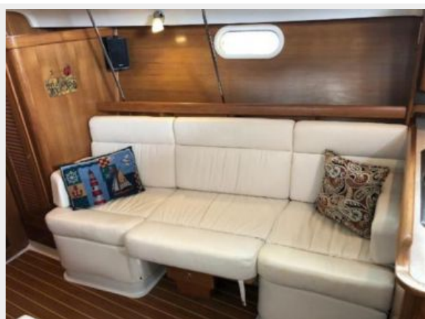
Starboard side set as settee