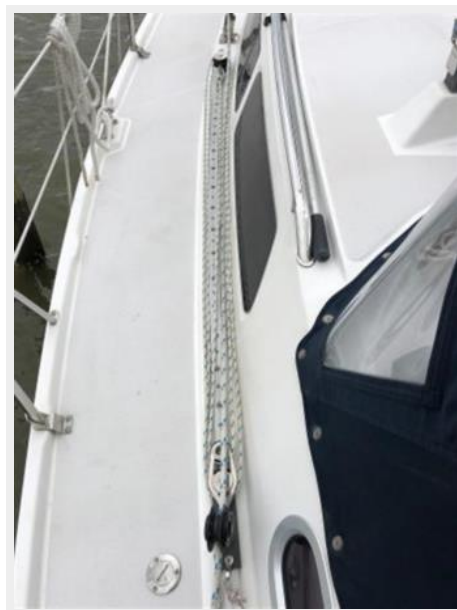
Bow/ electric windlass below deck.