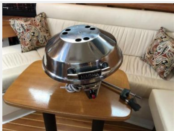
Included Magma grill (never used)