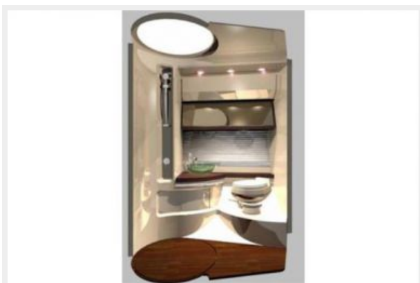
Manufacturer Provided Image: Owners Head