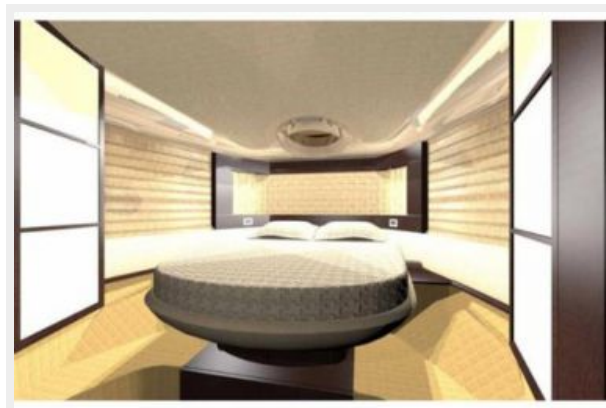
Manufacturer Provided Image: Owners Cabin