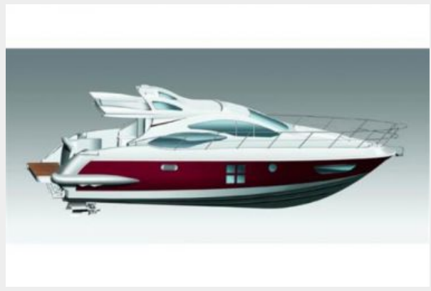
Manufacturer Provided Image: 43S Profile