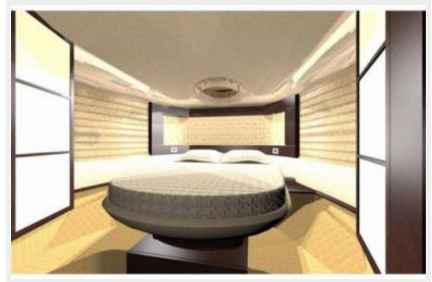
Manufacturer Provided Image: Owners Cabin