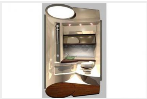
Manufacturer Provided Image: Owners Head