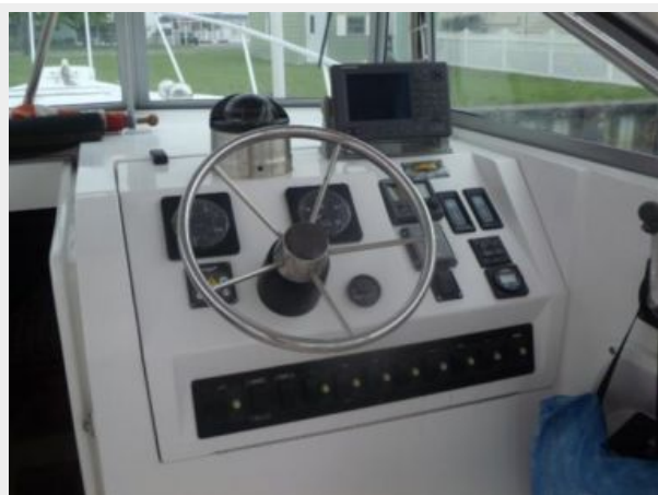
Helm / Electronics & Navigation 1