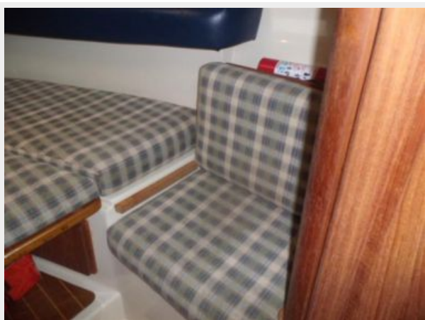
Main Cabin 3