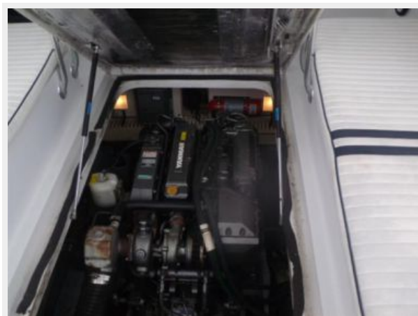
Engine & Mechanical Equipment