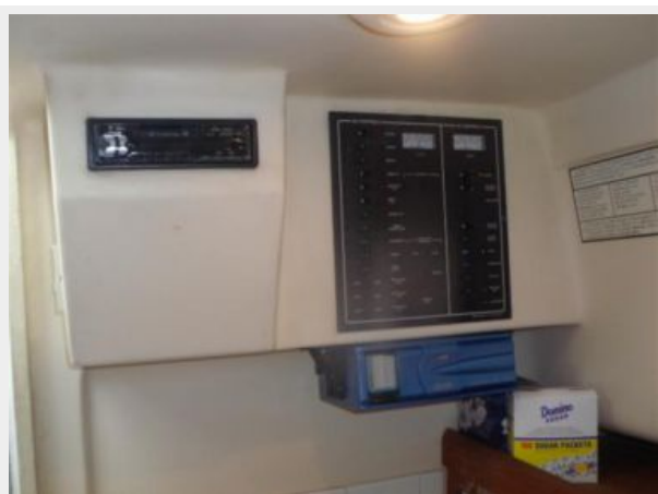
Electrical System / Equipment 1