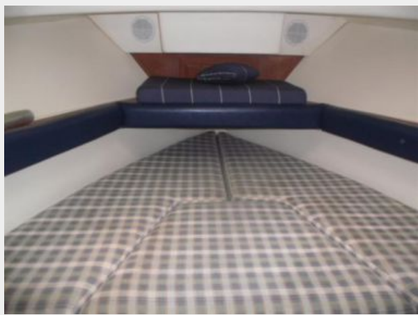
Main Cabin 1