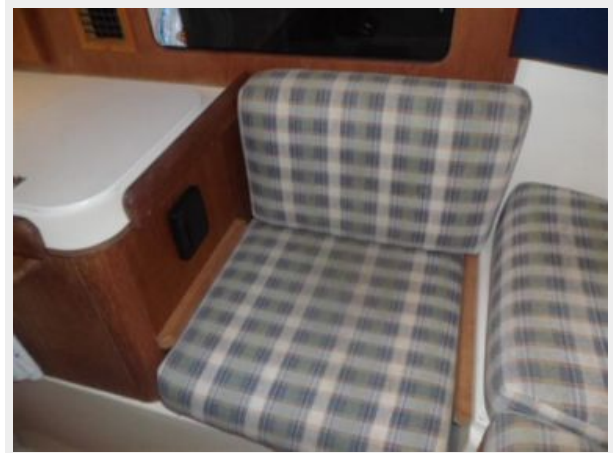
Main Cabin 2