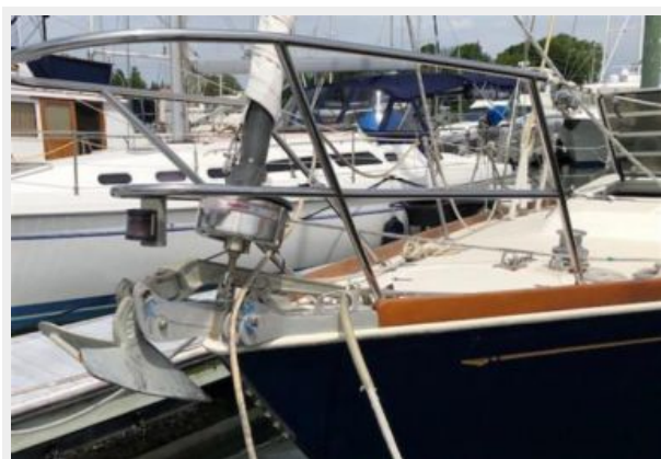
Stemhead with optional second bow roller