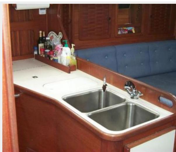
Galley with double sinks and generous counter space