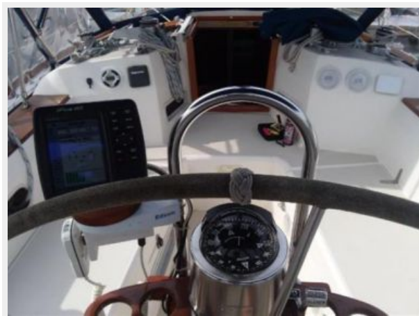
From behind the wheel