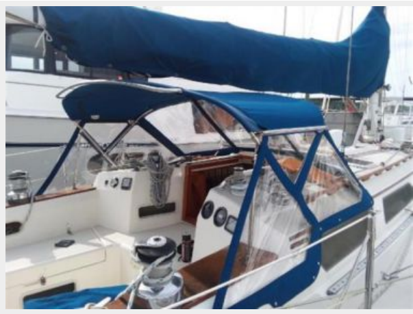
All new canvas in 2017