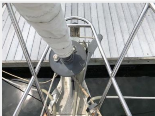
Harken roller furling Genoa