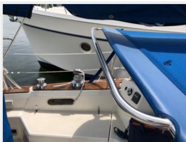
New dodger in 2017 with Stainless handrail