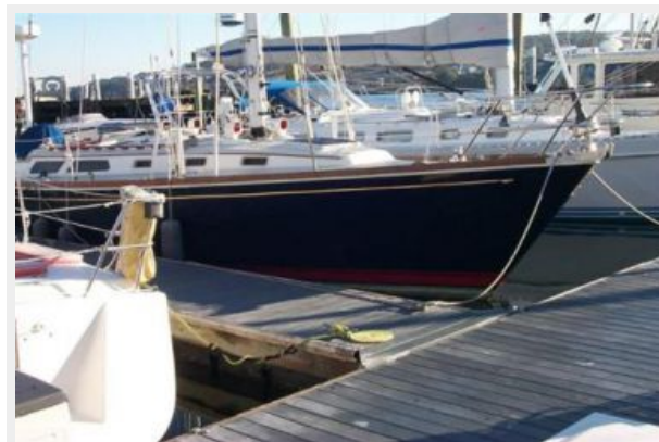
In her slip