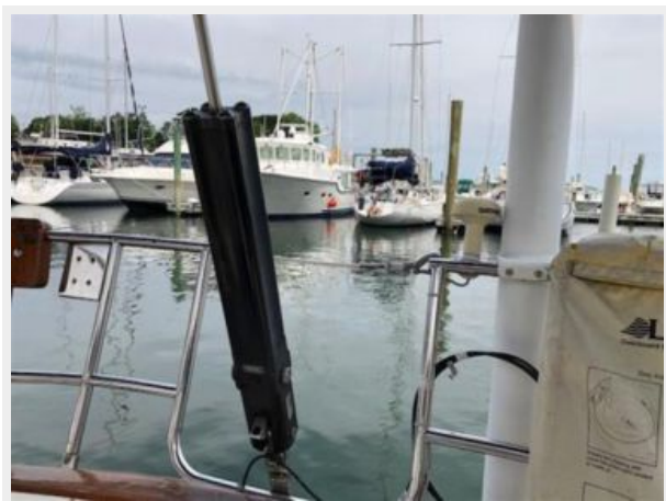
Navtec Hydraulic backstay adjuster