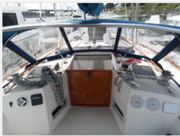
New dodger 2017