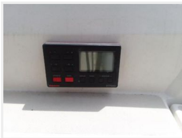
ST7000 autopilot control