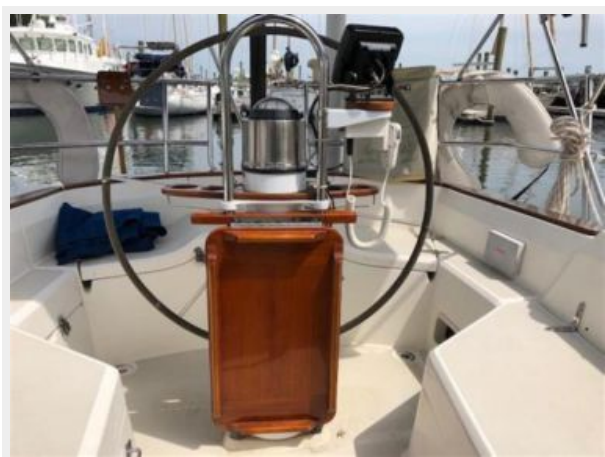
Folding cockpit table