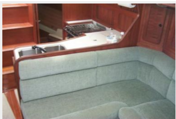
Main cabin settee