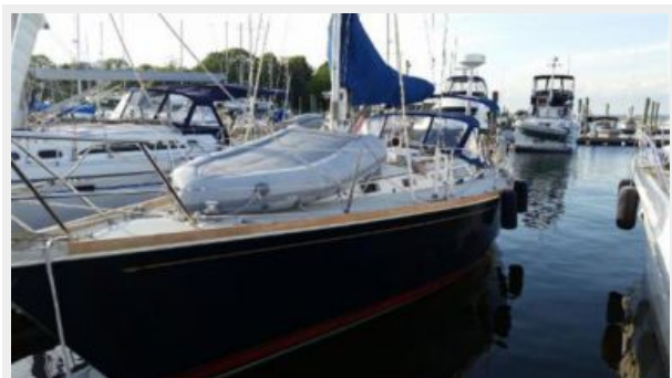
"Paddington" ready to cruise