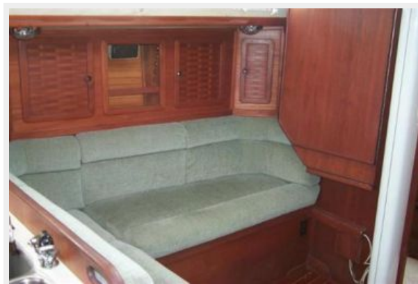
Port side settee