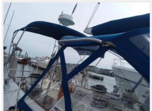
Dodger with handrails on both sides of the boat