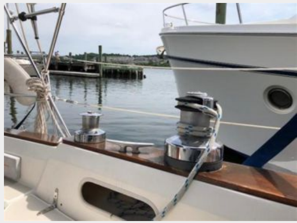
Port side cockpit winches