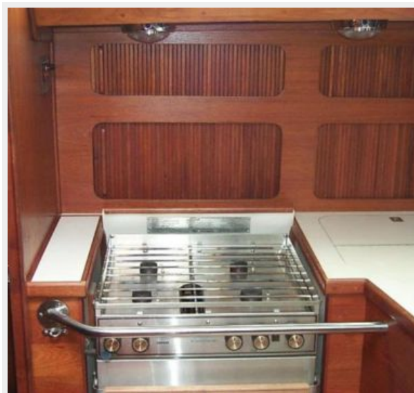
Four burner stove with oven