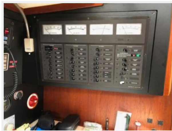
Breaker panel for DC/AC voltage