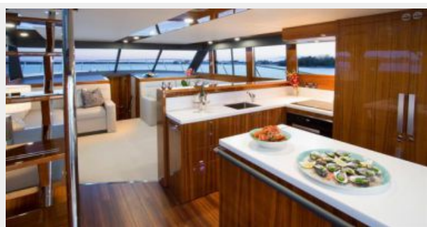
Maritimo M59 Galley