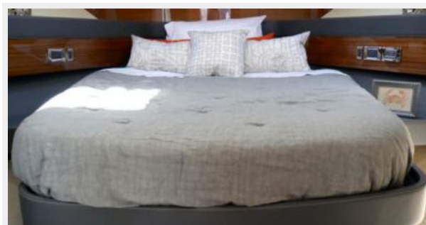
Maritimo M59 VIP Stateroom