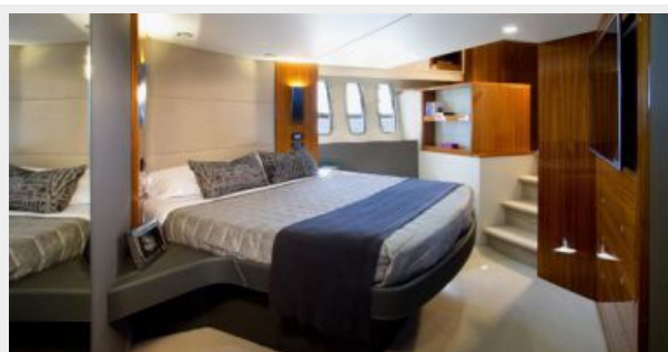
Maritimo M59 Master Stateroom