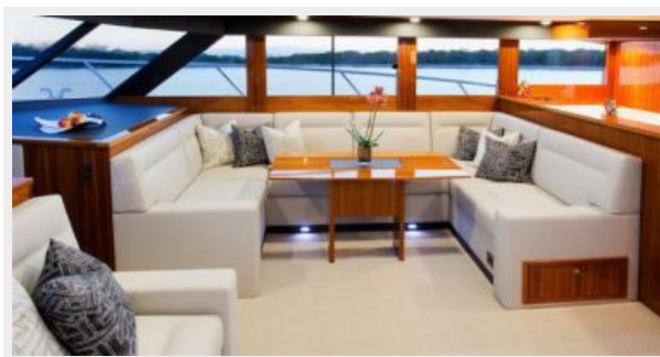
Maritimo M59 Salon