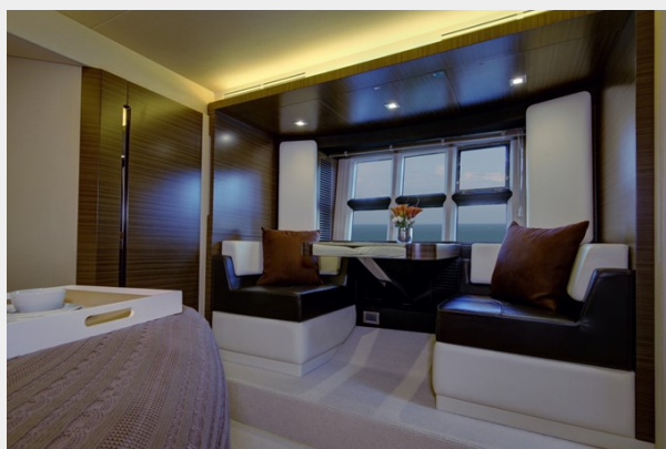
Master Stateroom 3