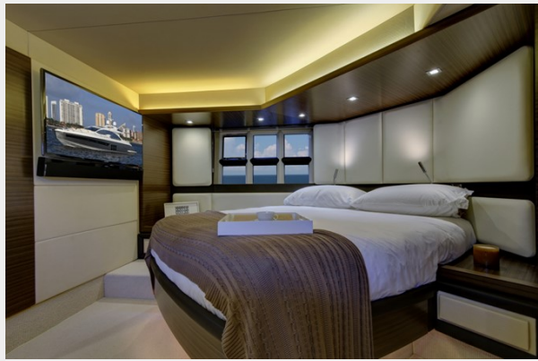
Master Stateroom 1