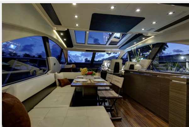
Salon/ Dinette 2