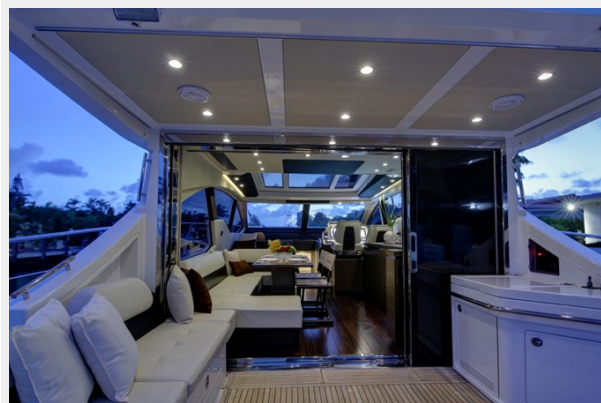
Aft Deck- Salon 2