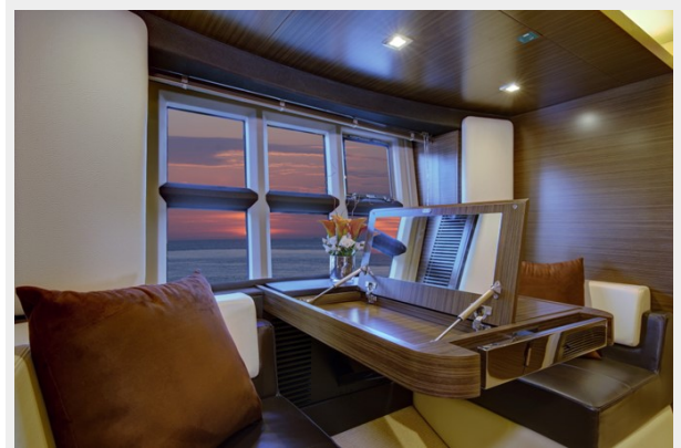
Master Stateroom 4