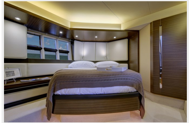
Master Stateroom 2