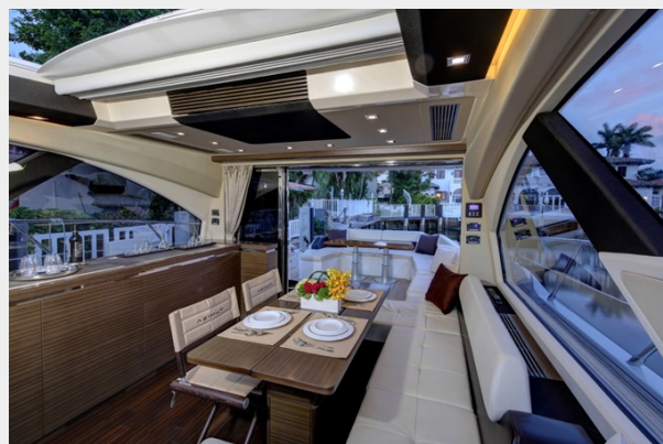
Salon/ Dinette 4