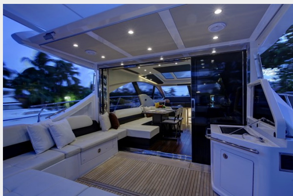
Aft Deck- Salon 1