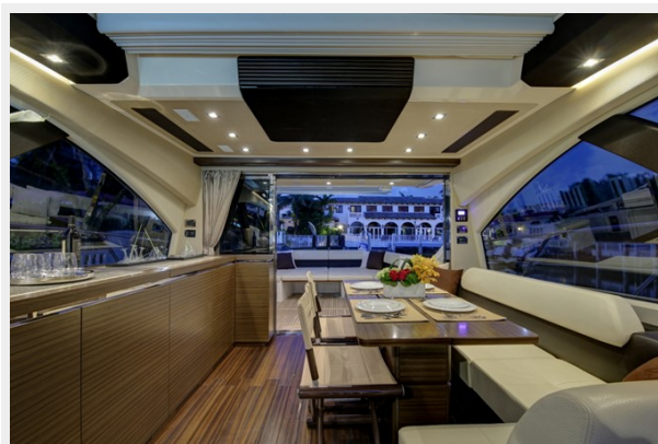
Salon/ Dinette 1