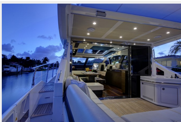
Aft Deck- Salon 3