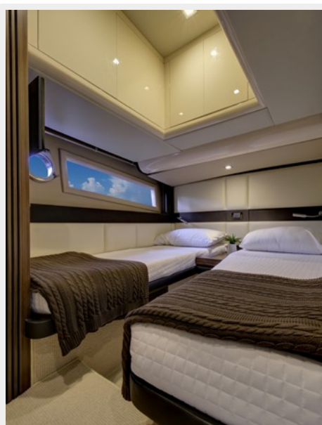
Starboard Guest Stateroom 1