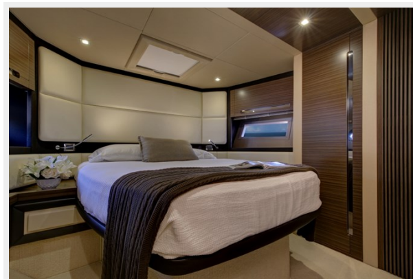
Bow VIP Stateroom 3