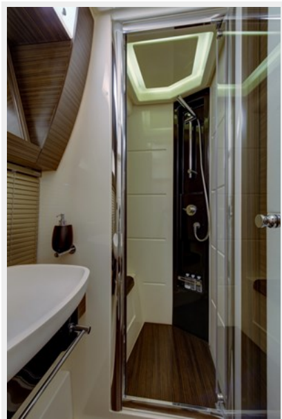
Ensuite Master Head 1