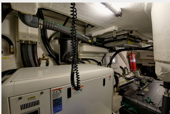
Engine Room 1