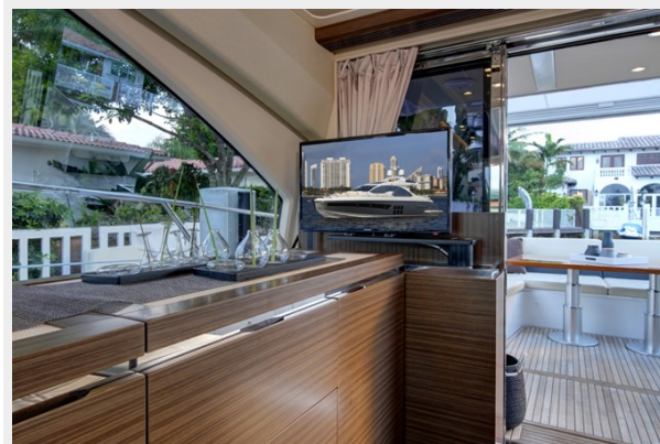
Salon/ Hideaway Galley