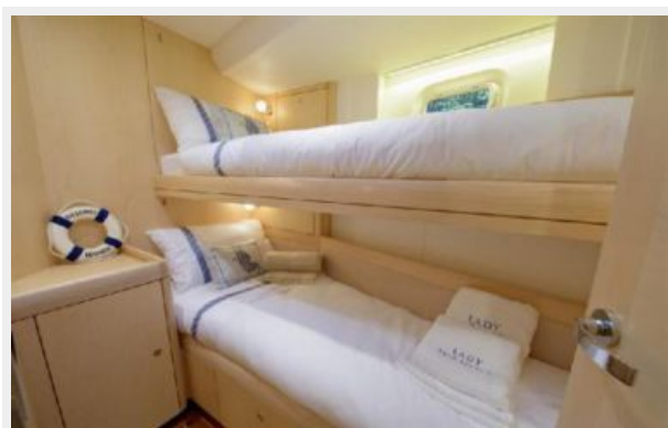
LADY MARIPOSA - 5.jpg