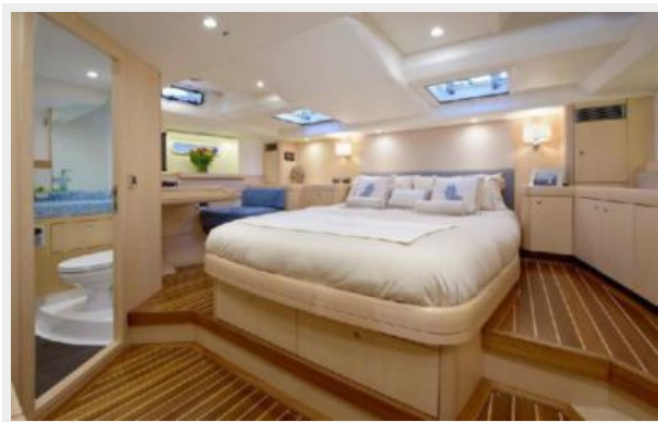
LADY MARIPOSA - 3.jpg