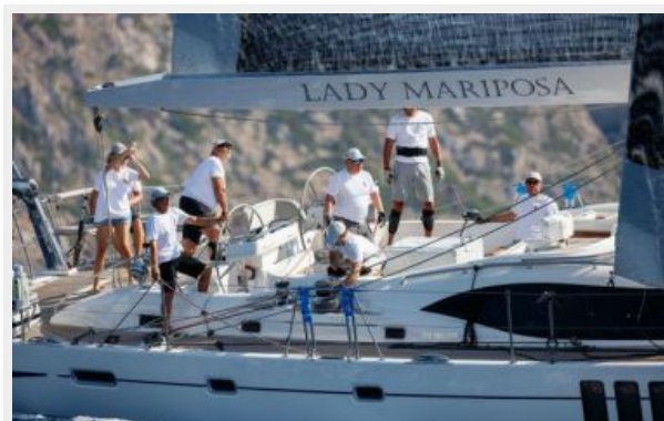
LADY MARIPOSA - 17.jpg