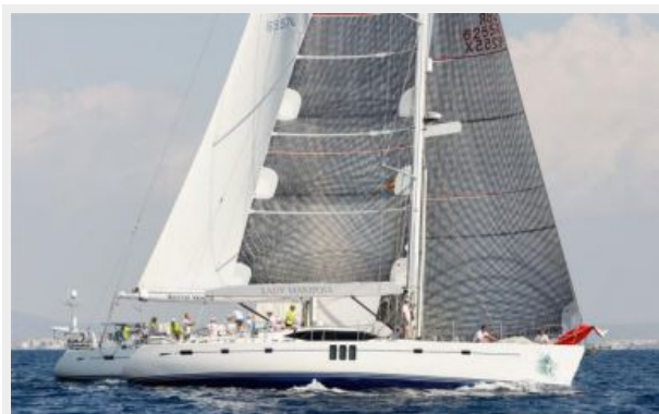
LADY MARIPOSA - 18.jpg